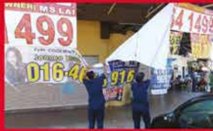
OPERASI PENURUNAN IKLAN HARAM-SEKITAR TAMAN MOUNT AUSTIN