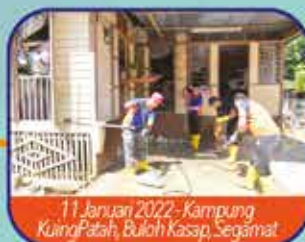
11 Januari 2022 - Kampung Kuing Patah, Buloh Kasap, Segamat