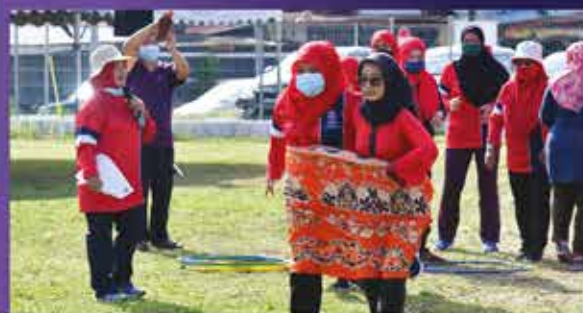
SUKANEKA SEJIWA ZON BAKAR BATU DI PADANG BOLA KG. BAKAR BATU 19 FEBRUARI 2022