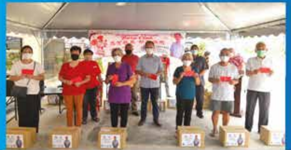
PENYAMPAIAN BAKUL MAKMUR TAHUN BAHARU CINA ZON MOUNT AUSTIN DI KG. BARU PANDAN 15 JANUARI 2022