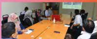
Melihat konsep & mendengar taklimat mengenai Bilik Pusat Kawalan Trafik yang digunakan oleh MBBJ bagi mengurangkan kesesakan lalu lintas di kawasan MBBJ.