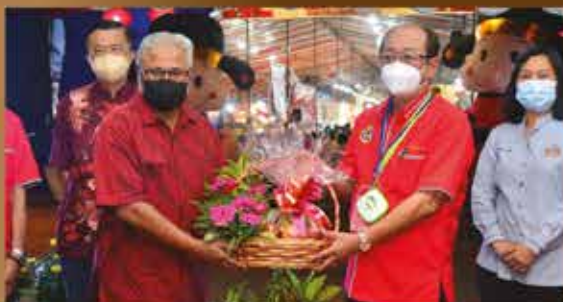
KARNIVAL TAHUN BAHARU CINA ZON JOHOR JAYA DI JALAN DEDAP 14, TAMAN JOHOR JAYA 22 JANUARI 2022