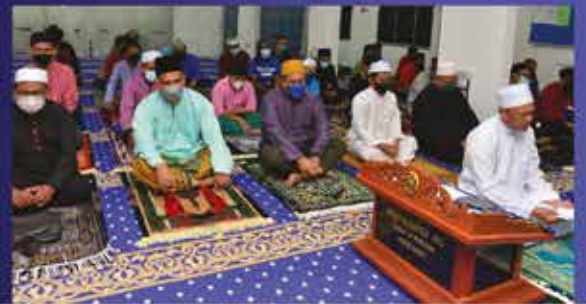
MAJLIS SOLAT HAJAT ZON SETIA AUSTIN DI SURAU AL-RAYYAN JP PERDANA 28 JANUARI 2022