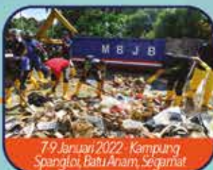
7-9 Januari 2022 - Kampung Spangloi, Batu Anam, Segamat

Anggota Southern Volunteers MBBJ komited untuk meneruskan kerja-kerja pembersihan sampah longgok di kawasan terjejas walaupun sehingga waktu malam bagi mengelakkan isu penyakit berjangkit bawaan air, penyakit berjangkit bawaan lalat, penyakit kencing tikus dan penyakit lain yang berbahaya.