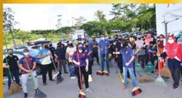
PROGRAM 'SEARCH AND DESTROY' (SND) ZON TELUK DANGA DI PANGSAPURI SERI DANGA 12 FEBRUARI 2022