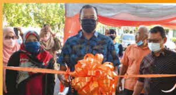
PROGRAM PUSAT INTERVASI PEMULIHAN TERAPI ZON DATO' ONN DI 'SEA ACADEMY' 12 FEBRUARI 2022