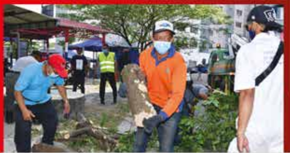
PROGRAM 'SEARCH AND DESTROY' (SND) ZON BAKAR BATU DI PPR HAJAH HASNAH 29 JANUARI 2022