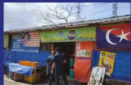
PROTOKOL PEMASANGAN BENDERA DI SEKITAR ZON MOUNT AUSTIN