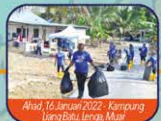
Ahad, 16 Januari 2022 - Kampung Liang Batu, Lempa, Muar