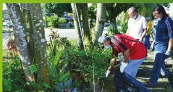
PROGRAM 'SEARCH AND DESTROY' (SND) ZON BANDAR BARU UDA DI JALAN PADI MAHSURI 19 MAC 2022