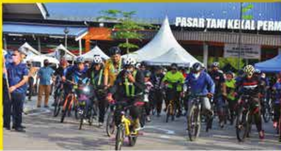
PROGRAM KAYUHAN ZON PERMAS JAYA DI TAPAK PASAR TANI PERMAS JAYA 15 JANUARI 2022