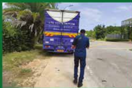
PENGUATKUASAAN KENDERAAN BERAT PERDAGANGAN DI ZON MOUNT AUSTIN

MAJLIS BANDARAYA JOHOR BAHRU (JANUARI - MAC 2022)