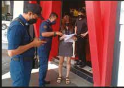
OPERASI PEMATUHAN SOP (FASA PEMULIHAN NEGARA PPN) SEKITAR ZON KEMPAS & TAMPOI