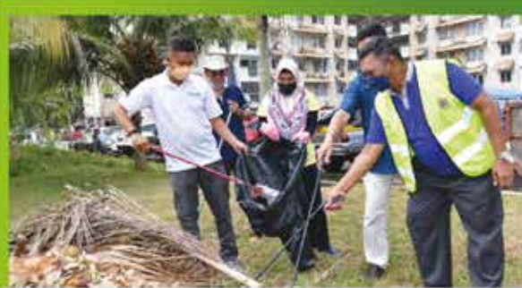
PROGRAM 'SEARCH AND DESTROY' (SND) ZON BANDAR DI PANGSAPURI BUKIT SAUJANA 5 FEBRUARI 2022