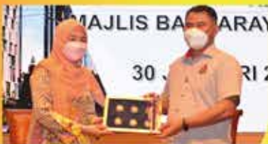
Perkongsian ilmu berkaitan pengurusan gelandangan di sekitar bandar raya Johor Bahru.