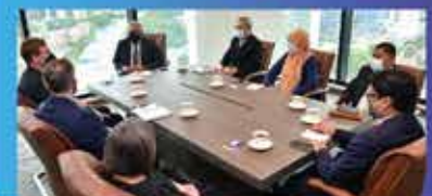
Perbincangan tentang kerjasama masa depan yang berpotensi dalam bidang alam sekitar, pemerkasaan wanita juga belia dan kesenian.