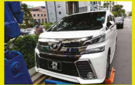
PEMINDAHAN KENDERAAN TUNDA SEKITAR PUSAT BANDAR JOHOR BAHRU