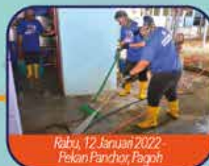
Rabu, 12 Januari 2022 - Pekan Panchar, Pagoh