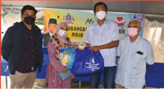
PROGRAM BAKUL MAKMUR ZON KEMPAS DI PPR KEMPAS PERMAI 1 JANUARI 2022