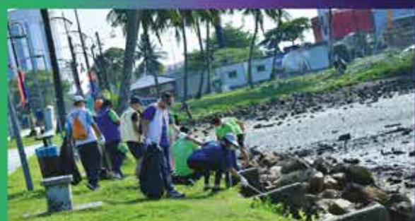
GOTONG-ROYONG ZON STULANG DI PANTAI STULANG LAUT 26 MAC 2022