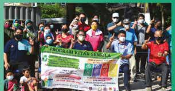
PROGRAM JOM KITAR SEMULA ZON DESA CEMERLANG DI TAMAN EHSAN JAYA 28 JANUARI 2022