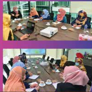
Perkongsian ilmu berkaitan: i. Pengurusan proses pindah milik. ii. Pengurusan proses cukai harta.