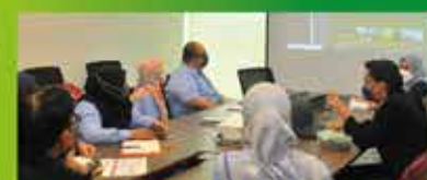
Kajian kes dalam penyediaan Petan Induk Landskap Port Dickson bagi mempelajari kejayaan program dan projek inisiatif hijau anjuran MBBJ dalam merealisasikan Port Dickson ke arah 'Bandar Rendah Karbon Menjelang 2030'.