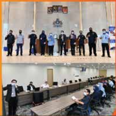
Perkongsian ilmu berkaitan pengurusan anjing liar di kawasan pentadbiran MBBJ.