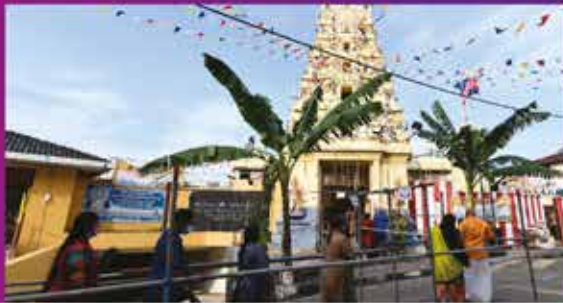
SAMBUTAN THAIPUSAM ZON TAMAN ABAD DI KUIL ARULMIGU THANDAYUTHAPANI JALAN KUIL, WADI HANA 18 JANUARI 2022