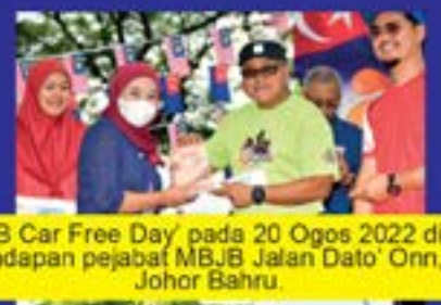
'JB Car Free Day' pada 20 Ogos 2022 di hadapan pejabat MBBJ Jalan Dato' Onn, Johor Bahru.