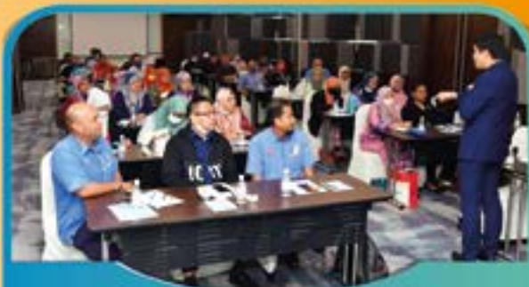
KURSUS KOMUNIKASI SECARA BERKESAN Tarikh: 19 Julai 2022