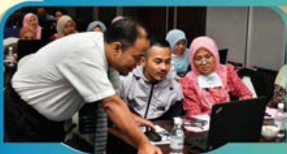
KURSUS KEMAHIRAN 'ADOBE PHOTOSHOP' Tarikh: 6 September 2022