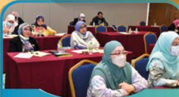
KURSUS PENGURUSAN & KESELAMATAN DOKUMEN Tarikh: 24 Ogos 2022