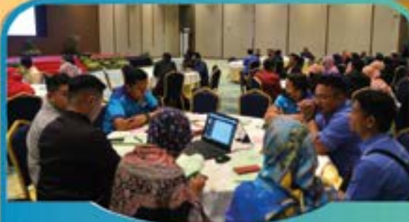
KURSUS KONVENSYEN INOVATIF & KREATIF Tarikh: 9 Ogos 2022