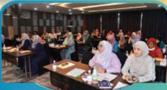
KURSUS IMEJ & PERSONALITI DIRI Tarikh: 27 Julai 2022