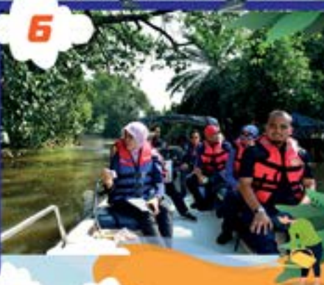
LAWATAN MENYELUSURI SUNGAI TEBRAU, JOHOR BAHRU TARIKH: 9 OGOS 2022