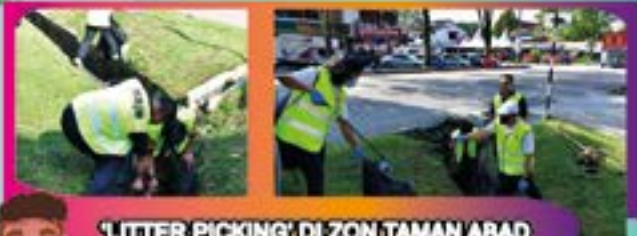
'LITTER PICKING' DI ZON TAMAN ABAD Tarikh: 24 OGOS 2022