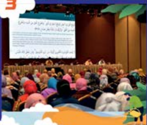
SAMBUTAN HARI RAYA AIDLADHA PERINGKAT MBBJ DI DEWAN KENANGA, MENARA MBBJ TARIKH: 14 JULAI 2022