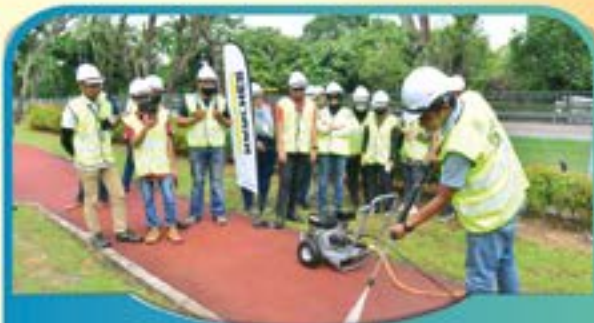
KURSUS PENYELENGGARAAN LANDSKAP & ARBORIKULTUR Tarikh: 5 – 7 Julai 2022