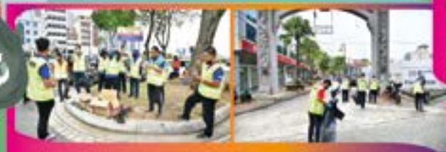
'LITTER PICKING' DI PUSAT BANDAR JOHOR BAHRU Tarikh: 7 SEPTEMBER 2022