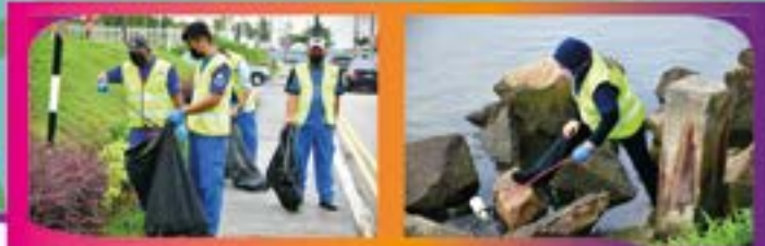
'LITTER PICKING' DI PANTAI STULANG LAUT Tarikh: 7 SEPTEMBER 2022