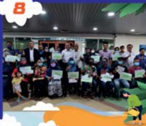
SUMBANGAN KEPADA MANGSA BENCANA RIBUT DI DEWAN JOHOR JAYA TARIKH: 16 OGOS 2022