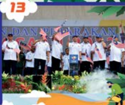
MAJLIS SAMBUTAN KEMERDEKAAN PERINGKAT NEGERI DI KOTA ISKANDAR TARIKH: 31 OGOS 2022