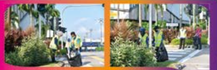
'LITTER PICKING' DI HADAPAN BANGUNAN RNF Tarikh: 10 OGOS 2022