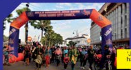
'JB Car Free Day' pada 16 Julai 2022 di hadapan pejabat MBBJ Jalan Dato' Onn, Johor Bahru.

Sekitar program 'JB Car Free Day' anjuran Majlis Bandaraya Johor Bahru yang telah diadakan di pusat bandar Johor Bahru. Terima kasih kepada semua rakan strategik dan warga bandar raya yang hadir serta memberikan kerjasama yang baik sepanjang berlangsungnya program. 'JB Car Free Day' kini kembali dengan pelbagai aktiviti sesuai untuk seisi keluarga. Selain aktiviti berbasikal dan larian santai, warga bandar raya kini boleh menyertai aktiviti liga kampung, memarah, 'plogging' dan cabutan bertuah dengan pelbagai hadiah menarik untuk dimenangi. Bermula Julai 2022, MBBJ memperkenalkan penggunaan 'Pasport JB Car Free Day' yang boleh didapati secara percuma di khemah urus setia untuk melayakkan peserta menyertai Cabutan Bertuah Mega 'Car Free Day' pada bulan Disember 2022 seterusnya memenangi hadiah utama sebuah motosikal dan 'road bike'.