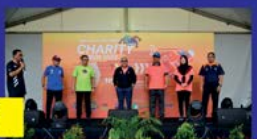
'JB Car Free Day' pada 10 September 2022 di Mid Valley Southkey, Johor Bahru.