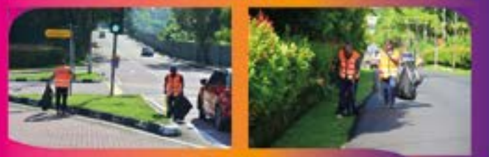
'LITTER PICKING' DI JALAN GERTAK MERAH Tarikh: 30 JULAI 2022