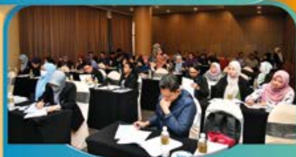
KURSUS PENULISAN KERTAS PENDAKWAAN DAN SIASATAN Tarikh: 26 September 2022