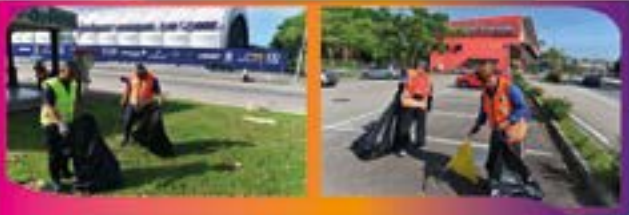
'LITTER PICKING' DI TAMAN MERDEKA Tarikh: 6 OGOS 2022