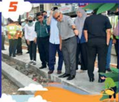
TINJAUAN PROJEK-PROJEK JALAN BERSAMA EXCO KERJARAYA TARIKH: 3 OGOS 2022