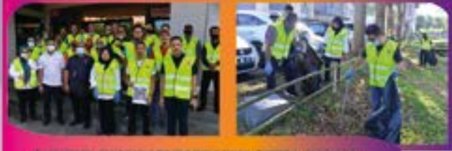
'LITTER PICKING' DI TAMAN SETIA INDAH Tarikh: 27 JULAI 2022