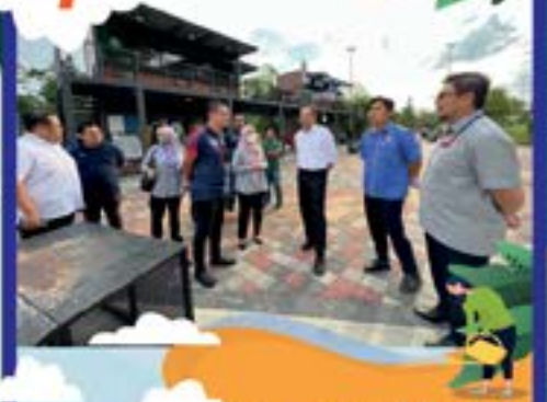
TINJAUAN EXCO PERUMAHAN & KERAJAAN TEMPATAN SERTA EXCO BELIA & SUKAN DI TMIYC, JOHOR BAHRU TARIKH: 11 JULAI 2022