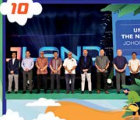
MAJLIS PELANCARAN FASA BAHARU JLAND DI KOMPLEKS SUKAN MUTIARA TARIKH: 22 OGOS 2022