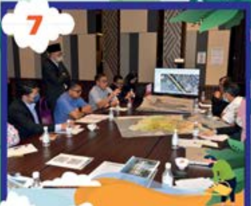
'FOCUS GROUP DISCUSSION' (FGD) DAN RANCANGAN KAWASAN KHAS (RKK) DI HOTEL TROVE, JOHOR BAHRU TARIKH: 11 OGOS 2022