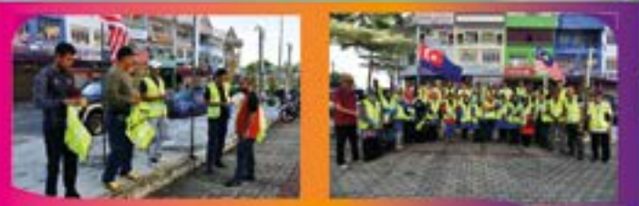
'LITTER PICKING' DI ZON KG. MELAYU Tarikh: 24 OGOS 2022