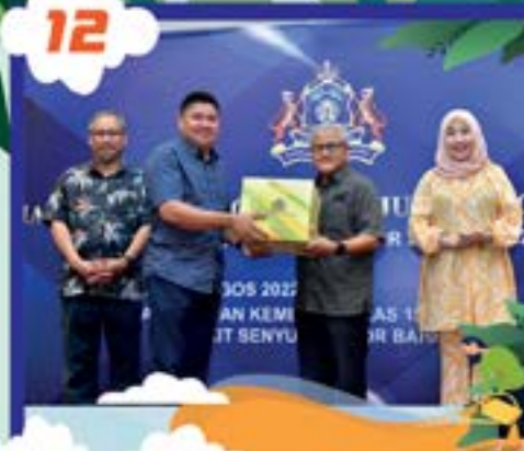
MAJLIS SEKALUNG BUDI SEJUTA PENGHARGAAN DI DEWAN KEMBOJA, MENARA MJBH TARIKH: 24 OGOS 2022