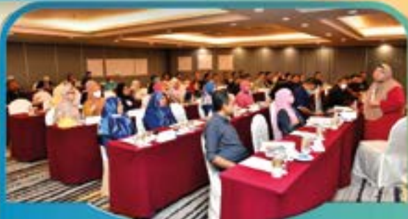
KURSUS BUDAYA KERJA CEMERLANG Tarikh: 23 Ogos 2022