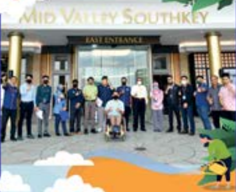
AUDIT AKSES DALAM PERSEKITARAN ALAM BINA 2022 DI JOHOR TARIKH: 21 JULAI 2022