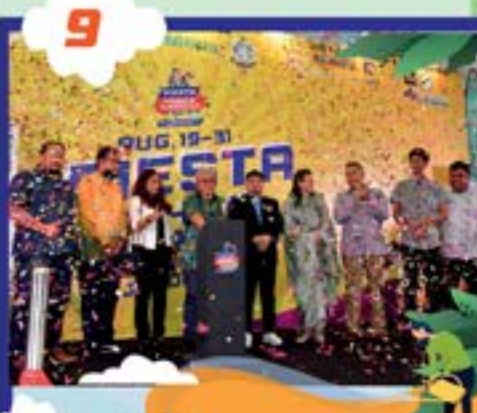
FIESTA CAHAYA KEMERDEKAAN DI BELETIME COUNTRY GARDEN TARIKH: 20 OGOS 2022