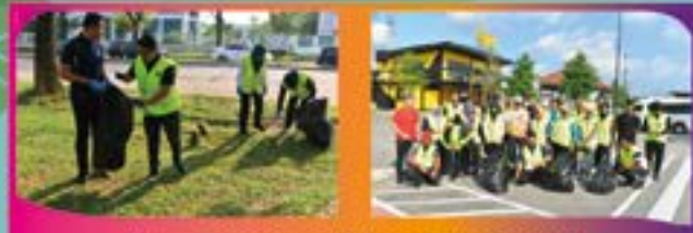
'LITTER PICKING' DI ZON DATO' ONN Tarikh: 10 OGOS 2022