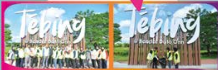
'LITTER PICKING' DI TEBING @ BANDAR DATO' ONN Tarikh: 27 JULAI 2022

MBJB menyeru warga bandar raya untuk melaksanakan tanggungjawab bagi memastikan Kempen Johor Bersih ini menjadi realiti. Untuk maklumat lanjut, hubungi Jabatan Kesihatan MBJB di talian 07-2282628. Johor Bersih, Rakyat Sejahtera.