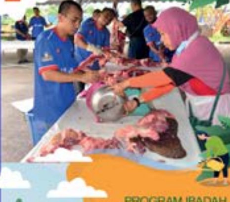
PROGRAM IBADAH KORBAN & AQIQAH MBBJ DI KOMPLEKS BENGKEL MOUNT AUSTIN TARIKH: 13 JULAI 2022