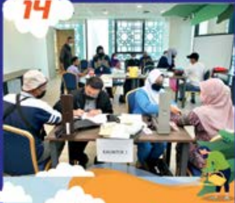
PEMERIKSAAN KESIHATAN ANGGOTA MJBH DI MENARA MJBH TARIKH: 14 SEPTEMBER 2022