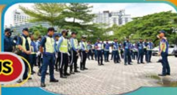
KURSUS ASAS TRAFIK WARDEN MAJLIS Tarikh: 15 – 17 Ogos 2021