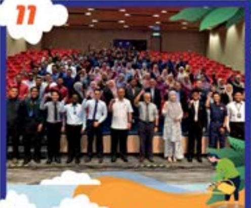
AMANAT DATUK BANDAR DAN AKU JANJI ANGGOTA BAHARU MJBH DI PANGGUNG CEMPAKA, MENARA MJBH TARIKH: 23 OGOS 2022