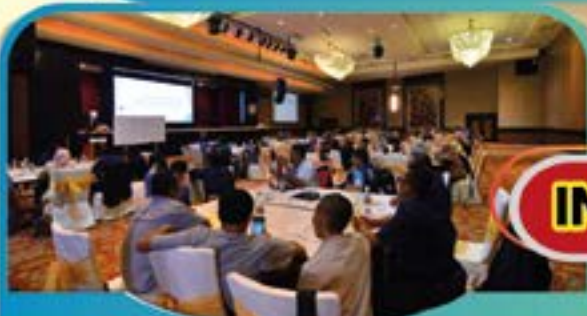
KURSUS STRATEGI & PENGURUSAN TEKANAN DI TEMPAT KERJA Tarikh: 9 Ogos 2022