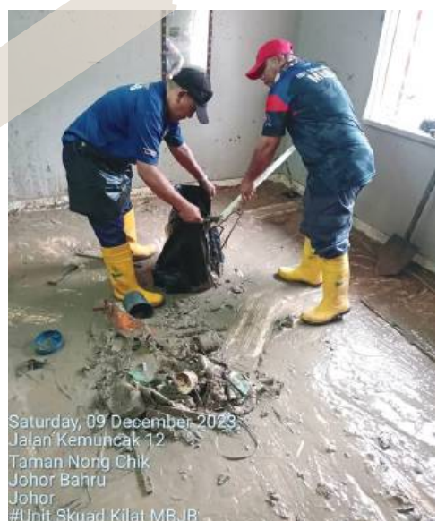
Saturday, 09 December 2023 Jalan Kemuncak 12 Taman Nong Chik Johor Bahru Johor #Unit Skuad Kilat MBBB