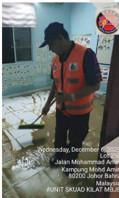
Wednesday, December 6, 2023 Lot 258 Jalan Mohammad Amin Kampung Mohd Amin 80200 Johor Bahru Malaysia #UNIT SKUAD KILAT MBBB