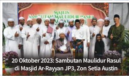
20 Oktober 2023: Sambutan Maulidur Rasul di Masjid Ar-Rayyan JP3, Zon Setia Austin