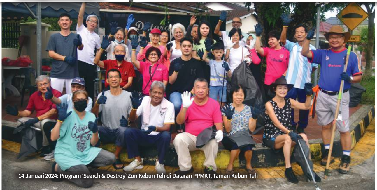
14 Januari 2024: Program 'Search & Destroy' Zon Kebun Teh di Dataran PPMKT, Taman Kebun Teh