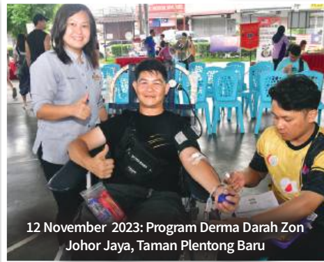
12 November 2023: Program Derma Darah Zon Johor Jaya, Taman Plentong Baru