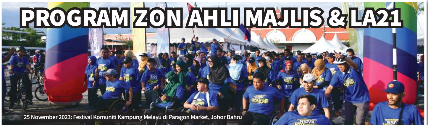
25 November 2023: Festival Komuniti Kampung Melayu di Paragon Market, Johor Bahru