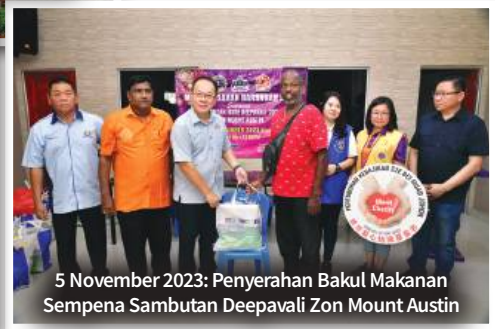
5 November 2023: Penyerahan Bakul Makanan Sempena Sambutan Deepavali Zon Mount Austin