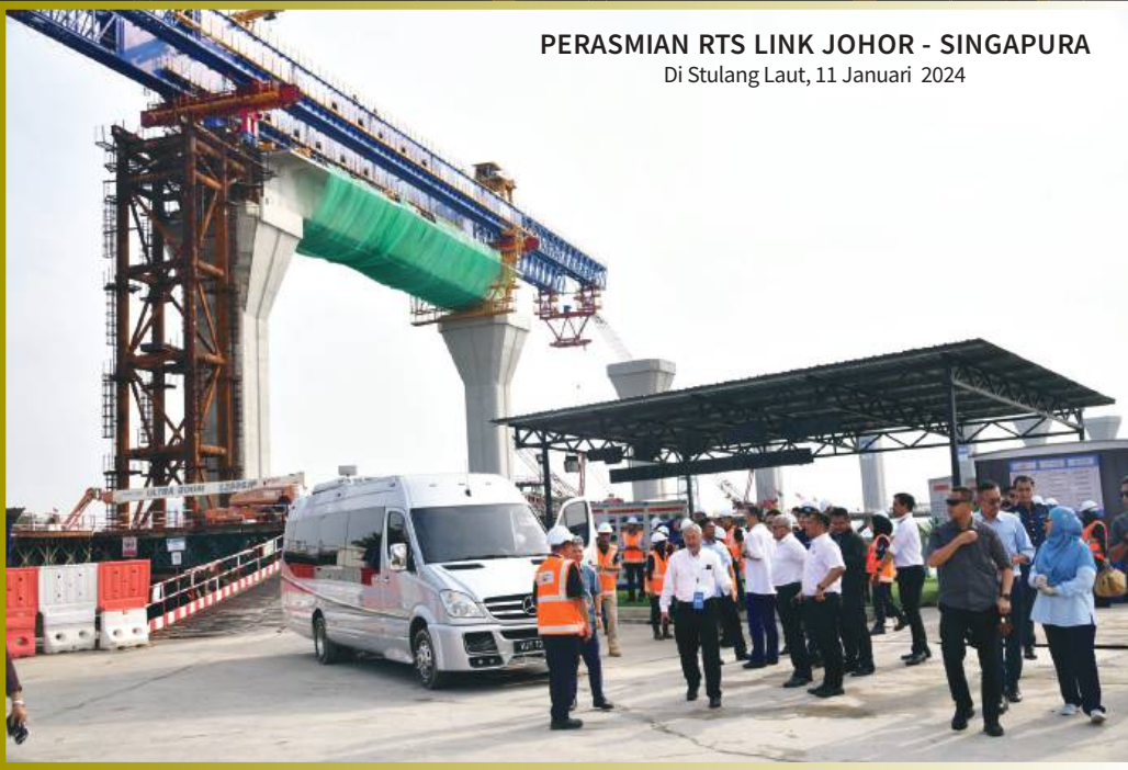
PERASMIAN RTS LINK JOHOR - SINGAPURA Di Stulang Laut, 11 Januari 2024