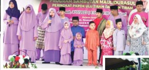
3 November 2023: Sambutan Maulidur Rasul Zon Tiram, Ulu Tiram