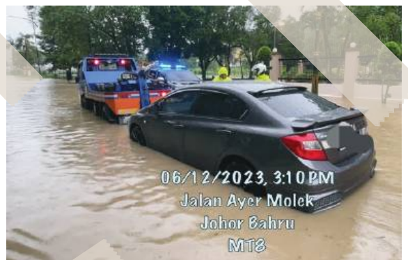
06/12/2023, 3:10 PM Jalan Ayer Molek Johor Bahru MT8