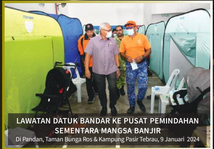
LAWATAN DATUK BANDAR KE PUSAT PEMINDAHAN SEMENTARA MANGSA BANJIR Di Pandan, Taman Bunga Ros & Kampung Pasir Tebrau, 9 Januari 2024