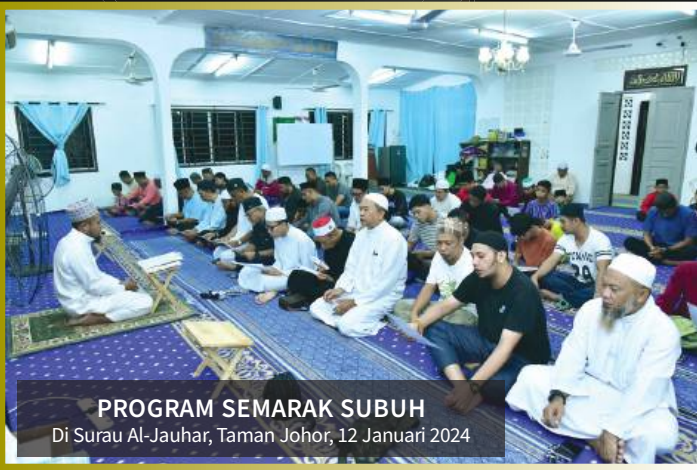
PROGRAM SEMARAK SUBUH Di Surau Al-Jauhar, Taman Johor, 12 Januari 2024