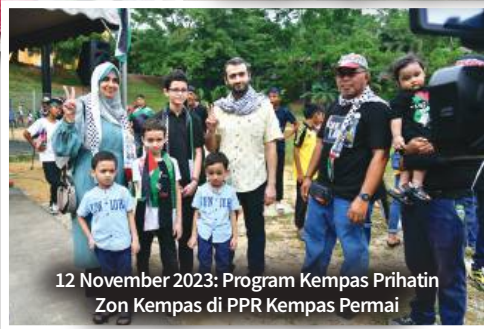
12 November 2023: Program Kempas Prihatin Zon Kempas di PPR Kempas Permai