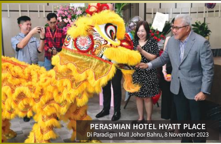
PERASMIAN HOTEL HYATT PLACE Di Paradigm Mall Johor Bahru, 8 November 2023