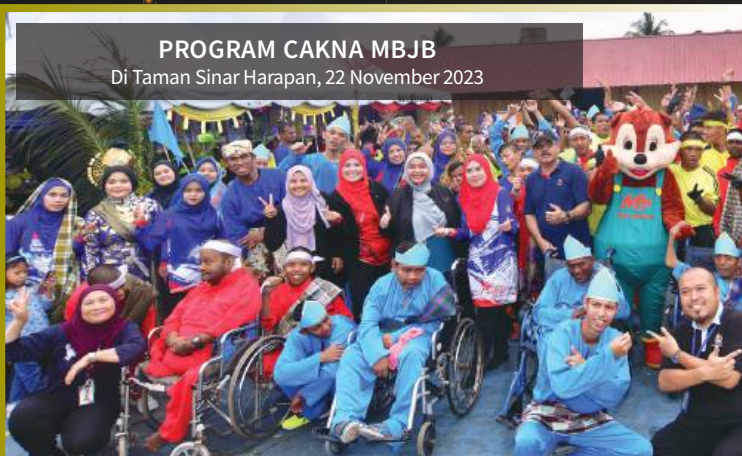
PROGRAM CAKNA MBJB Di Taman Sinar Harapan, 22 November 2023