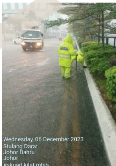
Wednesday, 06 December 2023 Stulang Darat Johor Bahru Johor #skuad kilat mbjb