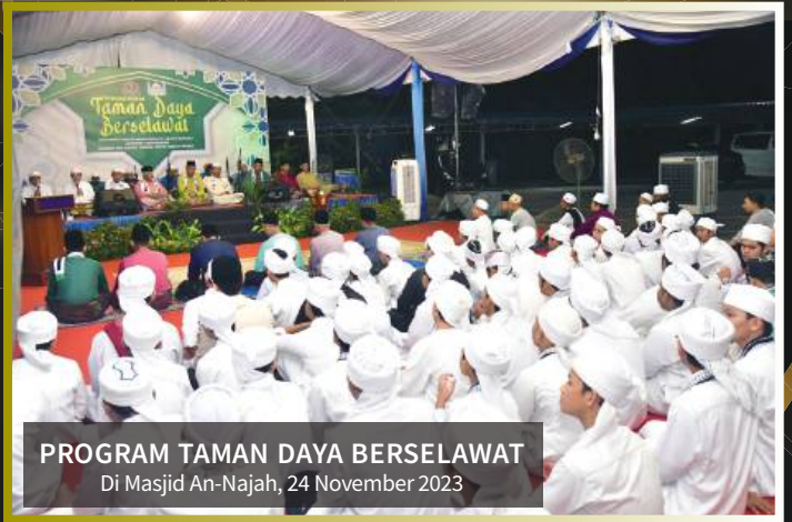
PROGRAM TAMAN DAYA BERSELAWAT Di Masjid An-Najah, 24 November 2023