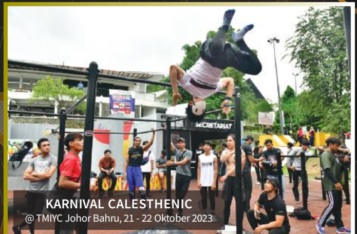
KARNIVAL CALESTHENIC @ TMIYC Johor Bahru, 21 - 22 Oktober 2023