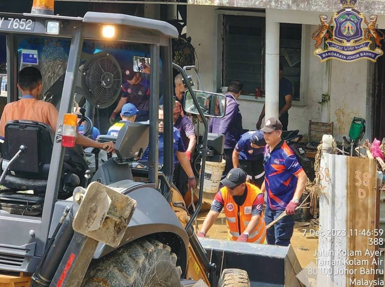
7 Dec 2023 11:46:59 388 Jalan Kolam Ayer Taman Kolam Air 80100 Johor Bahru Malaysia