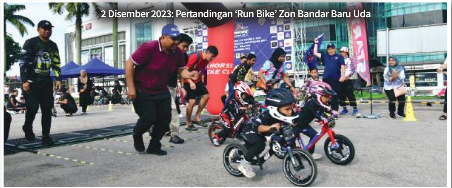
2 Disember 2023: Pertandingan 'Run Bike' Zon Bandar Baru Uda