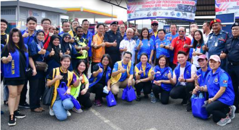
16 September 2023: Program Komuniti Polis Bersama Masyarakat di Lotus Plentong, Zon Johor Jaya