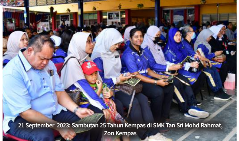
21 September 2023: Sambutan 25 Tahun Kempas di SMK Tan Sri Mohd Rahmat, Zon Kempas