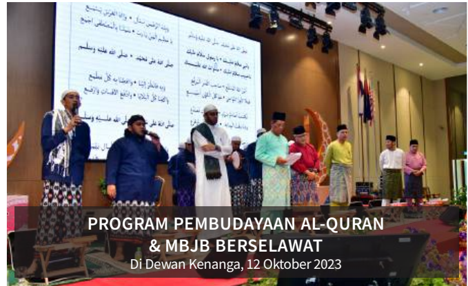
PROGRAM PEMBUDAYAAN AL-QURAN & MBBB BERSELAWAT Di Dewan Kenanga, 12 Oktober 2023