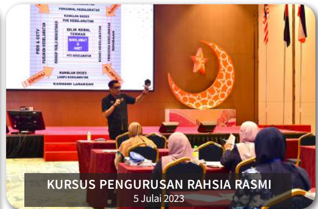
KURSUS PENGURUSAN RAHSIA RASMI 5 Julai 2023