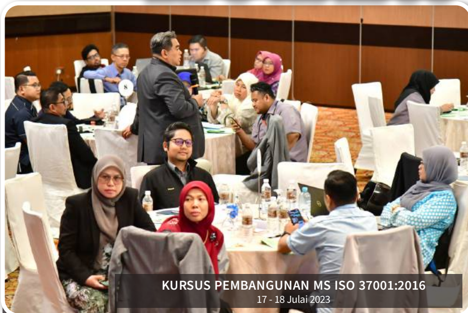
KURSUS PEMBANGUNAN MS ISO 37001:2016 17 - 18 Julai 2023