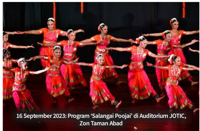
16 September 2023: Program 'Salangai Poojai' di Auditorium JOTIC, Zon Taman Abad