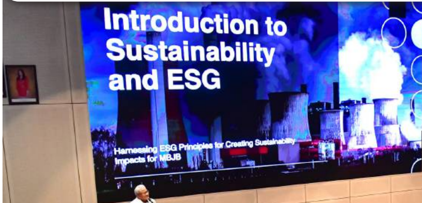
BENGGEL 'INTRODUCTION TO SUSTAINABILITY & ESG' 3 September 2023