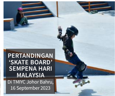
PERTANDINGAN 'SKATE BOARD' SEMENA HARI MALAYSIA Di TMIYC Johor Bahru, 16 September 2023