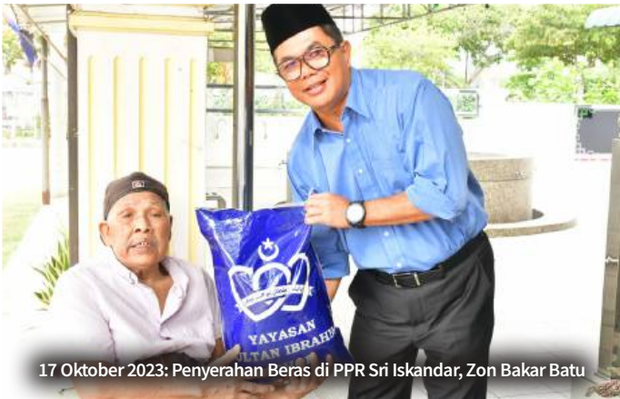
17 Oktober 2023: Penyerahan Beras di PPR Sri Iskandar, Zon Bakar Batu