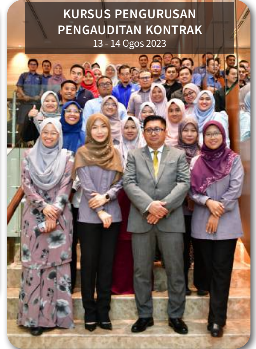
KURSUS PENGURUSAN PENGAUDITAN KONTRAK 13 - 14 Ogos 2023