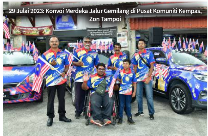
29 Julai 2023: Konvoi Merdeka Jalur Gemilang di Pusat Komuniti Kempas, Zon Tampoi