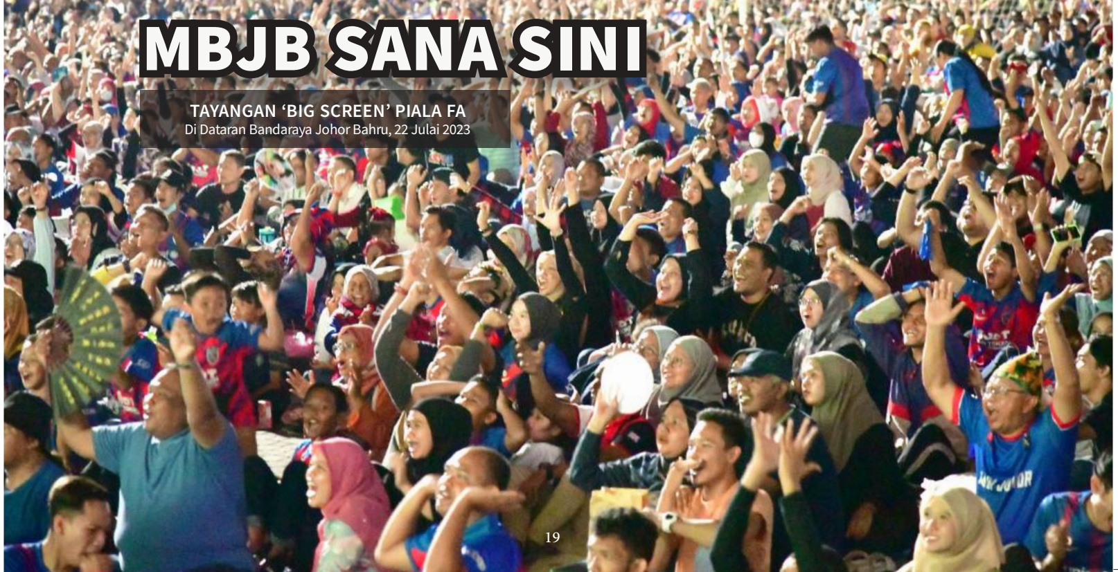
TAYANGAN 'BIG SCREEN' PIALA FA Di Dataran Bandaraya Johor Bahru, 22 Julai 2023