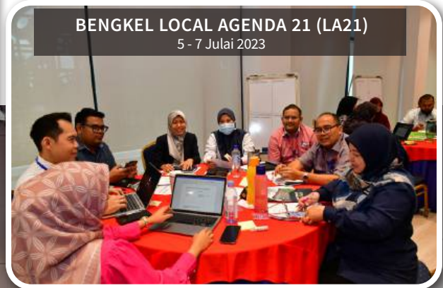
BENGGEL LOCAL AGENDA 21 (LA21) 5 - 7 Julai 2023