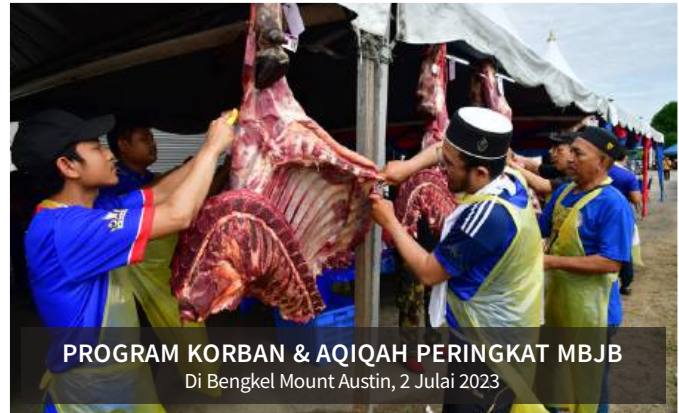
PROGRAM KORBAN & AQIQAH PERINGKAT MBBB Di Bengkel Mount Austin, 2 Julai 2023