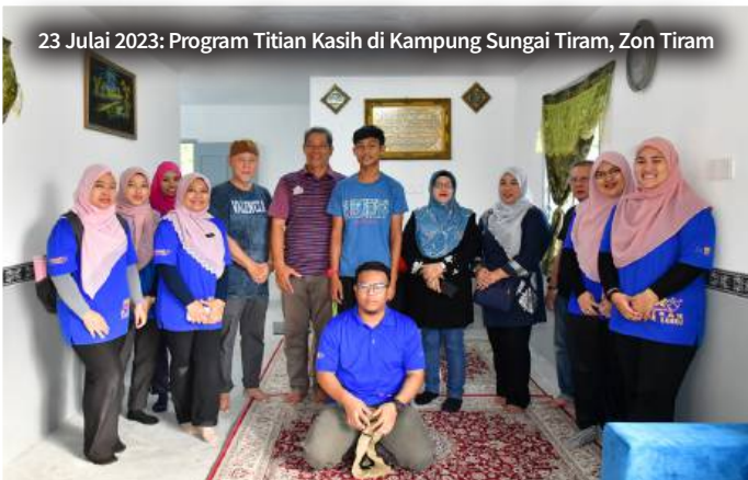
23 Julai 2023: Program Titian Kasih di Kampung Sungai Tiram, Zon Tiram