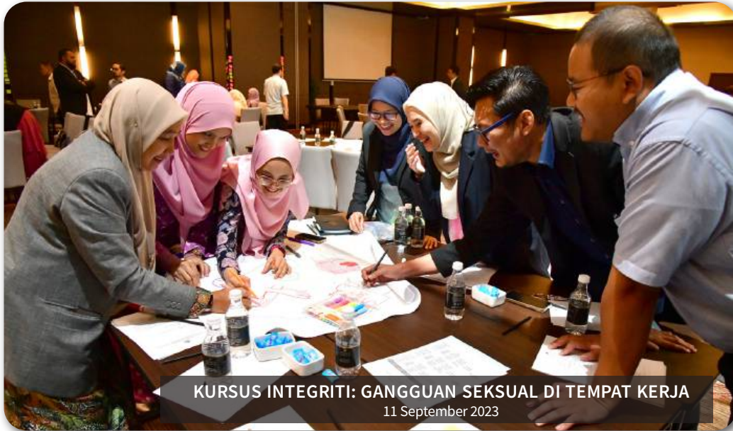
KURSUS INTEGRITI: GANGGUAN SEKSUAL DI TEMPAT KERJA 11 September 2023