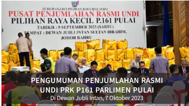
PENGUMUMAN PENJUMLAHAN RASMI UNDI PRK P161 PARLIMEN PULAI Di Dewan Jubli Intan, 7 Oktober 2023