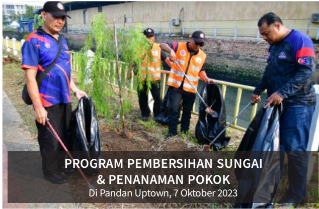
PROGRAM PEMBERSIHAN SUNGAI & PENANAMAN POKOK Di Pandan Uptown, 7 Oktober 2023