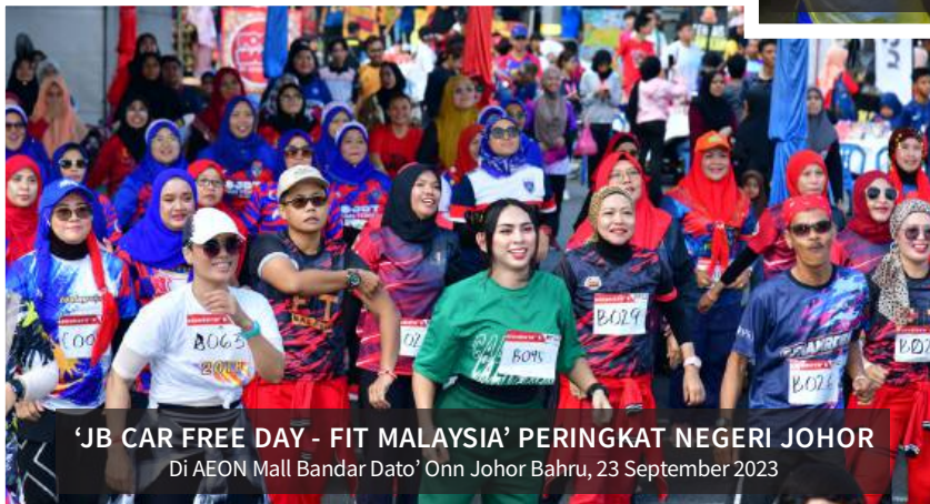
'JB CAR FREE DAY - FIT MALAYSIA' PERINGKAT NEGERI JOHOR Di AEON Mall Bandar Dato' Onn Johor Bahru, 23 September 2023