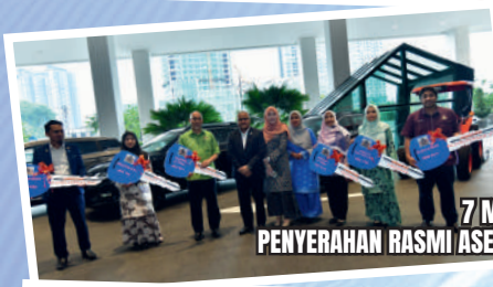
7 MEI 2024 PENYERAHAN RASMI ASET KENDERAAN JABATAN MBBJ