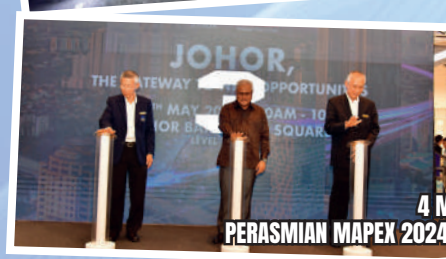
4 MEI 2024 PERASMIAN MAPEX 2024 DI JOHOR BAHRU CITY SQUARE