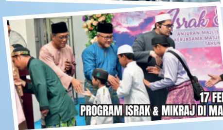
17 FEBRUARI 2024 PROGRAM ISRAK & MIKRAJ DI MASJID AL-MAHABAH TAMAN BUKIT MEWAH