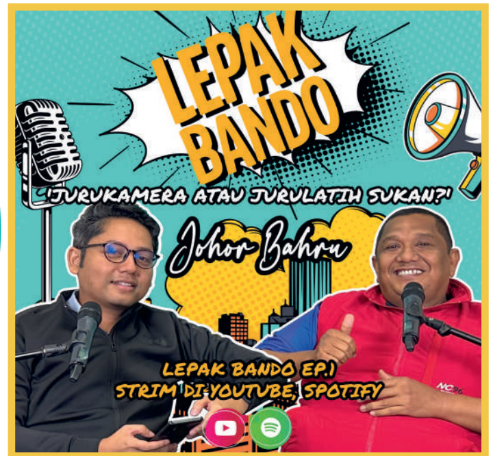
Poster promosi episod pertama 'Podcast Lepak Bando JB'