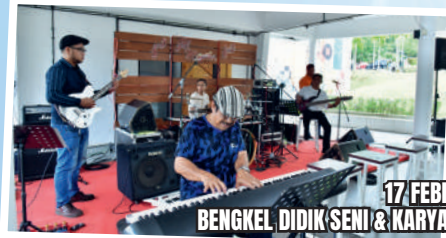
17 FEBRUARI 2024 BENKEL, DIDIK SENI & KARYA KREATIF DI TMIYC JOHOR BAHRU