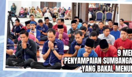
9 MEI 2024 PENYAMPAIAN SUMBANGAN KEPADA ANGGOTA PPBJB YANG BAKAL MENUNAIKAN IBADAH HAJI