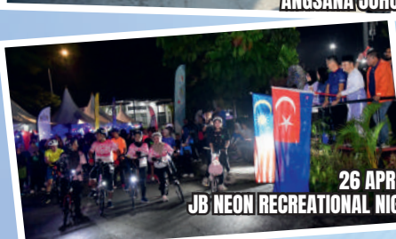
26 APRIL 2024 JB NEON RECREATIONAL NIGHT DI TMIYC JOHOR BAHRU