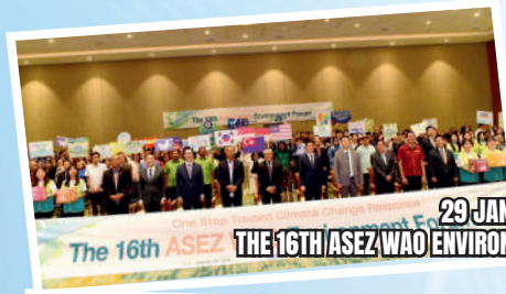
29 JANUARI 2024 THE 16TH/ASEZ/WAO ENVIRONMENT FORUM DI MENARA MBBJ