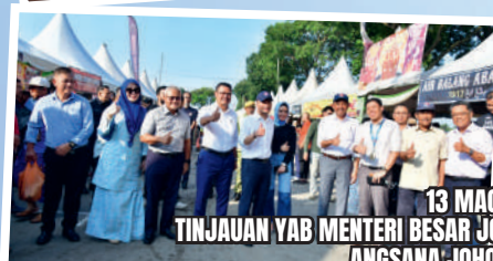
13 MAC 2024 TINJAUAN YAB MENTERI BESAR JOHOR KE TAPAK BAZAR RAMADAN ANSANA JOHOR BAHRU MALL