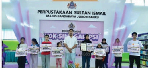
Program "Yok! Ke PSI" di Perpustakaan Sultan Ismail, Larkin