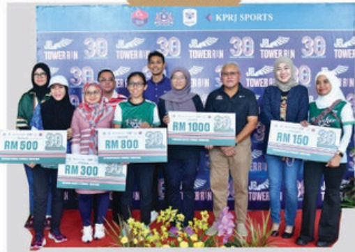
JB Tower Run @ Menara MBBJ