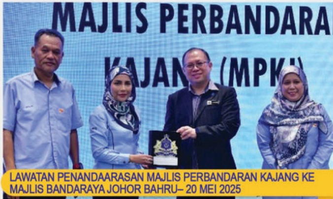
LAWATAN PENANDAARASAN MAJLIS PERBANDARAN KAJANG KE MAJLIS BANDARAYA JOHOR BAHRU- 20 MEI 2025

Info: Seramai 28 orang pegawai daripada Majlis Perbandaran Kajang berkunjung ke Majlis Bandaraya Johor Bahru bagi mempelajari ilmu berkaitan pembangunan bandar pintar serta pengoperasian "Johor Bahru Integrated Operations Control Centre" (JBIOCC).