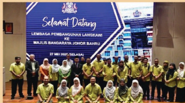
LAWATAN PENANDAARAS MAJLIS BERSAMA JABATAN (MBJ) LEMBAGA PEMBANGUNAN LANGKAWI (LADA) KE MAJLIS BANDARAYA JOHOR BAHRU - 27 MEI 2025

Info: Seramai 13 orang pegawai dari "Bintulu Development Authority" telah mengadakan lawatan penandaarasan ke Perpustakaan Sultan Ismail, Majlis Bandaraya Johor Bahru. Lawatan ini diadakan bertujuan mempelajari pelaksanaan bagi mewujudkan sebuah "Sudut Lestari" di Bintulu.