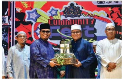
Community Fest di Pusat Sivik Larkin Johor Bahru