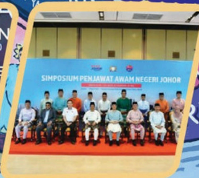
SIMPOSIUM PENJAWAT AWAM NEGERI JOHOR (JS-SEZ)