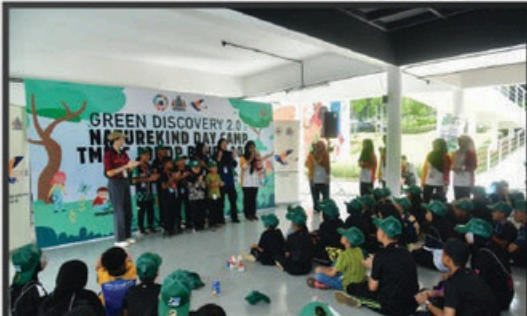
"GREEN DISCOVERY" DI TMIYC JOHOR BAHRU