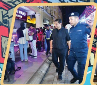
'WALKABOUT' DATUK BANDAR JOHOR BAHRU KE PUSAT BANDAR