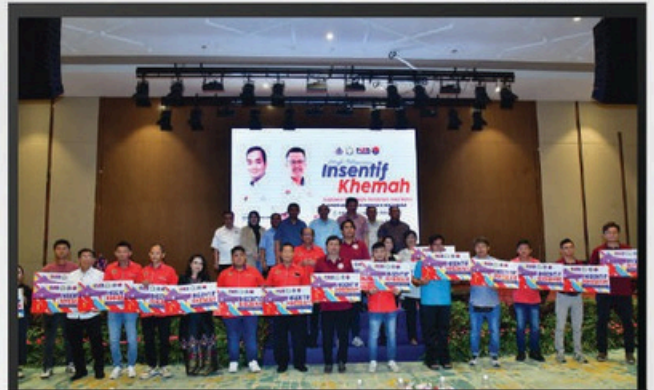
PELANCARAN INSENTIF KHEMAM USAHAWAN MIKRO MBJB