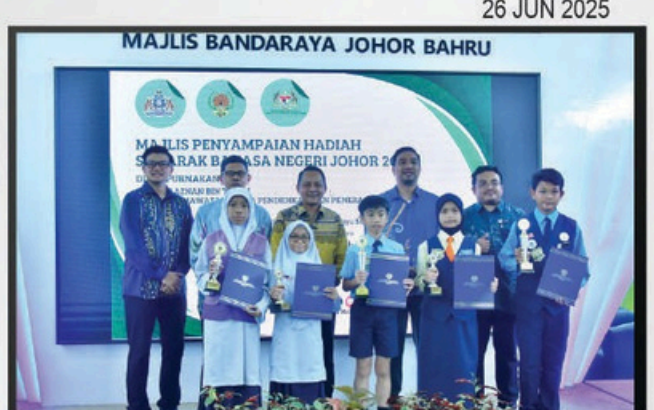
MAJLIS PENYAMPAIAN HADIAH SEMARAK BAHASA NEGERI JOHOR DI PERPUSTAKAAN SULTAN ISMAIL