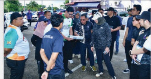
23 FEBRUARI 2025- "WALKABOUT" ZON TAMAN MOLEK DI DEWAN RAYA LAMAN TASIK PANDAN