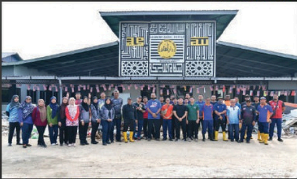
MISI BANTUAN PASCA BANJIR DI AKADEMI DARUL HUFFAZ KG. MAJU JAYA