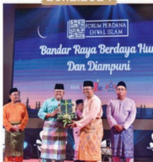
Rakaman Forum Perdana Hal Ehwal Islam di Menara MBBJ