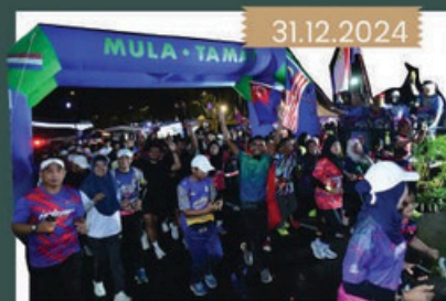
"JB Neon Recreational Night" & Sambutan Ulang Tahun ke-31 MBBJ di Dataran Bandaraya Johor Bahru