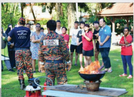
KESEDARAN KEBAKARAN DI KAWASAN PERUMAHAN ZON MOUNT AUSTIN PERDANA