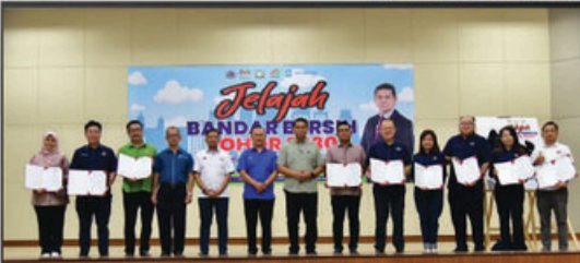
PROGRAM "JELAJAH BERSIH BANDAR" DI DEWAN DESA CEMERLANG