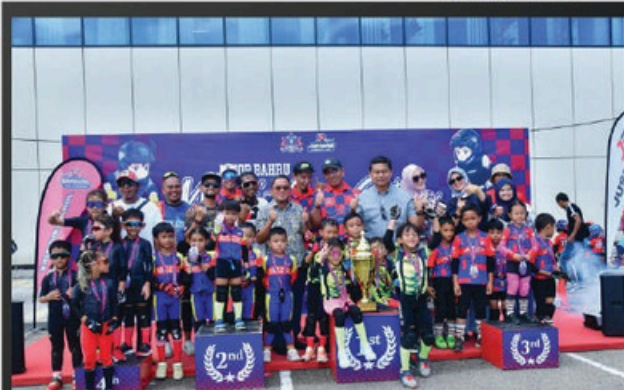
'JB RUN BIKE' EDISI PIALA DATUK BANDAR DI TOPPEN JOHOR BAHRU