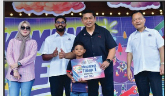
KOMUNITI FEST ZON TAMPOI DI B5 STREET MARKET