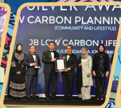
MBJB TERIMA PENGIKTIRAFAN DI MIP PLANNING AWARDS 2024