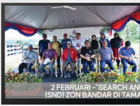
2 FEBRUARI - "SEARCH AND DESTROY" (SND) ZON BANDAR DI TAMAN NONG CHIK