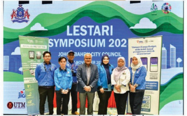
Simposium Lestari Johor Bahru