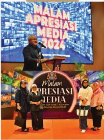
Malam Apresiasi Media 2024