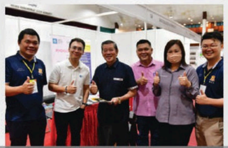
17 MEI 2025- PROGRAM KARNIVAL PENDIDIKAN ZON JOHOR JAYA DI DEWAN MUAFAKAT JOHOR JAYA