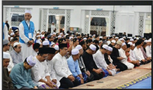
PROGRAM "SEMARAK SUBUH" DI MASJID SULTAN ISKANDAR, BANDAR DATO' ONN