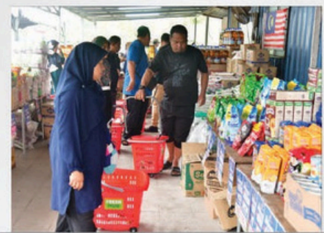
4 MEI 2025- PROGRAM JUALAN RAHMAH ZON AUSTIN DUTA DI TAMAN IMPIAN RIA, IMPIAN INDAH