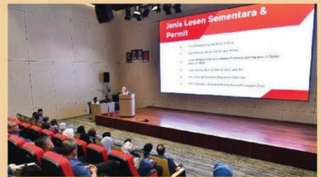
LAWATAN PENANDAARASAN MAJLIS BANDARAYA SHAH ALAM KE JABATAN PELESENAN MAJLIS BANDARAYA JOHOR BAHRU - 30 MEI 2025

Info: Seramai 28 orang delegasi dari Lembaga Pembangunan Langkawi (LADA) berkunjung ke Majlis Bandaraya Johor Bahru bagi sesi bertukar pendapat dan pengalaman berkaitan pengurusan Mesyuarat Bersama Jabatan (MBJ) yang dilaksanakan di Majlis Bandaraya Johor Bahru.