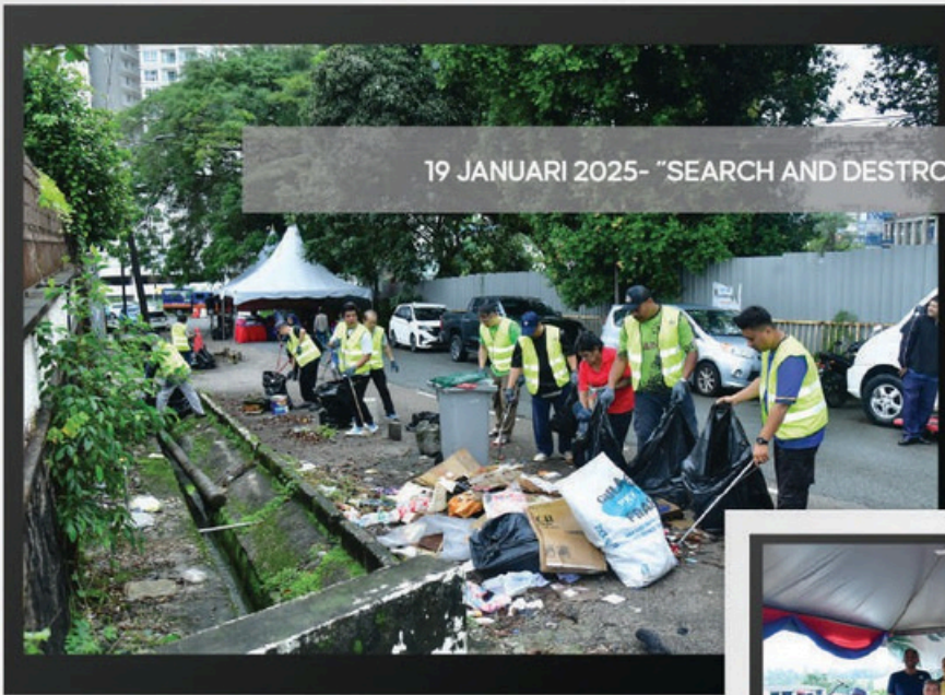
19 JANUARI 2025- "SEARCH AND DESTROY" (SND) ZON STULANG DI KIM TENG PARK