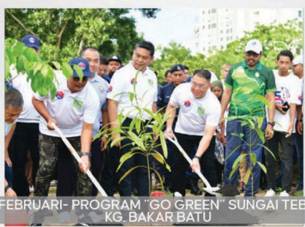
23 FEBRUARI- PROGRAM "GO GREEN" SUNGAI TEBRAU, KG. BAKAR BATU