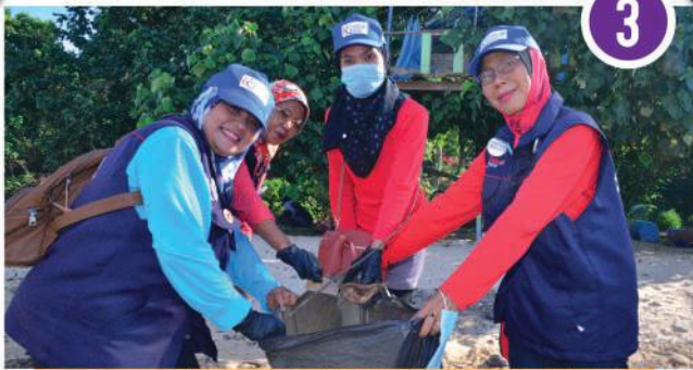
Gotong - Royong Bersih Pantai Zon Permas Jaya di Pantai Senibong