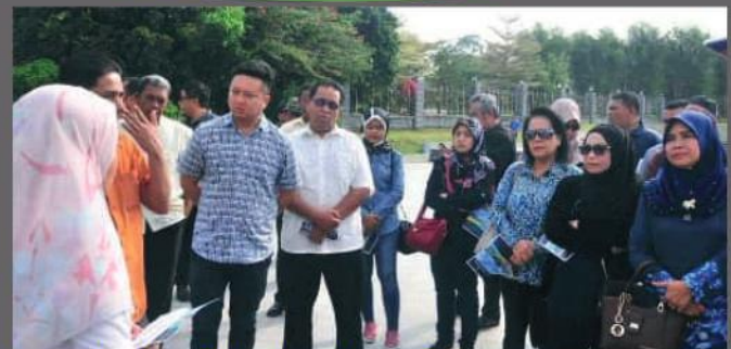
Lawatan dari Majlis Perbandaran Kangar, Perlis