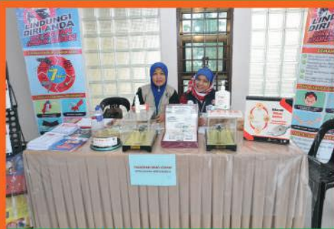
Karnival Maal Hijrah di Dewan Jubli Perak Bandar Baru Uda, Johor Bahru