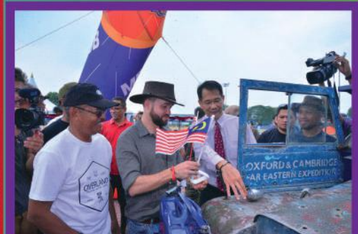
Pelepasan Konvoi 'The Last Overland' Singapore-London di Dataran Bandaraya Johor Bahru