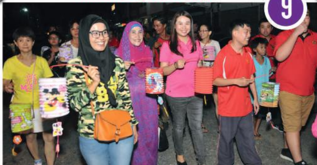
Pesta Tanglung Zon Johor Jaya di Jalan Teratai, Taman Johor Jaya