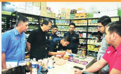
Operasi di Angsana Johor Bahru Mall Tarikh : 24 Julai 2019