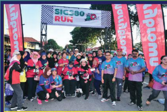
Larian Sultan Ibrahim Girl School (SIGS) sempena 80 tahun