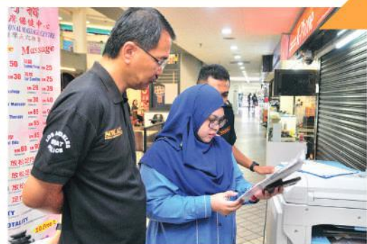
Operasi di Holiday Plaza, Johor Bahru Tarikh : 17 Julai 2019