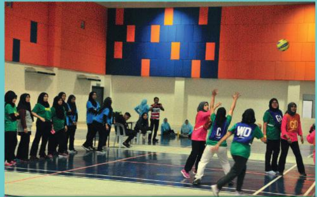
Sukan Bola Jaring di Dewan Muafakat Taman Adda, Johor Bahru Tarikh: 25 Julai 2019

Kategori: Beregu Lelaki, Beregu Wanita dan Trio Johan: Jabatan Penguatkuasaan Naib Johan: Jabatan Kejuruteraan Tempat Ketiga: Jabatan Penilaian Tempat Keempat: Jabatan Kesihatan