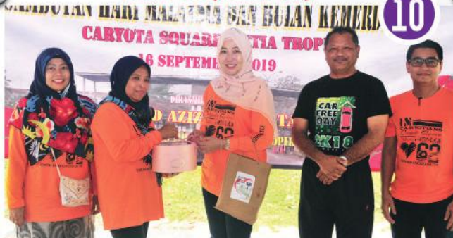
Sambutan Hari Malaysia Zon Bandar Dato' Onn di Caryota Square, Taman Setia Tropika