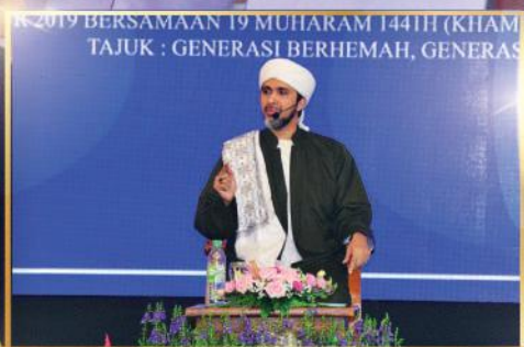
PROGRAM SANTAI ILMU & CERAMAH PERDANA