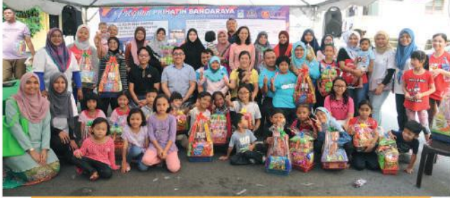
Program Prihatin Bandaraya Zon Plentong dan Taman Rinting di Rumah Pangsa Daisi, Plentong