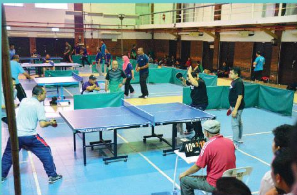
Sukan Ping Pong di Dewan Sri Tebrau, Johor Bahru Tarikh: 22 Ogos 2019

Johan: Jabatan Landskap Naib Johan: Jabatan Penilaian Tempat Ketiga: Jabatan Kesihatan Tempat Keempat: Jabatan Pengurusan