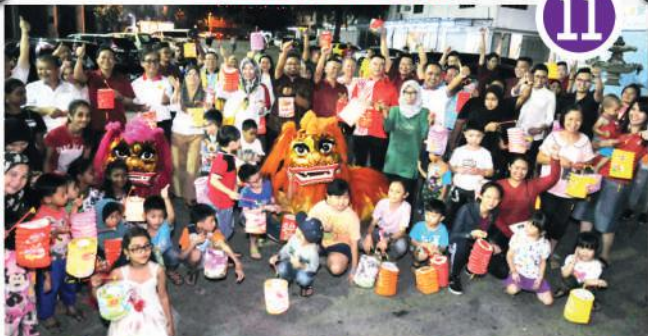
Pesta Tanglung Zon Pelangi Indah di Jalan Beladau, Taman Putri Wangsa