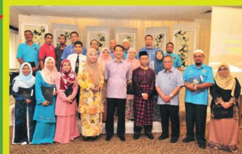
Majlis Meraikan Pesara & Anugerah Kecemerlangan Pelajar anjuran PPPJB di Sangkar Kristal Johor Bahru