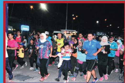
'Dataran Recreational Day' di Dataran Bandaraya Johor Bahru