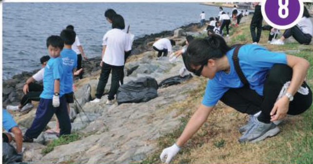
Program Bersihkan Pantai Zon Stulang di Pantai Stulang