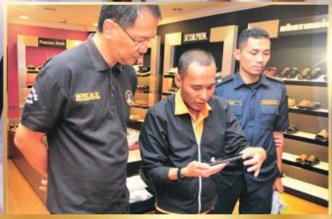
OPERASI BANCIAN LESEN PREMIS PERNIAGAAN