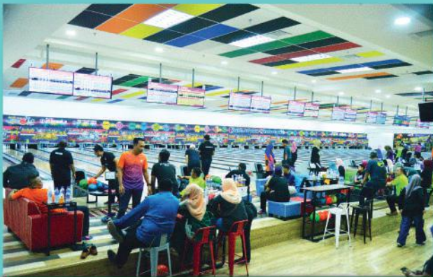
Sukan Bowling di Pelangi Leisure Mall, Johor Bahru Tarikh: 11 Julai 2019

Majlis Bandaraya Johor Bahru (MBJB) di bawah Bahagian Sukan, Jabatan Pembangunan Kemasyarakatan telah menganjurkan pertandingan sukan antara jabatan bagi mencari dan menyerlahkan bakat anggota yang cemerlang dalam penglibatan acara sukan mewakili PBT ini sama ada di peringkat nasional mahupun antarabangsa. Berikut adalah keputusan bagi acara sukan yang dipertandingkan di peringkat jabatan dalam MBJB. Tahniah dan syabas diucapkan kepada semua pemenang dan peserta yang telah menyertai acara sukan antara jabatan ini.