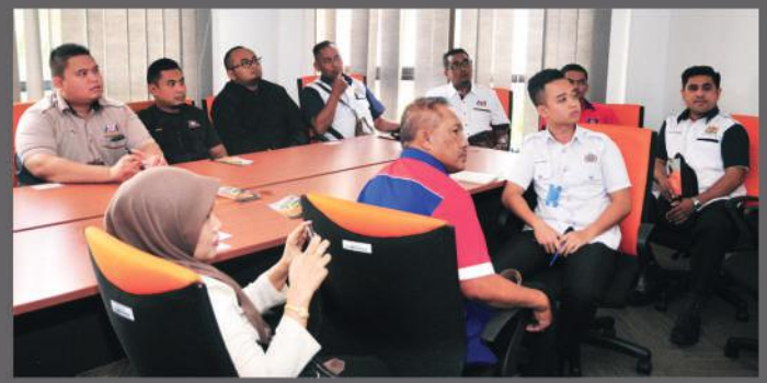
Lawatan dari Majlis Daerah Kota Tinggi