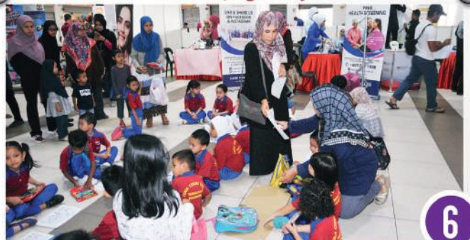
Mini Karnival Merdeka di Pasar Kampung Melayu