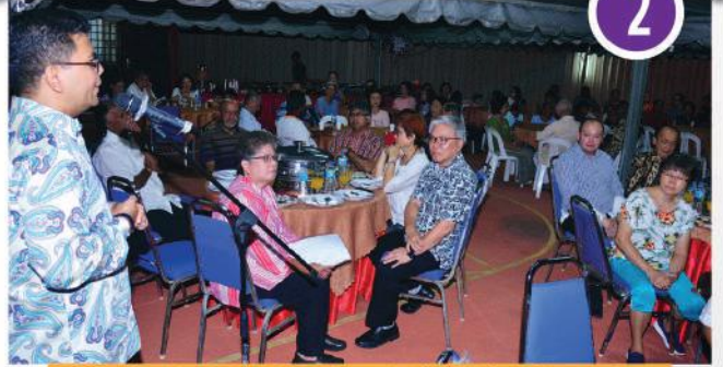
Program Komuniti Zon Kebun Teh di Jalan Kemunting, Taman Kebun Teh