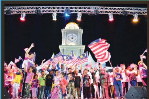
Malam Ambang Kemerdekaan di Dataran Bandaraya Johor Bahru