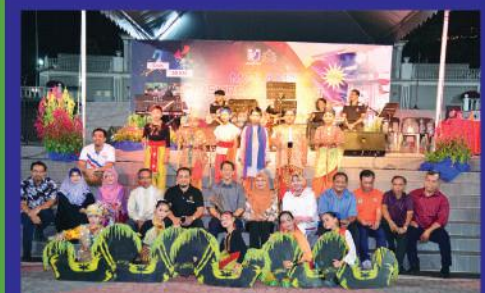
Malam Rekreasi dan Puisi Bandar Raya di Dataran Bandaraya Johor Bahru