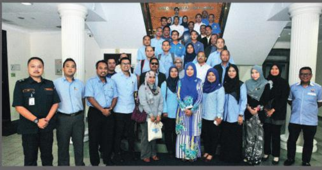
Lawatan dari Pejabat Setiausaha Kerajaan Negeri Selangor Darul Ehsan