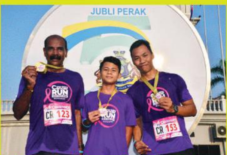
Larian Amal 'Cancer Run' Johor Bahru