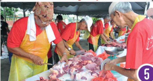
Program 'Korban' di Masjid Bandar Baru Uda