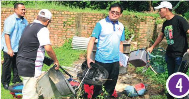
Gotong-Royong Zon Tiram di Felda Ulu Tebrau