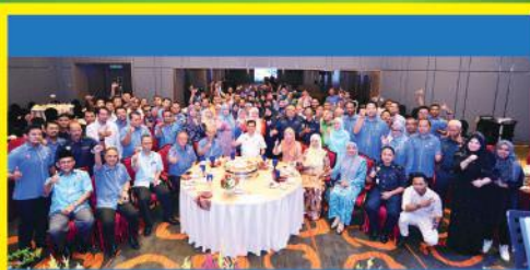
Majlis Penghargaan Kecemerlangan dan Kejayaan Warga Kerja Majlis Bandaraya Johor Bahru di Hotel Grand Paragon, Johor Bahru