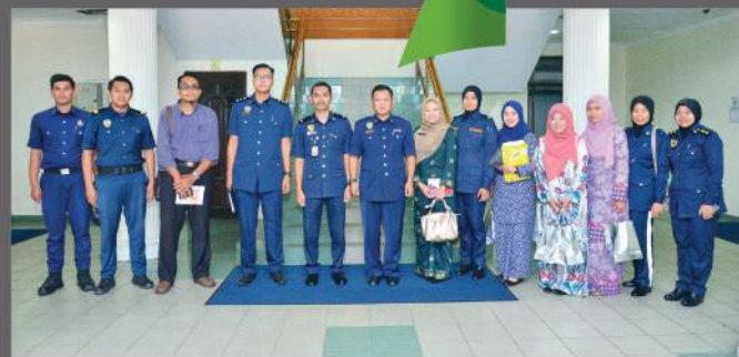
Lawatan dari Majlis Perbandaran Kluang