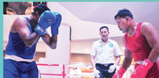
Kejohanan Tinju Piala Datuk Bandar Tarikh: 26 - 31 Ogos 2019

Kategori: Beregu Pegawai, Beregu Veteran, Beregu Lelaki, Beregu Wanita dan Perseorangan Lelaki Johan: Jabatan Landskap Naib Johan: Jabatan Penguatkuasaan Tempat Ketiga: Jabatan Penilaian