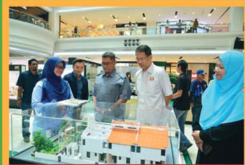
Perasmian Pameran Hartanah di Johor Bahru City Square