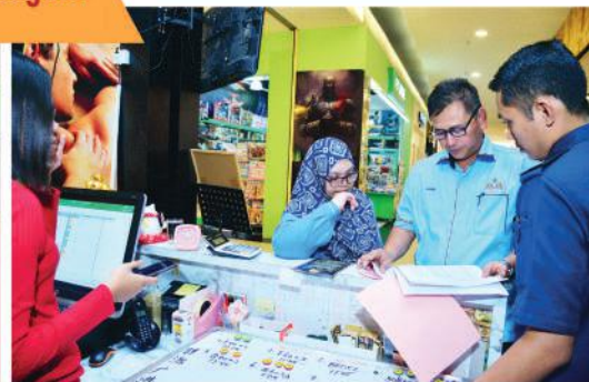
Operasi di KSL City Mall, Johor Bahru Tarikh : 25 Ogos 2019