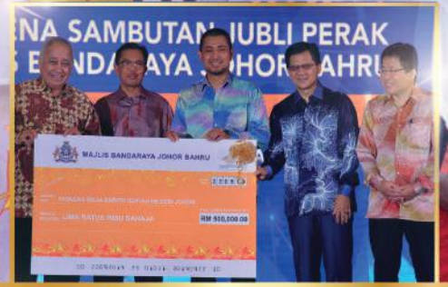
MAJLIS MAKAN MALAM AMAL