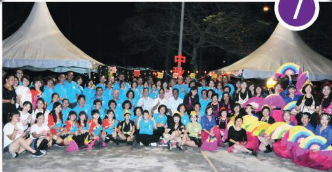
Pesta Tanglung Zon Setia Austin di Taman Gaya