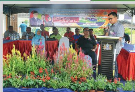
Program Kelestarian Bebas Denggi, Sampah Sarap dan Pencemaran Udara di Taman Bukit Kempas, Johor Bahru