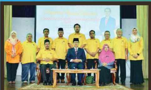
Mesyuarat Agung Koperasi Majlis Bandaraya Johor Bahru di Auditorium JOTIC, Johor Bahru