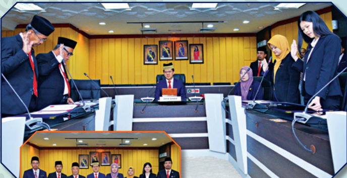
Majlis Angkat Sumpah Panel Perpustakaan Sultan Ismail Tarikh: 5 Disember 2018