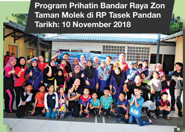
Program Prihatin Bandar Raya Zon Taman Molek di RP Tasek Pandan Tarikh: 10 November 2018