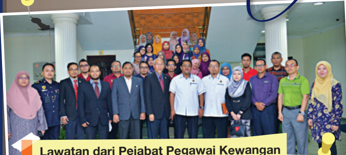
Lawatan dari Pejabat Pegawai Kewangan Negeri, Negeri Sembilan Darul Khusus