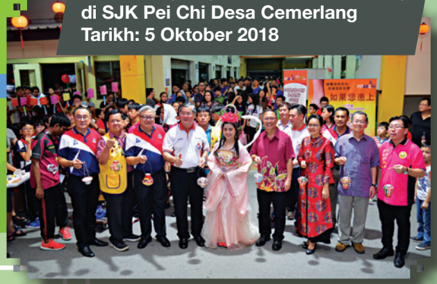
Pesta Tanglung Zon Desa Cemerlang di SJK Pei Chi Desa Cemerlang Tarikh: 5 Oktober 2018