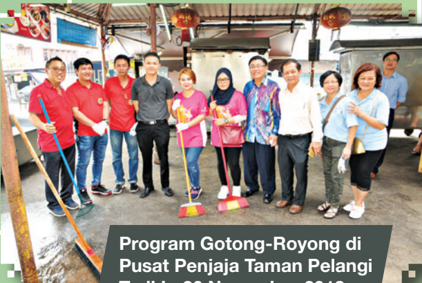
Program Gotong-Royong di Pusat Penjaja Taman Pelangi Tarikh: 20 November 2018