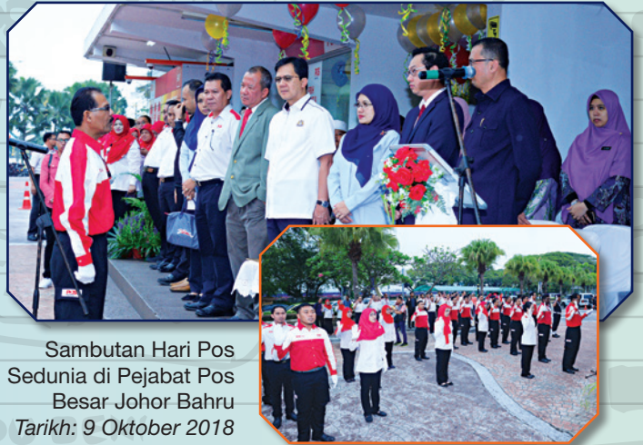
Sambutan Hari Pos Sedunia di Pejabat Pos Besar Johor Bahru Tarikh: 9 Oktober 2018