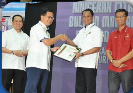
MBJB TERIMA ANUGERAH KHAS JURI, ANUGERAH CITRA BULETIN MANDALA SELATAN DBP