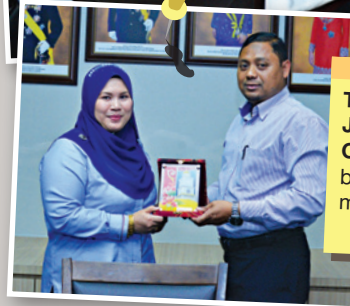
Tarikh : 7-8 November 2018 Jumlah peserta : 15 orang Objektif : Lawatan sambil belajar berkaitan sistem e-PBT bagi modul cukai taksiran harta.