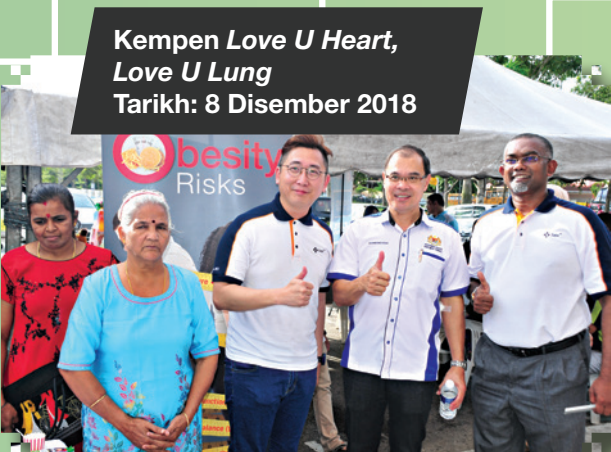
Kempen Love U Heart, Love U Lung Tarikh: 8 Disember 2018