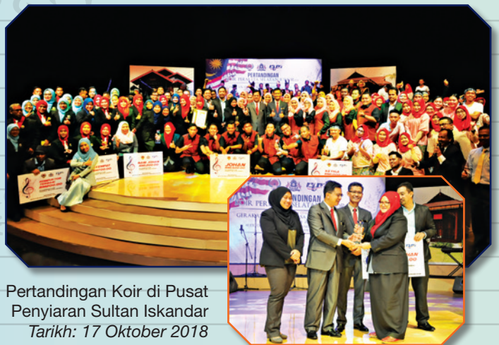
Pertandingan Koir di Pusat Penyiaran Sultan Iskandar Tarikh: 17 Oktober 2018