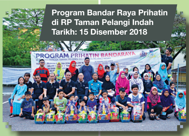
Program Bandar Raya Prihatin di RP Taman Pelangi Indah Tarikh: 15 Disember 2018