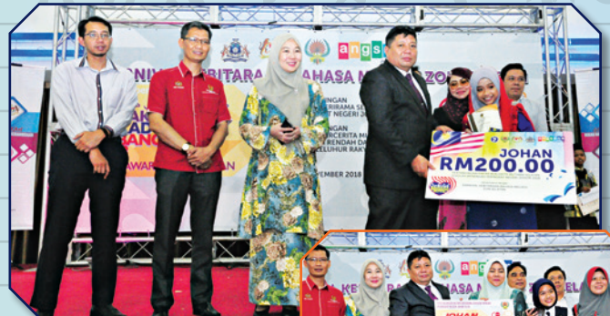
Karnival Kebitaraan Bahasa Melayu di Angsana Johor Bahru Mall Tarikh: 19 November 2018