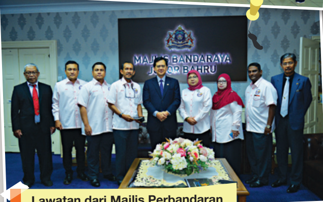
Lawatan dari Majlis Perbandaran Hang Tuah Jaya