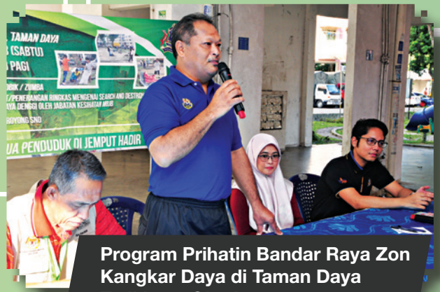
Program Prihatin Bandar Raya Zon Kangkar Daya di Taman Daya Tarikh: 20 Oktober 2018