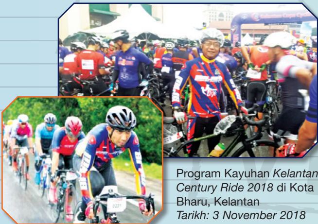
Program Kayuhan Kelantan Century Ride 2018 di Kota Bharu, Kelantan Tarikh: 3 November 2018