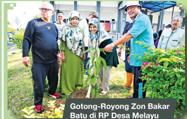
Gotong-Royong Zon Bakar Batu di RP Desa Melayu Tarikh: 6 November 2018