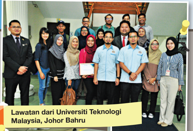
Lawatan dari Universiti Teknologi Malaysia, Johor Bahru