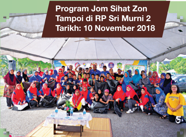
Program Jom Sihat Zon Tampoi di RP Sri Murni 2 Tarikh: 10 November 2018