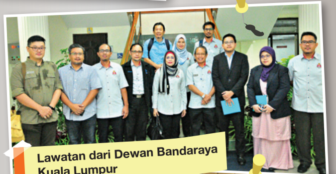
Lawatan dari Dewan Bandaraya Kuala Lumpur