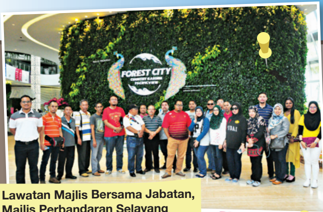
Lawatan Majlis Bersama Jabatan, Majlis Perbandaran Selayang

Tarikh : 18 November 2018 Jumlah peserta : 33 orang Objektif : Mempelajari pengalaman MBBJ bagi pengurusan Majlis Bersama Jabatan (MBJ) dan hubungan baik dengan pekerja.