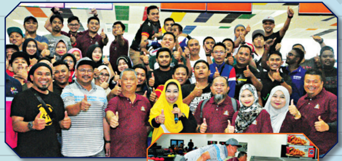
Perlawanan Boling Persahabatan MBBJ-MD Hulu Selangor Tarikh: 8 Disember 2018