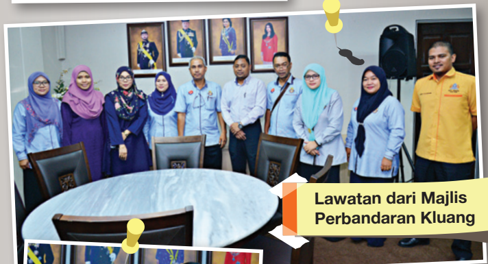
Lawatan dari Majlis Perbandaran Kluang