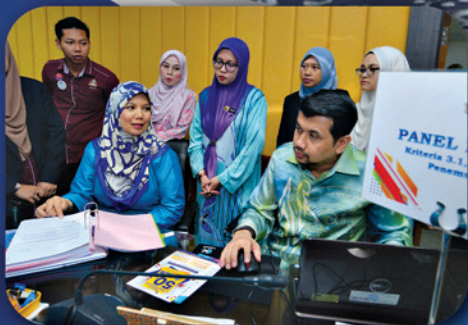
LAWATAN SISTEM PENARAFAN BINTANG PIHAK BERKUASA TEMPATAN