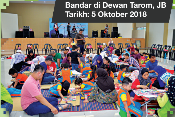
Fiesta Bersama Rakyat Zon Bandar di Dewan Tarom, JB Tarikh: 5 Oktober 2018