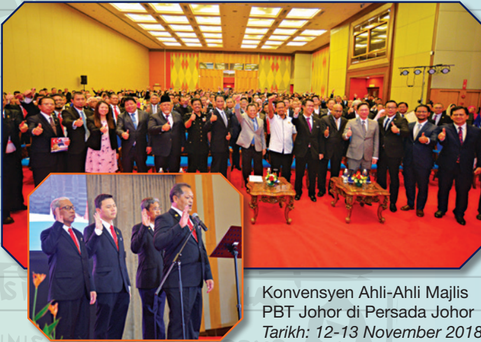
Konvensyen Ahli-Ahli Majlis PBT Johor di Persada Johor Tarikh: 12-13 November 2018