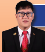
EN. POH PAI YIK Zon Taman Rinting