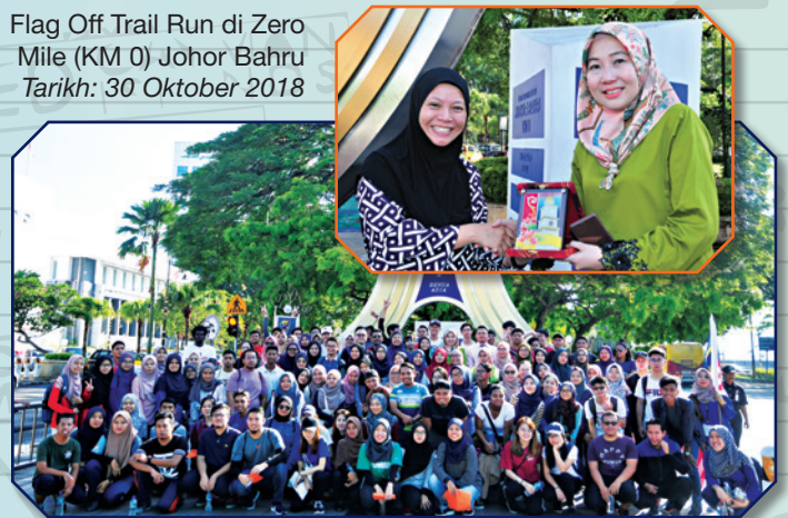
Flag Off Trail Run di Zero Mile (KM 0) Johor Bahru Tarikh: 30 Oktober 2018