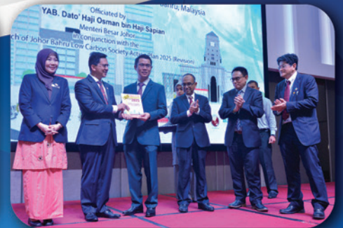
PERSIDANGAN ANTARABANGSA ASIA & SERANTAU (ICLCA)