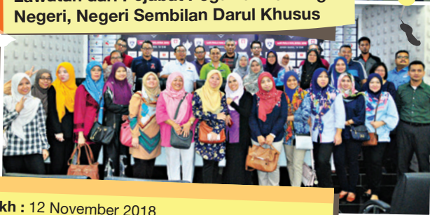
Tarikh : 12 November 2018 Jumlah peserta : 42 orang Objektif : Berkongsi pengalaman berhubung pelaksanaan perakaunan dalam pengurusan kewangan, aset dan pengurusan hasil.