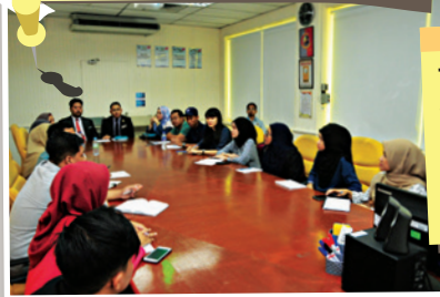
Tarikh : 29 Oktober 2018 Jumlah peserta: 20 orang Objektif : Mempelajari tentang pembangunan Johor Bahru dan Sistem i-Perolehan.