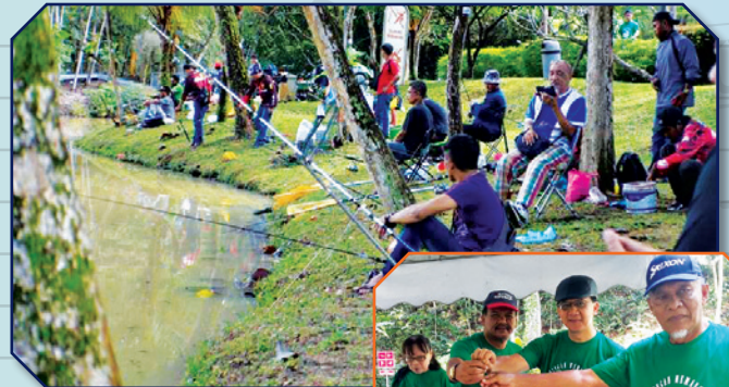
Pertandingan Memancing Amal Cerebral Palsy Spastik Tarikh: 1 Disember 2018