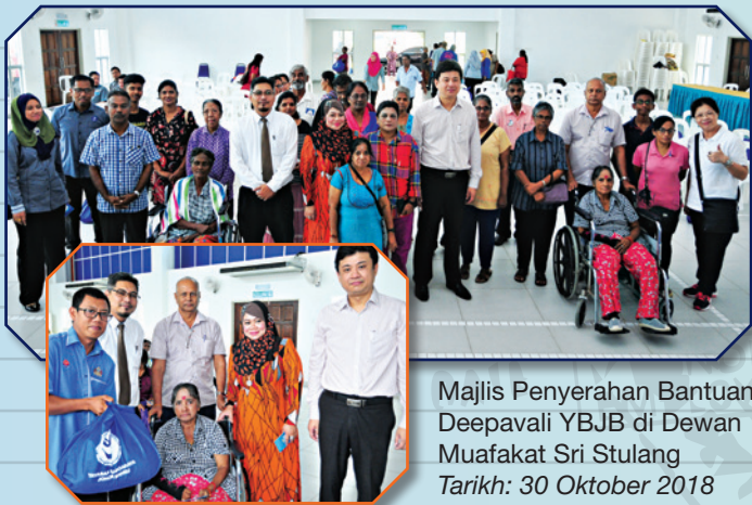
Majlis Penyerahan Bantuan Deepavali YBBJ di Dewan Muafakat Sri Stulang Tarikh: 30 Oktober 2018