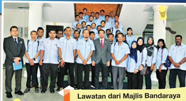
Lawatan dari Majlis Bandaraya Petaling Jaya

Tarikh : 25 November 2018 Jumlah peserta : 46 orang Objektif : Mempelajari dan meninjau aspek pengurusan kemudahan aset, fasiliti sukan dan pengurusan inventori aset dan kawasan padang.