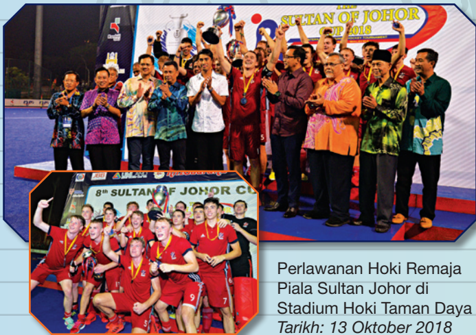
Perlawanan Hoki Remaja Piala Sultan Johor di Stadium Hoki Taman Daya Tarikh: 13 Oktober 2018