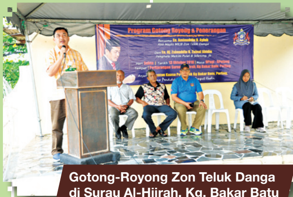
Gotong-Royong Zon Teluk Danga di Surau Al-Hijrah, Kg. Bakar Batu Tarikh: 13 Oktober 2018