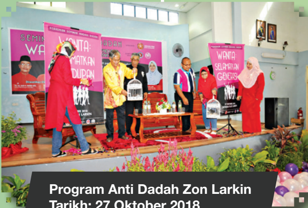
Program Anti Dadah Zon Larkin Tarikh: 27 Oktober 2018