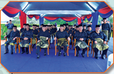
Istiadat Meletak Kerja Sempena Hari Keputeraan Sultan Johor di Istana Besar Johor Bahru Tarikh: 14 November 2018