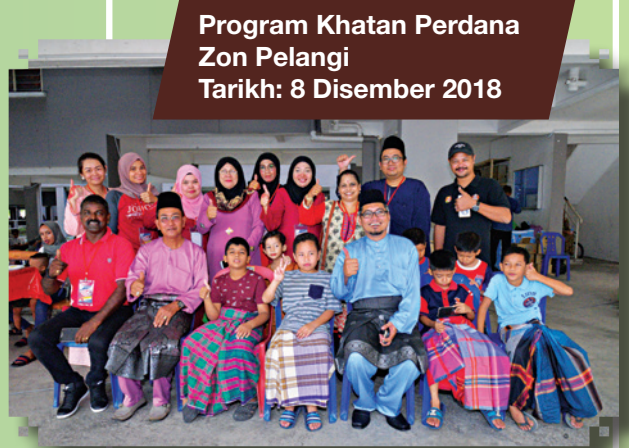
Program Khatan Perdana Zon Pelangi Tarikh: 8 Disember 2018