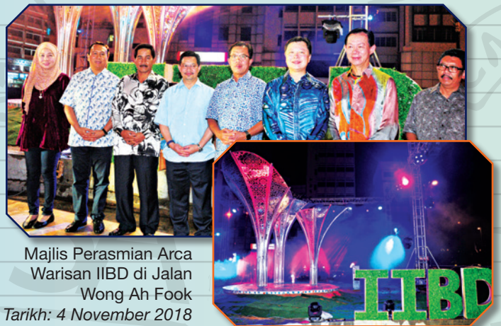
Majlis Perasmian Arca Warisan IIBD di Jalan Wong Ah Fook Tarikh: 4 November 2018