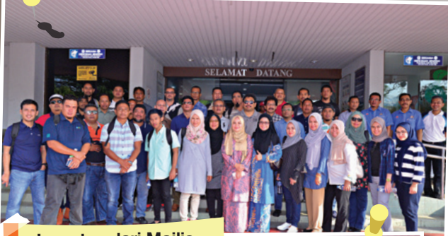
Lawatan dari Majlis Perbandaran Kuantan