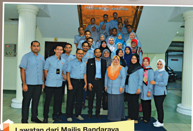
Lawatan dari Majlis Bandaraya Shah Alam