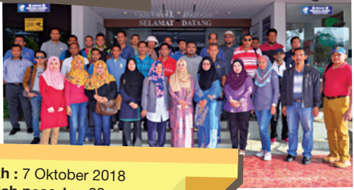
Tarikh : 7 Oktober 2018 Jumlah peserta : 80 orang