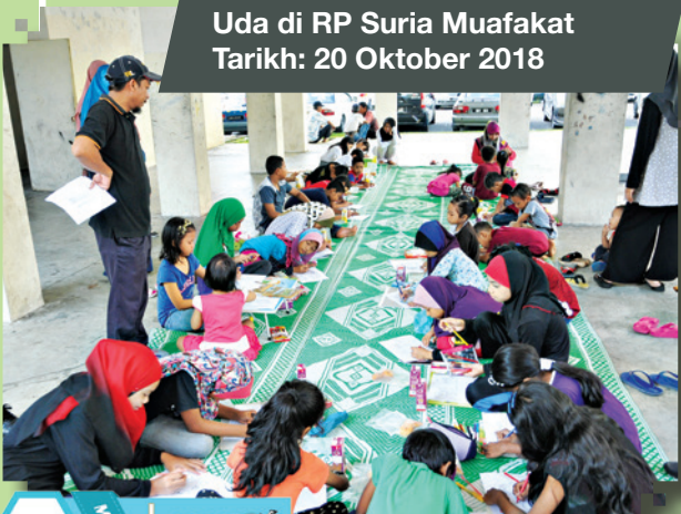
Ramah Mesra Zon Bandar Baru Uda di RP Suria Muafakat Tarikh: 20 Oktober 2018