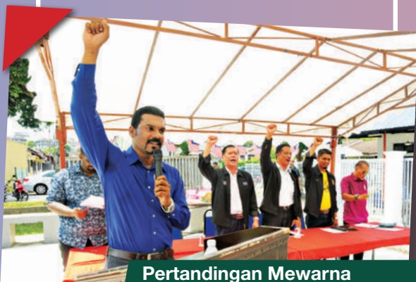
Pertandingan Mewarna Kemerdekaan Zon Permas Jaya, Teluk Jawa di Dataran Permas Jaya Tarikh: 25 Ogos 2018