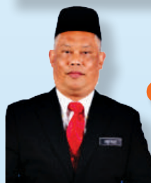
EN. ABD AZIZ BIN ABD TALIB