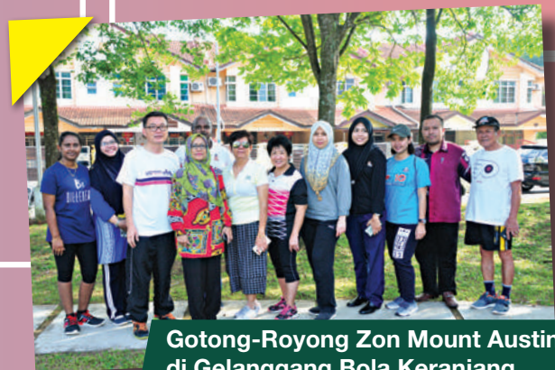
Gotong-Royong Zon Mount Austin di Gelanggang Bola Keranjang, Taman Austin Perdana Tarikh: 12 Ogos 2018