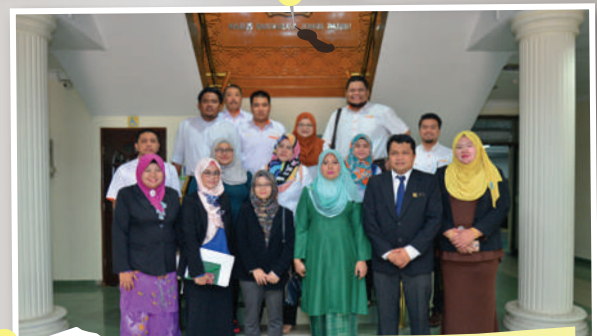
Lawatan dari Majlis Daerah Hulu Selangor

Objektif : Mempelajari hal pentadbiran Koperasi MBBJ dan pembangunan sektor pelancongan di MBBJ.