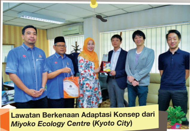
Lawatan Berkenaan Adaptasi Konsep dari Miyoko Ecology Centre (Kyoto City)