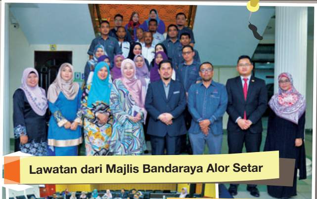
Lawatan dari Majlis Bandaraya Alor Setar

Objektif : Meningkatkan hubungan dua hala antara MBBJ dengan pihak Kyoto City , perkongsian dan sumbangan idea dari sudut ekologi di Perpustakaan Sultan Ismail dan merealisasikan hasrat MBBJ ke arah sebuah bandar raya bertaraf antarabangsa.