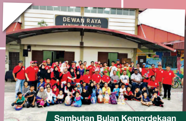
Sambutan Bulan Kemerdekaan Zon Bakar Batu di Balai Raya Kg. Bakar Batu Tarikh: 2 September 2018