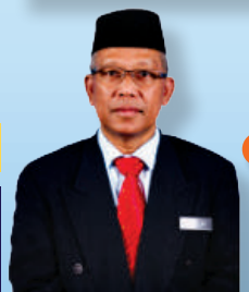
EN. ABDULLAH BIN IDERIS