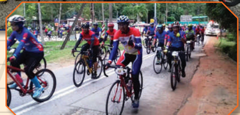
Kayuhan Jelajah Langkawi 2018 di Langkawi, Kedah Tarikh: 9 September 2018