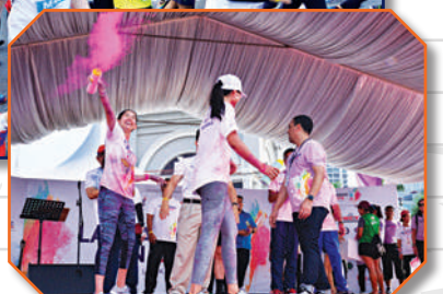
Larian amal Laksamana Run di Dataran Bandaraya Johor Bahru Tarikh: 28 Julai 2018