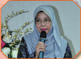
PUSPANITA MBJB merayakan anggota menunaikan fardu haji Tarikh: 11 Julai 2018