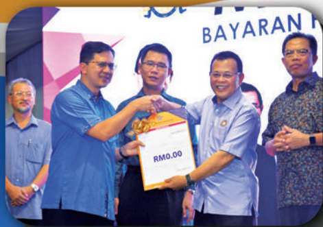
MAJLIS PELANCARAN PENGECUALIAN FI LESEN PENJAJA JOHOR