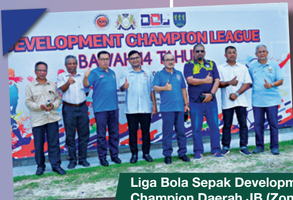
Liga Bola Sepak Development Champion Daerah JB (Zon Bakar Batu) di PPR Sri Stulang Tarikh: 11 Ogos 2018