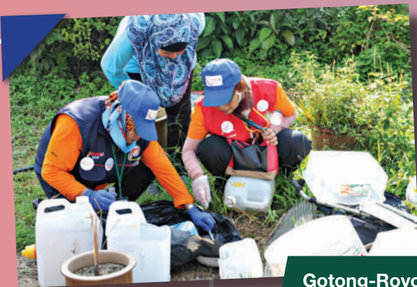
Gotong-Royong Zon Bakar Batu di Kg. Dato' Hajah Hasnah Tarikh: 9 September 2018