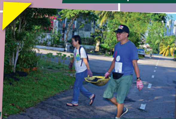
Gotong-Royong Zon Teluk Danga di Dewan Taman Tasek Tarikh: 23 September 2018