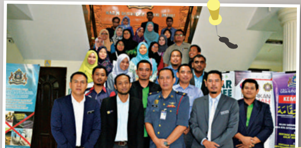
Lawatan dari Jabatan Perancangan Bandar & Desa, Melaka