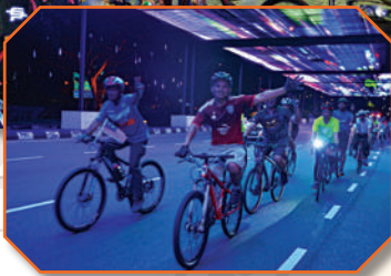
Program Jom Kayuh Merdeka di Dataran Bandaraya Johor Bahru Tarikh: 30 Ogos 2018