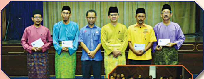
Program Bacaan Ratib/Asma ul Husna dan penyampaian sumbangan PPPJB kepada anggota yang akan menunaikan fardu haji Tarikh: 19 Julai 2018