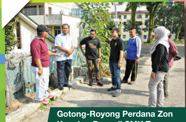
Gotong-Royong Perdana Zon Kangkar Daya di SMK Tun Fatimah Hashim, Taman Daya Tarikh: 11 Ogos 2018