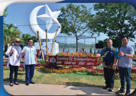
MBJB TERIMA ANUGERAH DI FLORIA DIRAJA PUTRAJAYA