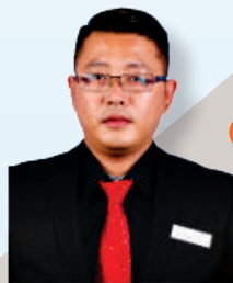
EN. FEBRIUS SIM KEEPOH