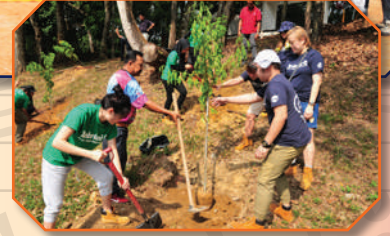
Program tanaman Pokok Timberland di Hutan Bandar Johor Bahru Tarikh: 15 Ogos 2018