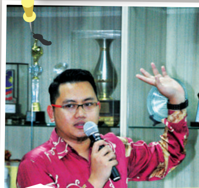
Lawatan dari Majlis Perbandaran Subang Jaya