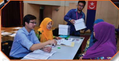
Pengundian tapak pasar sementara Taman Suria di bangunan JOTIC Tarikh: 29 Julai 2018