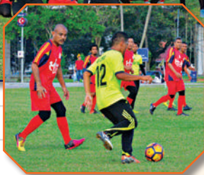
Bola Sepak Persahabatan MBBJ 2 vs MPKB 3 di Dataran Bandaraya Johor Bahru Tarikh: 29 September 2018