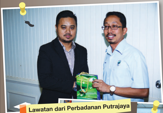
Lawatan dari Perbadanan Putrajaya

Objektif : Berkongsi maklumat mengenai pengurusan garis panduan perancangan dan pembangunan penyediaan perumahan warga asing.