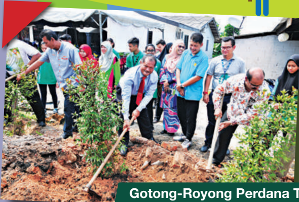
Gotong-Royong Perdana Toyota Eco Youth Zon Kangkar Indah di Kg. Bunga Ros, Kangkar Tebrau Tarikh: 29 Julai 2018