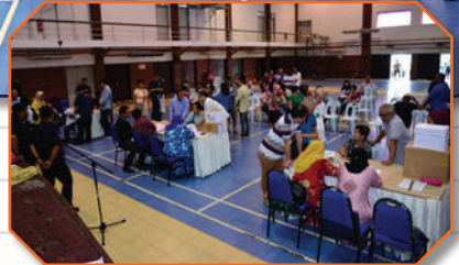
Pengundian gerai pasar Taman Sri Tebrau di Dewan Sri Tebrau Tarikh: 16 Julai 2018