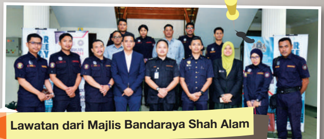
Lawatan dari Majlis Bandaraya Shah Alam

Objektif : Berkongsi ilmu pengetahuan serta pengalaman berkenaan tugas polis bantuan MBBJ.