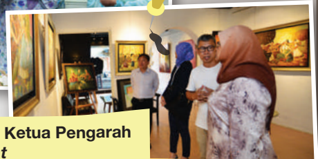
Lawatan Rasmi oleh Ketua Pengarah Eksekutif UN-Habitat