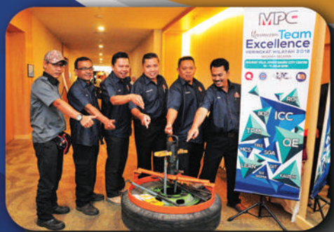
KONVENSYEN TEAM EXCELLENCE PERINGKAT WILAYAH 2018 (WILAYAH SELATAN)