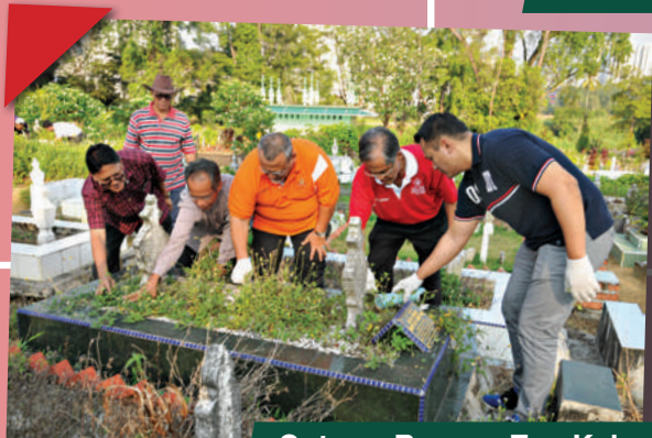
Gotong-Royong Zon Kebun Teh di Tanah Perkuburan Kebun Teh Tarikh: 14 September 2018