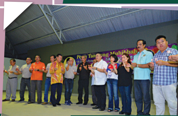
Pesta Tanglung Zon Permas di Dewan Permas Tarikh: 29 September 2018