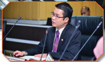
Mesyuarat PBT Johor bersama Exco Tarikh: 26 Julai 2018