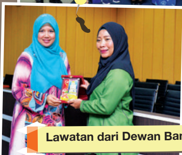
Lawatan dari Dewan Bandaraya Kota Kinabalu