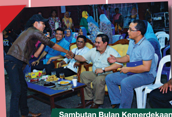
Sambutan Bulan Kemerdekaan & Hari Malaysia Zon Bandar Dato' Onn di Blok 14 & 15 Taman Desa Mutiara Tarikh: 23 September 2018