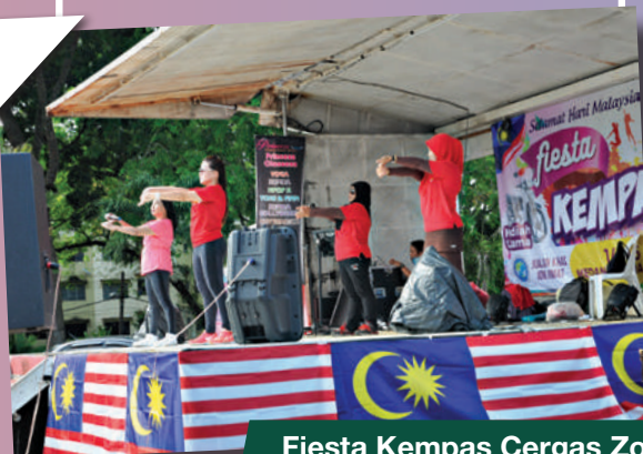
Fiesta Kempas Cergas Zon Kempas di Medan Selera Taman Cempaka Tarikh: 16 September 2018