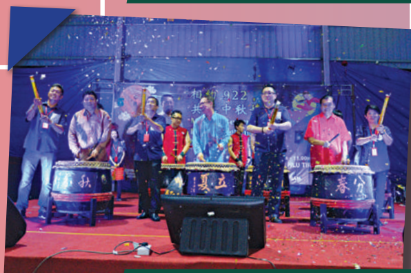
Pesta Tanglung Zon Tiram di Dataran Muafakat Tiram Tarikh: 22 September 2018