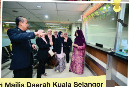
Lawatan dari Majlis Daerah Kuala Selangor