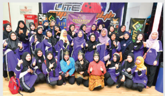
Pertandingan Boling Puspanita MBBJ di Leisure Mall Johor Bahru Tarikh: 27 Februari 2020