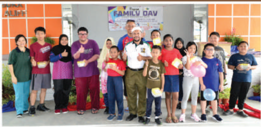
Hari Keluarga Zon Tampoi di Dewan Serbaguna Taman Damansara Aliff Tarikh: 11 Januari 2020