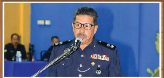
Program Dialog PDRM & Ahli Majlis Zon Desa Cemerlang di Dewan Desa Cemerlang Tarikh: 18 Februari 2020