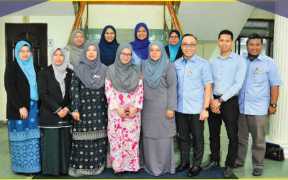
Lawatan daripada Setiausaha Kerajaan Negeri Selangor

Tarikh: 14 Januari 2020 Jumlah peserta: 15 orang