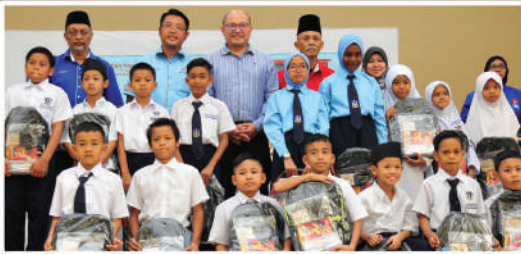
Program 'Back To School' Zon Bandar di Dewan Tarom Tarikh: 18 Januari 2020