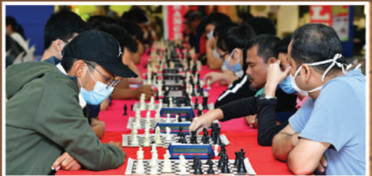
Pertandingan Catur Zon Taman Pelangi-Taman Sentosa di Plaza Pelangi Tarikh: 15 Februari 2020