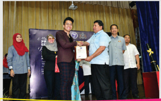
Projek Pendidikan dan Kemahiran YBJB di Dewan Jubli Intan Tarikh: 4 Mac 2020