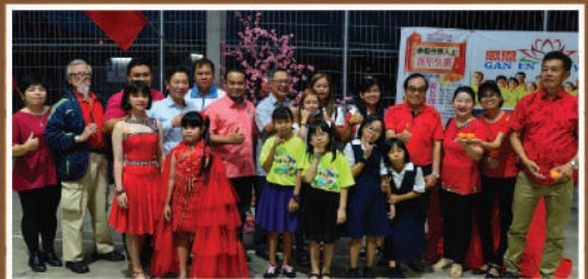
Sambutan Tahun Baharu Cina Zon Tiram di Dewan Kg. Baru Tiram Tarikh: 6 Februari 2020