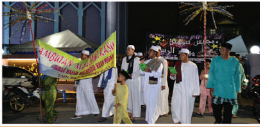
Maulidur Rasul Zon Kempas di Surau Hajjah Hazarabie Khan, Taman Bukit Kempas Tarikh: 10 Januari 2020