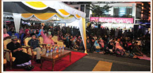
Maulidur Rasul Zon Bakar Batu di Surau Al-Falah Sri Stulang Tarikh: 5 Januari 2020