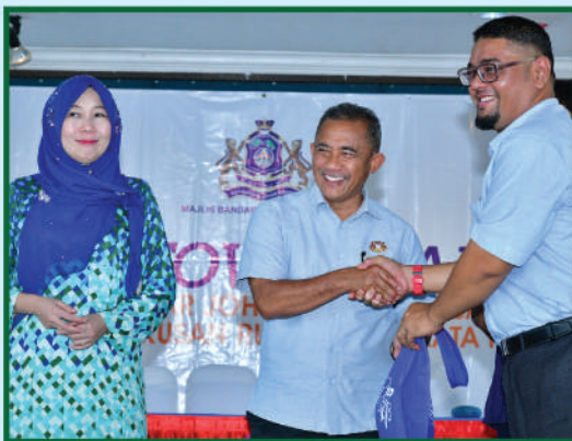
Sesi 'Town Hall' Datuk Bandar Johor Bahru Bersama Perbadanan Pengurusan Rumah Pangsa Larkin Perdana 23 Februari 2020