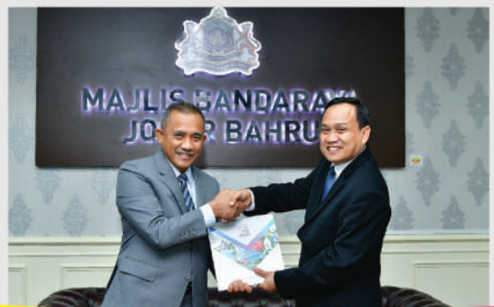
Kunjungan Hormat Konsulat Indonesia ke Pejabat Datuk Bandar Tarikh: 29 Januari 2020