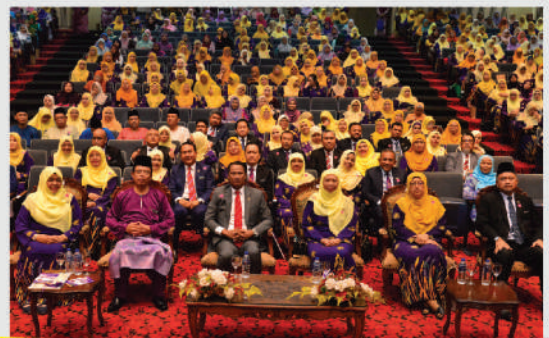
Mesyuarat Agung Puspanita Negeri Johor di Pusat Islam Iskandar Tarikh: 27 Februari 2020