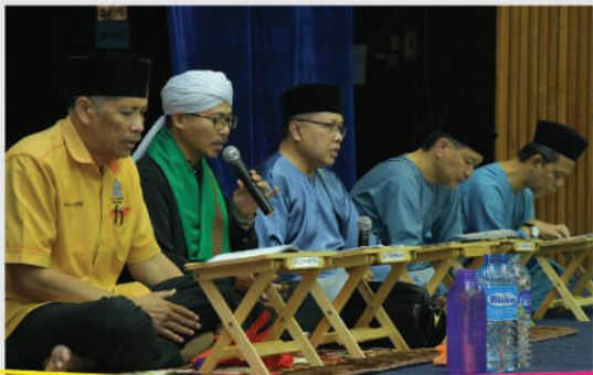
Program Bacaan 'Ratib Al-Attas' dan 'Asmaul Husna' Tarikh: 16 Januari 2020