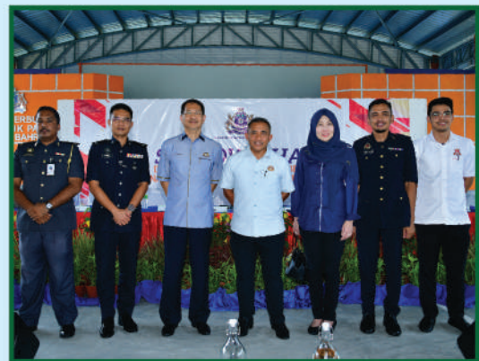
Sesi 'Town Hall' Datuk Bandar Johor Bahru Bersama Perbadanan Pengurusan Rumah Pangsa Laman Tasik Pandan 8 Mac 2020