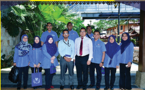
Lawatan ke Majlis Bandaraya Iskandar Puteri

Jabatan terlibat: Unit Aduan Awam, Bahagian Korporat dan Perhubungan Awam