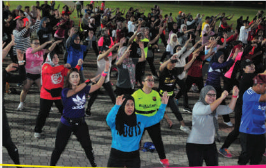
Program 'Free Workout Johor' di Dataran Bandaraya Johor Bahru Tarikh: 10 Januari 2020