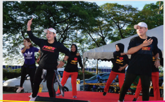
Program 'JB Wake Up! Car Free Day' Tarikh: 4 Januari 2020