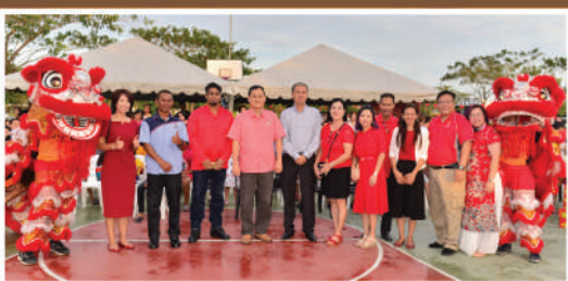
Sambutan Tahun Baharu Cina Zon Setia Austin di Jalan Jaya Putra (La Garden) Tarikh: 8 Februari 2020