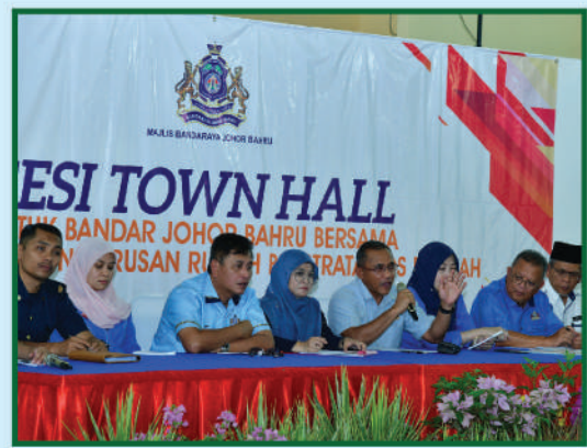
Sesi 'Town Hall' Datuk Bandar Johor Bahru Bersama Perbadanan Pengurusan Rumah Pangsa Cempaka, Taman Cempaka 9 Februari 2020