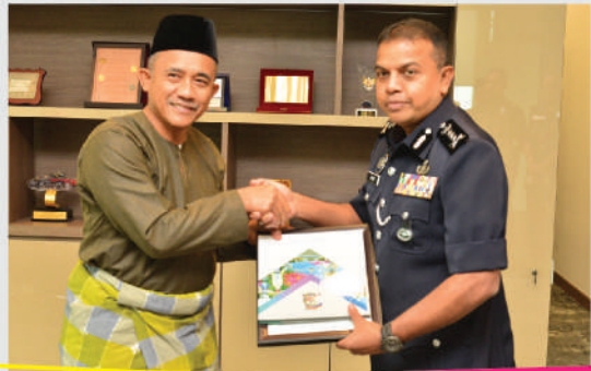
Kunjungan Hormat Ketua Polis Johor ke Pejabat Datuk Bandar Tarikh: 12 Mac 2020