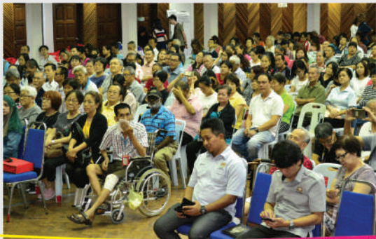
Penyampaian Bantuan Tahun Baharu Cina Yayasan Bandaraya di Dewan Jubli Intan Tarikh: 15 Januari 2020