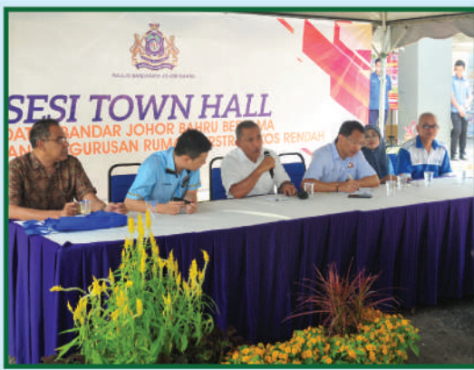
Sesi 'Town Hall' Datuk Bandar Johor Bahru Bersama Perbadanan Pengurusan Rumah Pangsa Orkid, Taman Desa Cemerlang 12 Januari 2020

Majlis Bandaraya Johor Bahru (MBJB) telah menganjurkan beberapa siri 'town hall' Datuk Bandar Johor Bahru bersama Perbadanan Pengurusan Rumah Pangsa Kos Rendah di beberapa lokasi mengikut zon pentadbiran Ahli Majlis MBJB. Sesi 'town hall' ini diadakan bertujuan mewujudkan penghuni perumahan yang lestari selain mendalami isu-isu semasa yang dihadapi, meningkatkan taraf hidup masyarakat sejagat, menerangkan peranan dan tanggungjawab MBJB serta pemilik dan sebagai program ramah mesra pihak MBJB bersama penduduk.