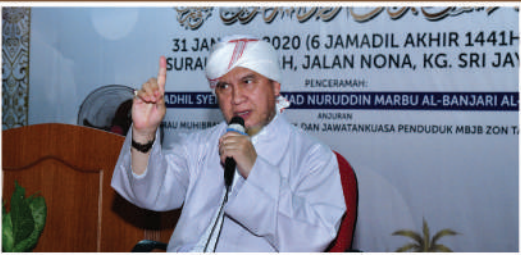
Maulidur Rasul Zon Tampoi di Surau Jalan Nona, Kg. Pasir Tarikh: 31 Januari 2020