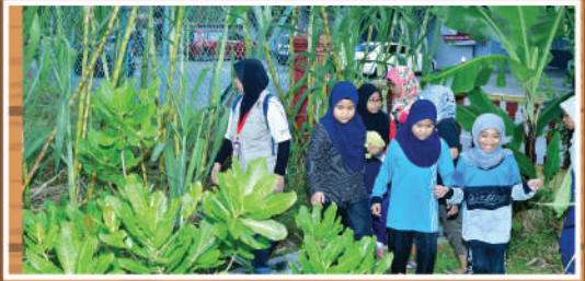
Program 'Search and Destroy' Zon Kg. Melayu di SK Md Khir Johari Tarikh: 22 Februari 2020