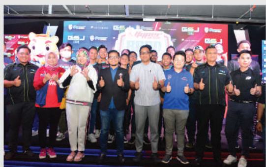
Majlis Perjanjian Persefahaman e-Sport Johor di Toppen Mall Johor Bahru Tarikh: 8 Februari 2020