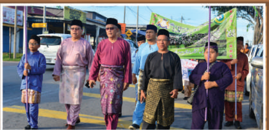
Maulidur Rasul Zon Kg. Melayu di SK Dato Abdullah Esa Tarikh: 15 Februari 2020