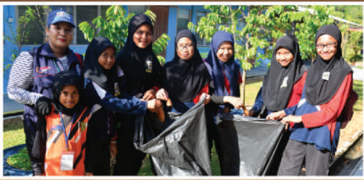
Program 'Search and Destroy' Zon Permas Jaya di SK Permas Jaya 1 Tarikh: 29 Februari 2020