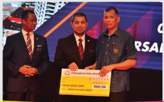
Program Penyampaian Amanat Menteri Besar di Persada Johor Tarikh: 2 Februari 2020