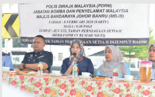
Sesi Dialog Bersama Penduduk Taman Perniagaan Setia 2 Tarikh: 8 Februari 2020