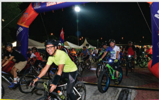
'Dataran Recreational Day' di Dataran Bandaraya Johor Bahru Tarikh: 17 Januari 2020