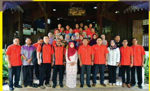
Lawatan dari Majlis Daerah Tanjong Malim ke Hutan Bandar, Youth Hub

Objektif : Mempelajari ilmu tentang proses dan kaedah perolehan secara sebut harga yang dipraktikkan di Majlis Bandaraya Iskandar Puteri bagi melancarkan proses kerja.