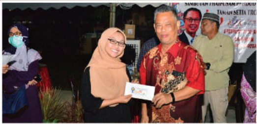
Sambutan Chap Goh Mei Zon Setia Tropika di Caryota Square Tarikh: 8 Februari 2020