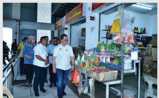
Lawatan Tapak ke Medan Niaga Pasar Kg. Melayu oleh Ketua Setiausaha, Kementerian Perumahan dan Kerajaan Tempatan Tarikh: 22 Februari 2020