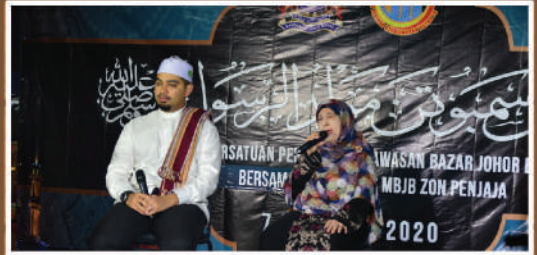
Sambutan Maulidur Rasul Zon Penjaja di Bazar Karat Tarikh: 7 Februari 2020