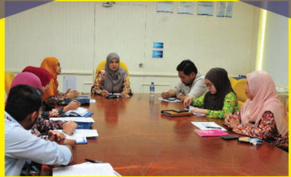
Lawatan dari Majlis Bandaraya Iskandar Puteri

Jabatan terlibat: Unit Aduan Awam, Bahagian Korporat dan Perhubungan Awam