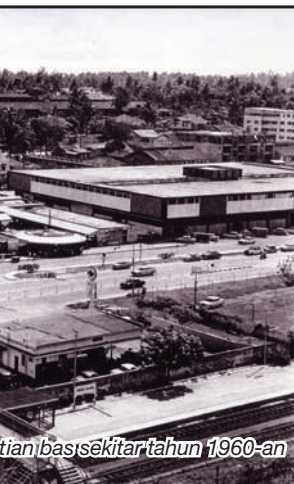
Stesen bas sekitar tahun 1960-an