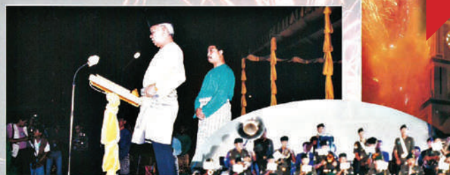
Detik bersejarah yang disaksikan, Johor Bahru diisytiharkan bandarnya tepat jam 12.01 pagi.