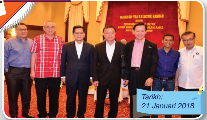
Tarikh: 21 Januari 2018

Sesi ceramah perdana bersama personaliti televisyen yang popular dengan program dakwah dan keagamaan. Ustaz Don Daniyal Biyajid berkesempatan memperihalkan bicara mengenai rezeki dan keberkatan rezeki dalam melakukan pekerjaan harian sebagai motivasi kepada anggota MBJB.