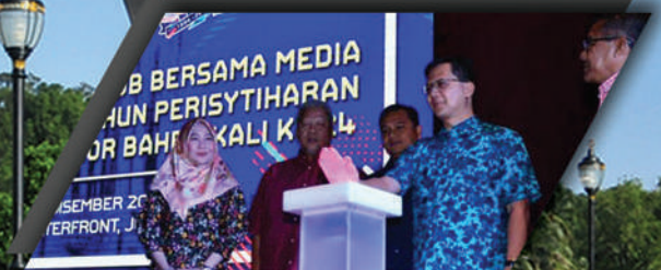
PELANCARAN LOGO TEAM MJB

MBJB 24 "Mencetus Kegemilangan" 1994 - 2018