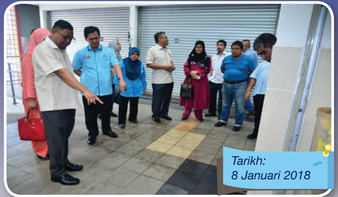
Tarikh: 8 Januari 2018