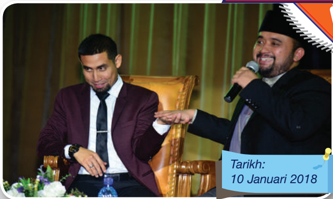
Tarikh: 10 Januari 2018