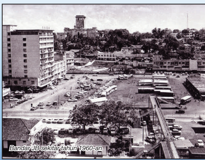
Bandar JB sekitar tahun 1960-an