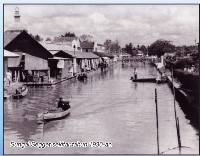
Sungai Segget sekitar tahun 1930-an