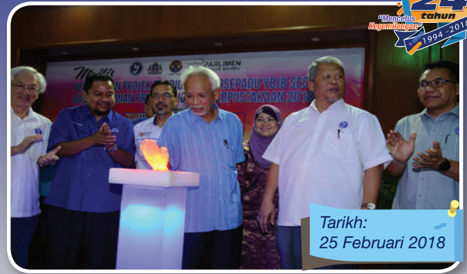
Tarikh: 25 Februari 2018

Program bertemakan 'Etnik' ini merupakan cetusan idea daripada Datuk Bandar Johor Bahru dan bertujuan mewujudkan komunikasi dua hala antara Datuk Bandar Johor Bahru dengan pegawai dalam kumpulan pengurusan dan profesional MBJB seramai 72 orang yang terdiri daripada pelbagai gred. Majlis ini juga merupakan salah satu wadah untuk menyatukan dan meningkatkan kerjasama serta muhibah antara pegawai-pegawai MBJB.