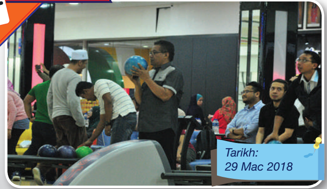
Tarikh: 29 Mac 2018

Program yang diadakan sebagai penghargaan dan meraikan Ahli-Ahli Majlis MBJB yang telah berkhidmat di 24 zon atau kawasan di bawah pentadbiran MBJB. Penganjuran program ramah mesra ini mengeratkan lagi silaturahmi antara pengurusan tertinggi MBJB bersama barisan Ahli Majlis serta tetamu jemputan yang hadir.