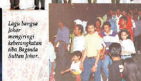
Lagu bangsa Johor mengiringi keberangkatan raja Baginda Sultan Johor.