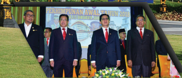
PERHIMPUNAN AWAL TAHUN 2018