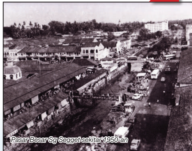
Pasar Besar Sg Segget sekitar 1950-an