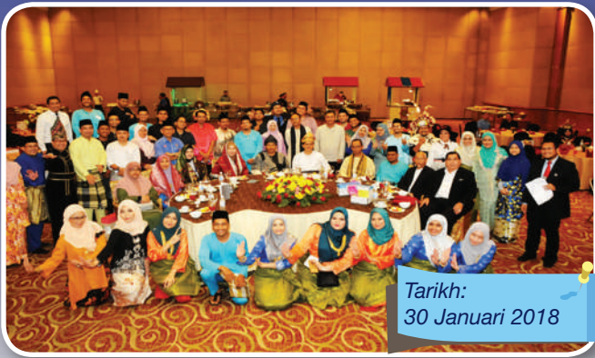
Tarikh: 30 Januari 2018