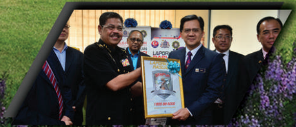
PROGRAM GEMPUR BERSAMA SPRM