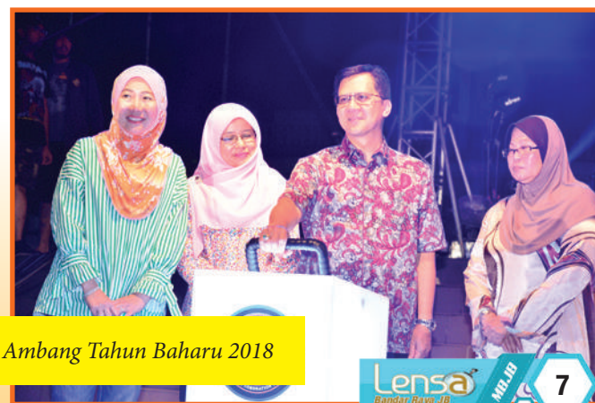
Malam Akhir Festivities@IIBD - Ambang Tahun Baharu 2018