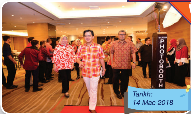
Tarikh: 14 Mac 2018