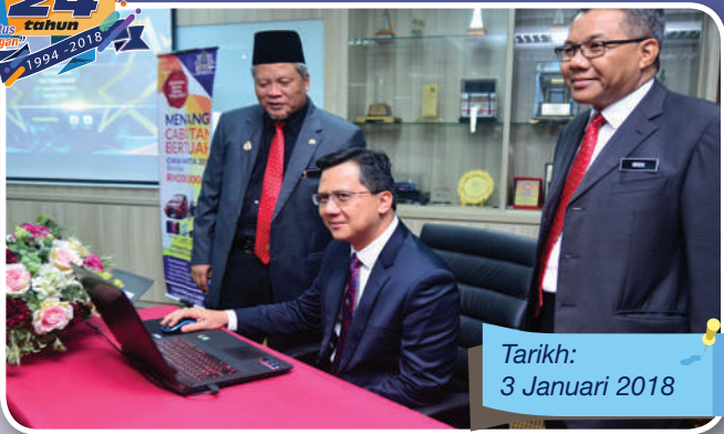
Tarikh: 3 Januari 2018