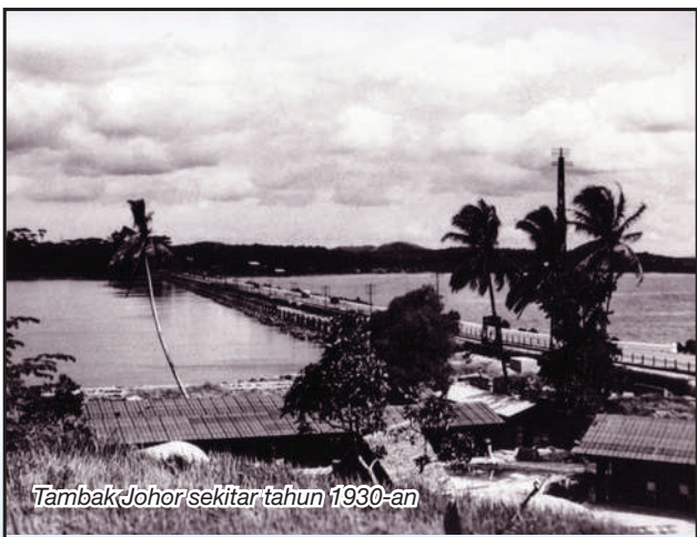
Tambak Johor sekitar tahun 1930-an