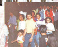
Antara ribuan wargakota yang tidak menyahsikan peristiwa gilang gemilang.