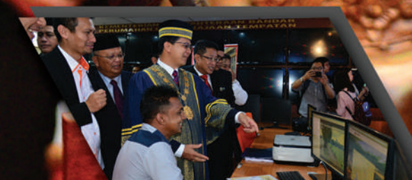
PELANCARAN SISTEM iTRAFIK MBBB