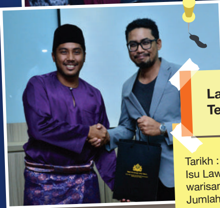
Lawatan dari Universiti Teknologi Mara (UiTM)

Tarikh: 11 Oktober 2017 Isu Lawatan: Deposit yang dikeluarkan terhadap premis-premis di bawah peruntukan undang-undang kecil (UUK) MJB. Jumlah Peserta: 20 orang Jabatan Terlibat: Bahagian Undang-Undang dan Jabatan Pelesenan