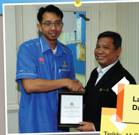
Lawatan dari Majlis Daerah Tanjung Malim

Tarikh: 11 Oktober 2017 Isu Lawatan: Deposit yang dikeluarkan terhadap premis-premis di bawah peruntukan undang-undang kecil (UUK) MJB. Jumlah Peserta: 20 orang Jabatan Terlibat: Bahagian Undang-Undang dan Jabatan Pelesenan