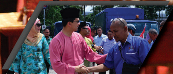
MISI PASCA BANJIR MBBB KE PULAU PINANG