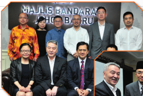
Lawatan daripada Delegasi Shanghai China Tarikh: 29 November 2017