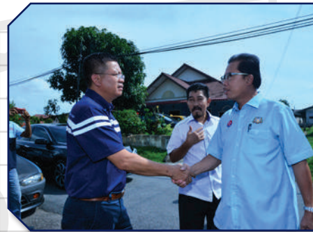
Lawatan Datuk Bandar ke Persisiran Sg. Sebulong Tarikh: 9 Oktober 2017