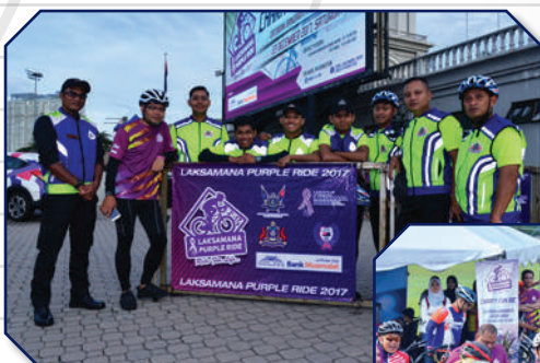
Program Kayuhan Santai 'Laksamana Purple Ride' di Dataran Bandaraya Tarikh: 23 Disember 2017