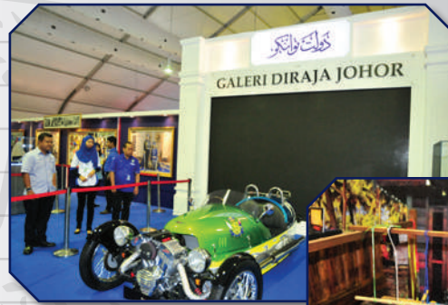
Karnival Johor Berkemajuan di Kota Iskandar Tarikh: 9 Oktober 2017