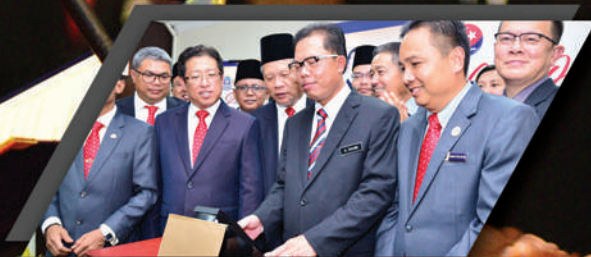
'CLOCK OUT' DATUK BANDAR KE-10