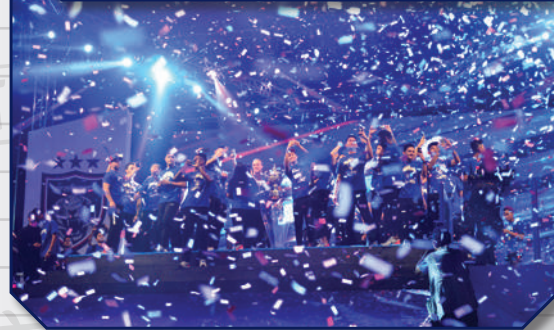
Majlis Meraikan Kemenangan Johor Darul Ta'zim (JDT) Menjuarai Piala Malaysia di Dataran Bandaraya Tarikh: 5 November 2017