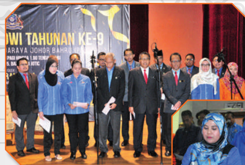
Mesyuarat Agung PPBJB di Auditorium JOTIC Tarikh: 12 Disember 2017