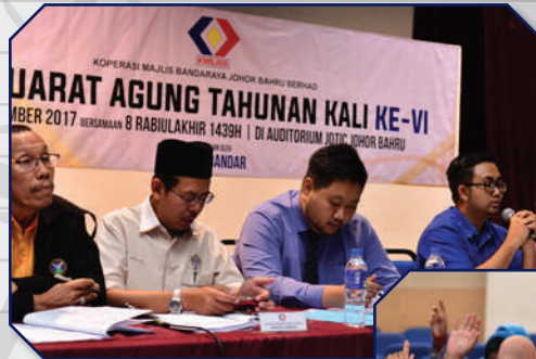
Mesyuarat Agung Koperasi Majlis Bandaraya Johor Bahru (MBJB) di Auditorium JOTIC Tarikh: 27 Disember 2017