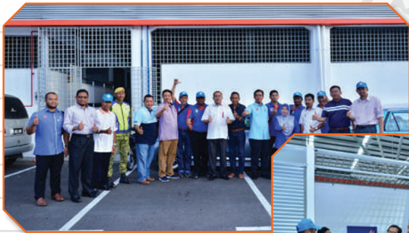
Pelancaran Transformasi Peniaga Pasar Malam Kg. Melayu Tarikh: 9 Oktober 2017