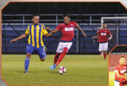
Pertandingan Bola Sepak Piala PBT Johor: Majlis Bandaraya Johor Bahru (MBJB) lawan Majlis Perbandaran Pasir Gudang (MPPG) di Stadium Pasir Gudang Tarikh: 26 November 2017