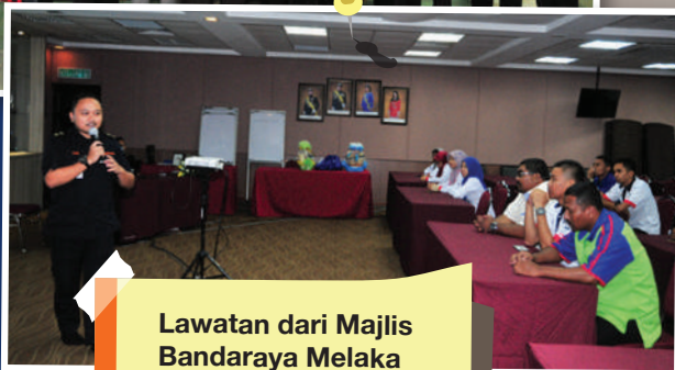
Lawatan dari Majlis Bandaraya Melaka Bersejarah

Tarikh: 1 November 2017 Isu Lawatan: Penguatkuasaan kenderaan terbiar dan halangan. Jumlah Peserta: 20 orang Jabatan Terlibat: Jabatan Penguatkuasaan