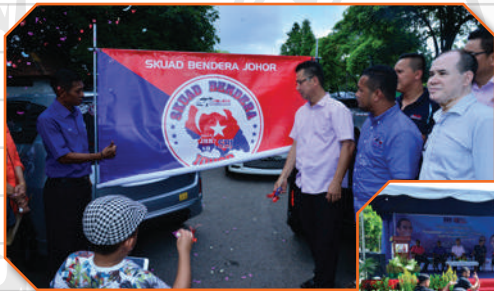
Sukan Muafakat dan Future Home Zon Taman Molek di Laman Tasik Pandan Tarikh: 28 Oktober 2017