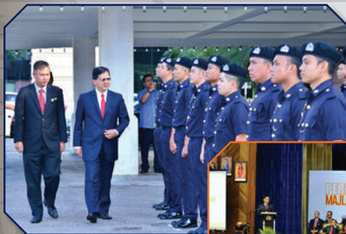
Pertemuan Bulanan di Dewan Jubli Intan Tarikh: 5 Disember 2017