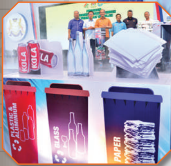
Pelancaran Eko Inisiatif PBT di Kota Iskandar Tarikh: 12 Oktober 2017