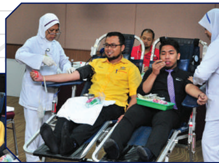
Program Derma Darah dengan kerjasama pihak Hospital Sultanah Aminah (HSA) Johor Bahru Tarikh: 27 November 2017