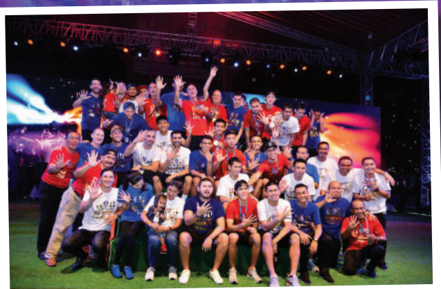
9. Majlis Meraikan Kemenangan JDJ, Juara Bertahan Piala Liga Super Kali Ke-4 Tarikh: 20 September 2017