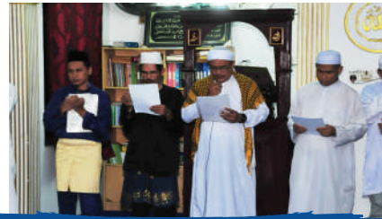
Sambutan Hari Raya Zon Larkin di RP Larkin Tarikh: 14 Julai 2017