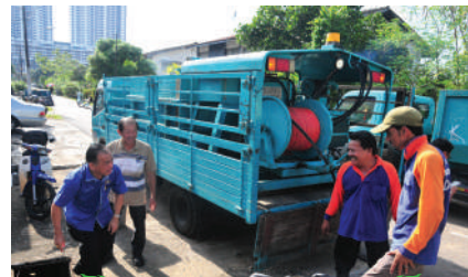
Program Gotong-Royong di Jalan Marwan Majidi Park Tarikh: 22 Julai 2017