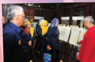
Lawatan Panel KPKT Bagi Anugerah Tandas Bersih 19 hingga 20 September 2017