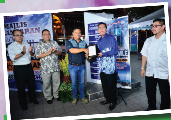
5. 'Flag Off' Rombongan Kelab Media Johor ke Krabi di KM 0 Tarikh: 30 Julai 2017