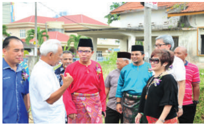
Majlis Sambutan Hari Raya dan Perasmian Komuniti Berkawal di Zon Kebun Teh Tarikh: 29 Julai 2017