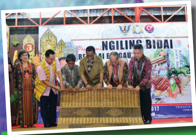
1. Majlis Penutup Pesta Gawai di Pasar Borneo Tarikh: 8 Julai 2017