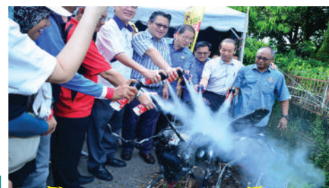
Program 'Search & Destroy' (SND) Zon Tampoi di Jalan Dato Esa Tarikh: 13 Ogos 2017