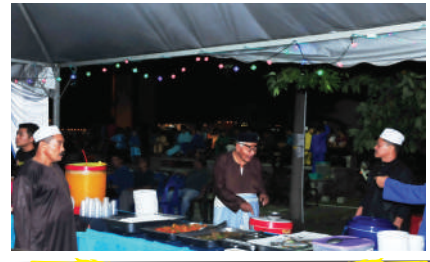
Sambutan Hari Raya Zon Tampoi di Jalan Nona Tarikh: 15 Julai 2017