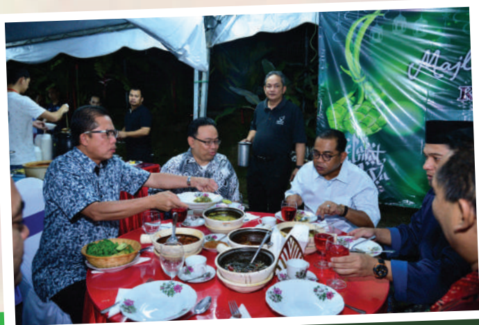
3. Majlis Muafakat Aidilfitri di Rumah Kelab Media Johor Tarikh: 22 Julai 2017