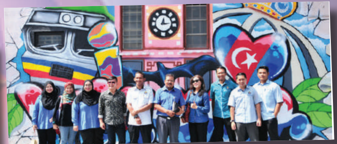
Lawatan dari Majlis Perbandaran Langkawi – 14 September 2017