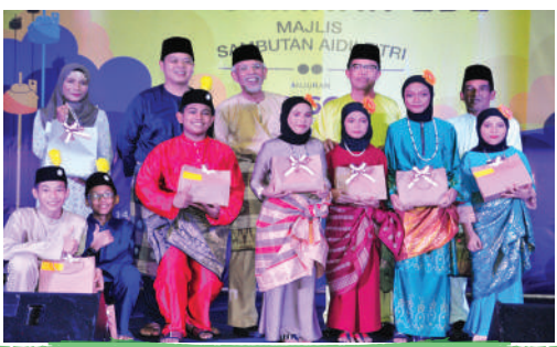
Sambutan Hari Raya Zon Bakar Batu di Perumahan EDL Tarikh: 14 Julai 2017