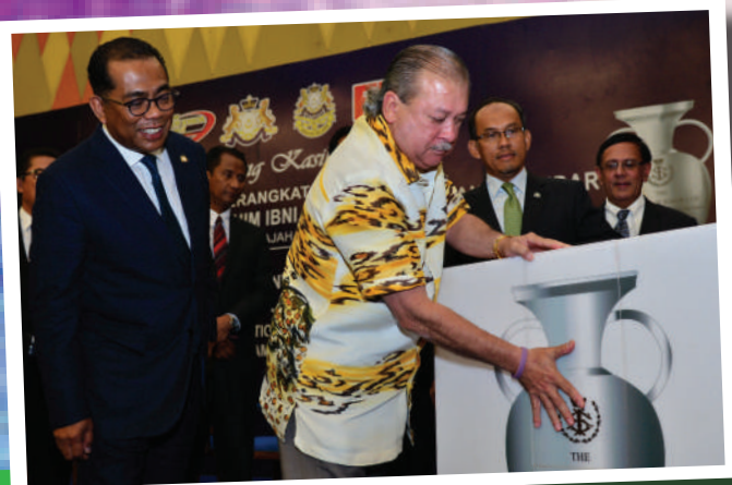
10. Majlis Pelancaran Kejohanan Hoki Piala Sultan Johor di Persada Johor Tarikh: 25 September 2017