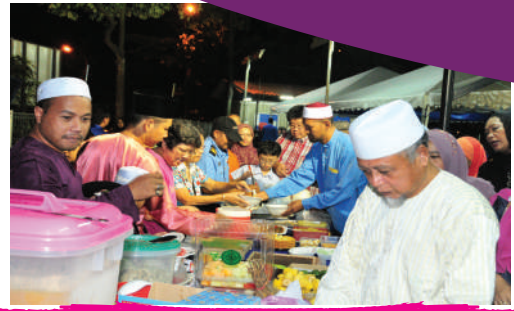
Majlis Sambutan Hari Raya Seri Austin 1C Tarikh: 7 Julai 2017