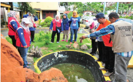
Program Gotong-Royong Sekolah Zon Taman Pelangi di SK Sri Tebrau Tarikh: 12 Ogos 2017