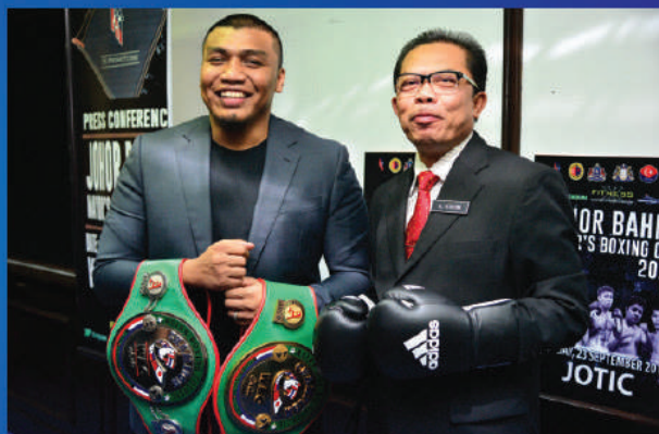
➤ KEJOHANAN TINJU PIALA DATUK BANDAR