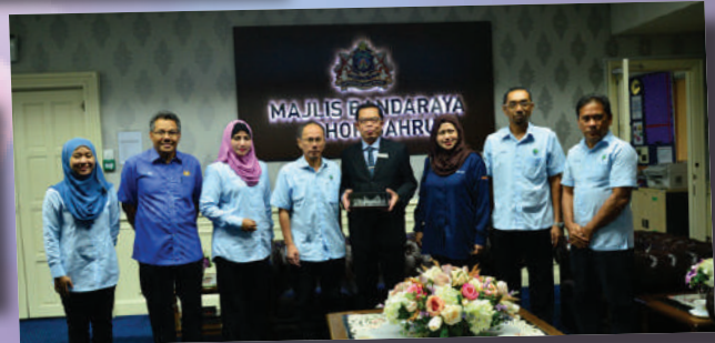
Lawatan Inspektorat Audit Keselamatan – 20 Ogos 2017