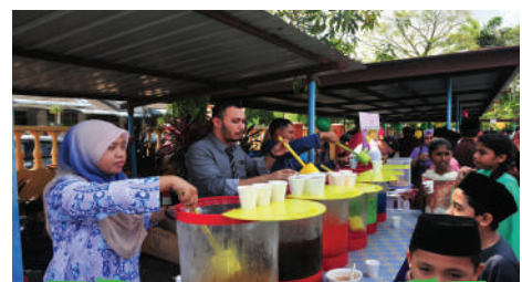
Sambutan Hari Raya Zon Taman Rinting di SK Taman Rinting 2 Tarikh: 30 Julai 2017