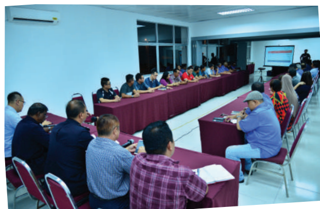
11. Majlis Dialog Polis Bersama Komuniti Taman Setia Indah di Dewan Nibong Tarikh: 25 September 2017