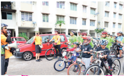
Program Eko Famili SND Zon Taman Molek di RP Laman Tasik Pandan Tarikh: 15 Julai 2017