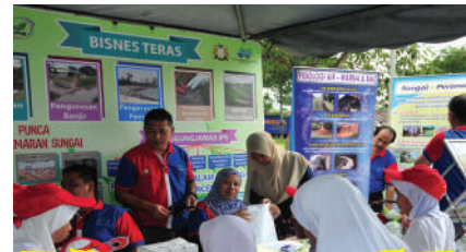
Program 'River Care' Zon Taman Molek di Laman Tasik Pandan Tarikh: 30 Julai 2017