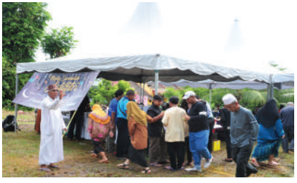
Sambutan Hari Raya Zon Kempas di Persiaran Selasih Tarikh: 15 Julai 2017