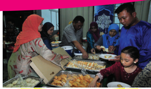
Majlis Sambutan Hari Raya Zon Setia Indah Tarikh: 14 Julai 2017