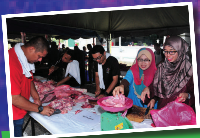
8. Program Qurban dan Aqiqah Peringkat MBBJ Tarikh: 4 September 2017