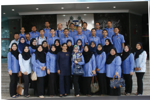
Lawatan ke Majlis Bandaraya Ipoh (MBI) – 4 Ogos 2017