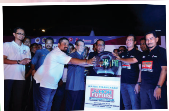
6. Majlis Pelancaran 'Johor Future' di Bazar JB Tarikh: 5 Ogos 2017