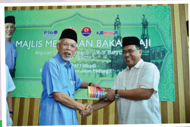
4. Majlis Meraikan Bakal Haji Parlimen Johor Bahru di Dewan Stulang Baru Tarikh: 30 Julai 2017