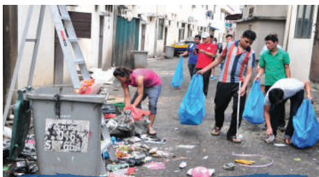
Program Gotong-Royong Denggi di Zon Desa Cemerlang Tarikh: 13 Ogos 2017