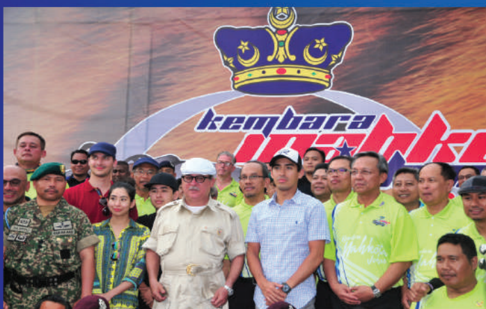
➤ KEMBARA MAHKOTA JOHOR