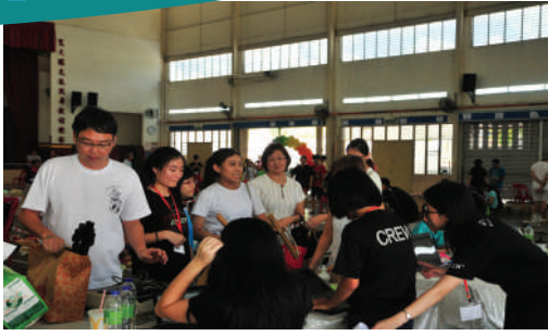
Program 'Give and Take' di Zon Mount Austin Tarikh: 1 Julai 2017