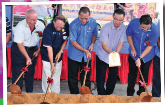
7. Majlis Pecah Tanah Pusat Latihan Wushu di Taman Johor Jaya Tarikh: 25 Ogos 2017