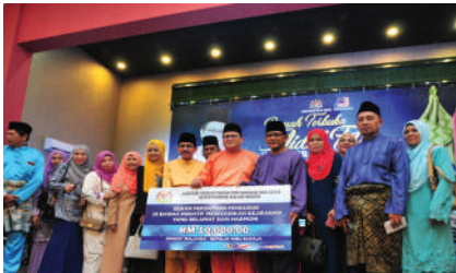
Rumah Terbuka Parlimen Pulai di Dewan Tan Sri Mohamad Rahmat Tarikh: 16 Julai 2017