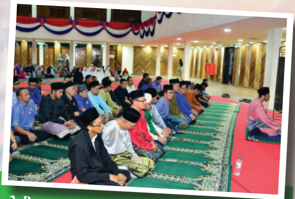
2. Program Solat Hajat dan Asmaul Husna Tarikh: 20 Julai 2017