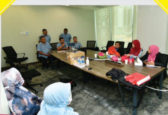
Sesi Soal Jawab Sempena 'Annual Productivity and Innovation Conference & Exposition (APIC) 2020' Tarikh: 18 November 2020