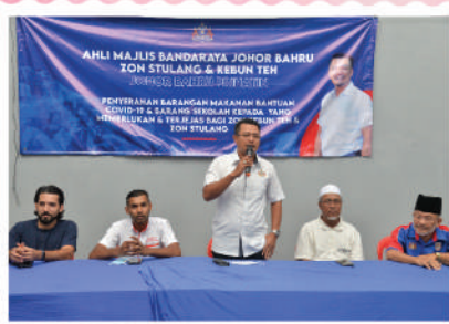
Sumbangan Bakul Makanan di Dewan Kg. Kurnia - Zon Kebun Teh dan Stulang 30 Disember 2020