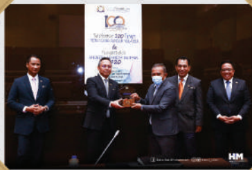
'LEADERSHIP IN SUSTAINABILITY AWARDS 2020' IKTIRAF MENARA MBBB