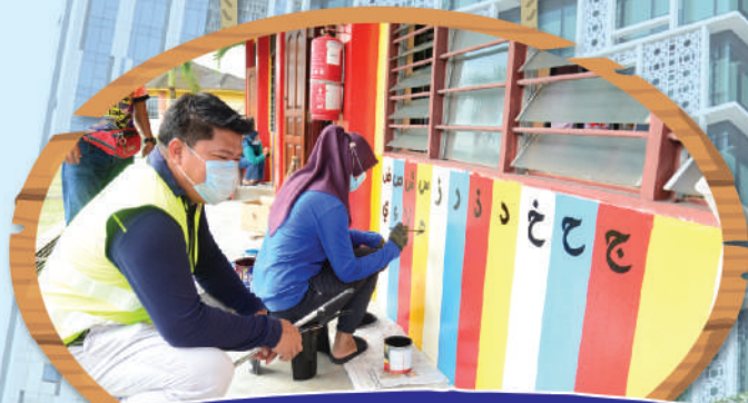
Program 'Search and Destroy' (SND) di Sekolah Kebangsaan Felda Ulu Tebrau - Zon Tiram Tarikh: 10 Oktober 2020