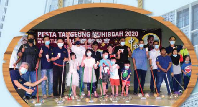
Pesta Tanglung Muhibbah di Jalan Permas 12 - Zon Permas Jaya Tarikh: 3 Oktober 2020