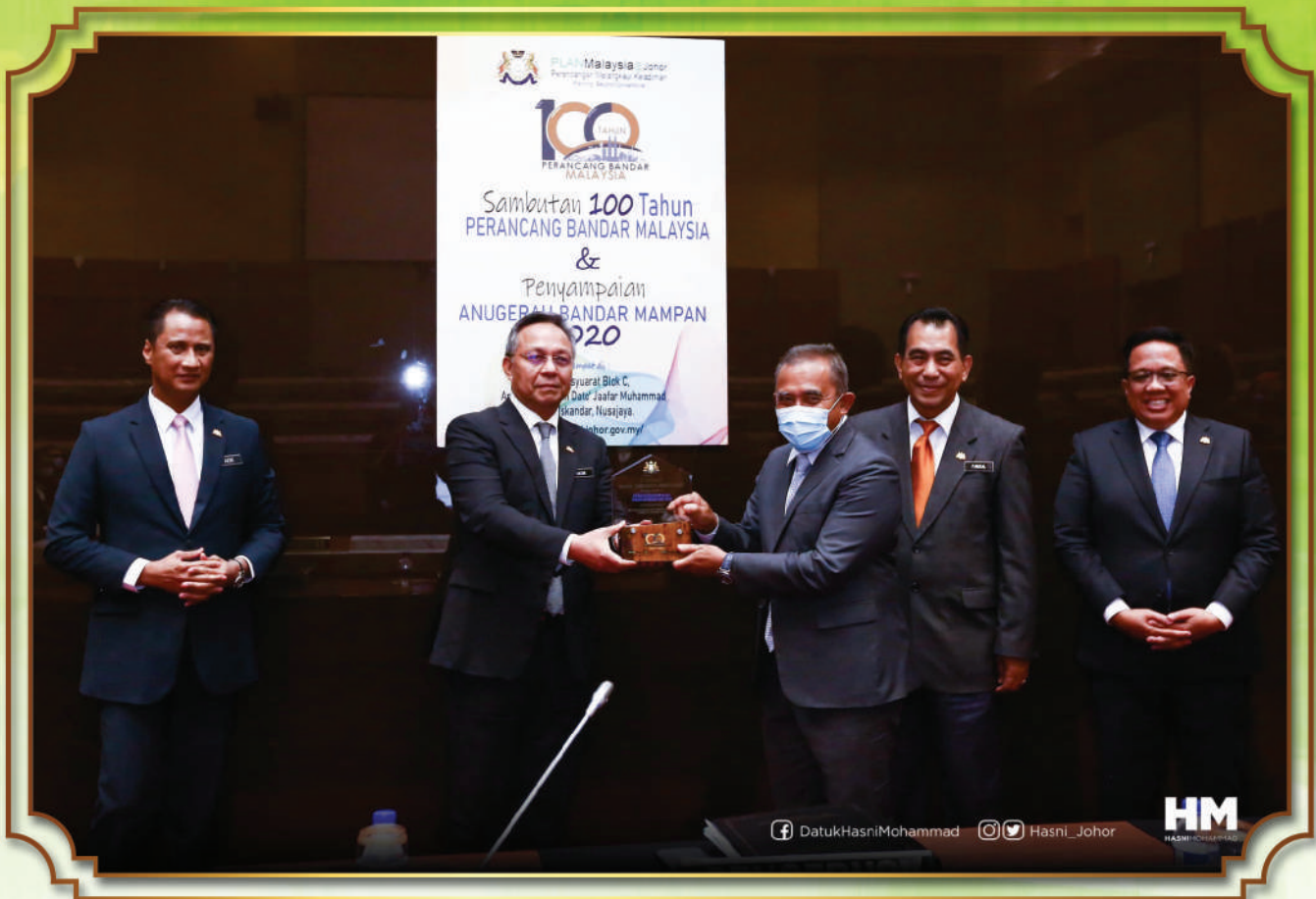
'Ihsan Foto: Facebook Menteri Besar Johor'

Melalui penghargaan ini, MBBJ akan terus komited dalam usaha mengekalkan momentum kemampunan bandar raya Johor Bahru bagi menyediakan kehidupan yang kondusif dan berkualiti kepada warga bandar raya dan juga menjadikan Johor Bahru sebagai sebuah bandar raya bertaraf antarabangsa, berbudaya dan lestari.