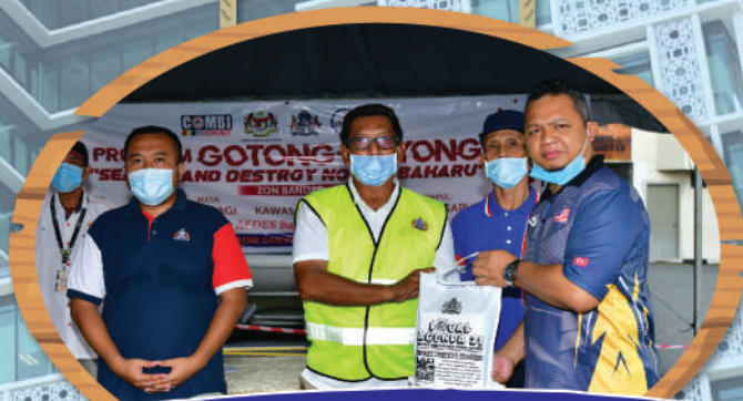
Program 'Search and Destroy' (SND) di Pangsapuri Saujana - Zon Bandar Tarikh: 17 Oktober 2020