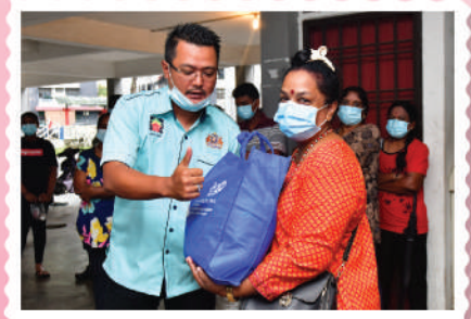
Sumbangan Bakul Makanan & Peralatan Sekolah di Rumah Pangsa Stulang Laut - Zon Stulang dan Kebun Teh 31 Disember 2020