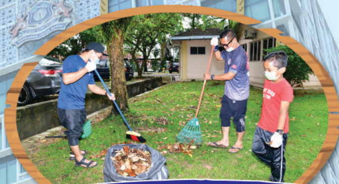
Program 'Search and Destroy' (SND) di Rumah Pangsa Seri Murni, Tampoi - Zon Teluk Danga Tarikh: 10 Oktober 2020