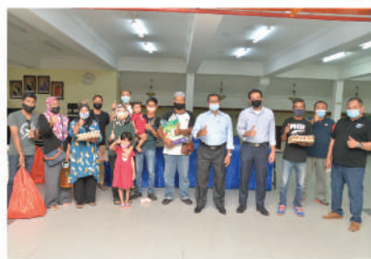
Sumbangan Bakul Makanan Peniaga di Dataran Bandaraya - Zon Bandar 28 Disember 2020