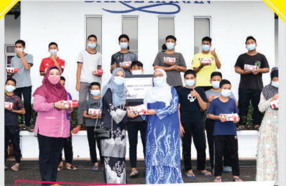
Penyerahan Sumbangan PUSPANITA kepada Asnaf di Darul Hanan, Pasir Gudang Tarikh: 28 Oktober 2020