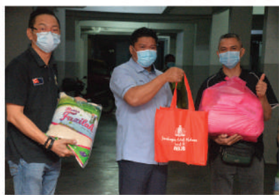
Sumbangan Bakul Makanan di Rumah Pangsa Seri Orkid - Zon Desa Cemerlang 27 Disember 2020