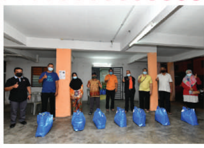
Sumbangan Bakul Makanan di Rumah Pangsa Larkin Perdana - Zon Larkin 29 Disember 2020