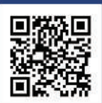
QR code (penerbitan rasmi mbbb)