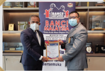
MBBB TERIMA PENGHARGAAN 100% LAKSANA 'e-CENCUS'