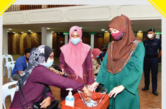
Pengundian Tapak Niaga Bazar JB di Dewan Jubli Intan Sultan Ibrahim Tarikh: 25 November 2020