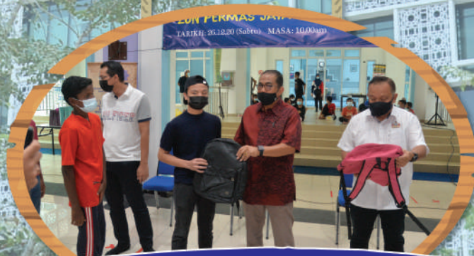
Program 'Back To School' di Masjid Permas Jaya - Zon Permas Jaya/ Teluk Jawa Tarikh: 26 Disember 2020