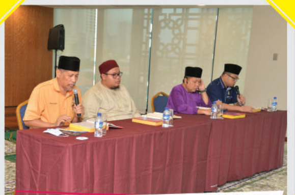
Program Pembudayaan Al-Quran dan Tazkirah di Surau Menara MBBJB Tarikh: 31 Disember 2020