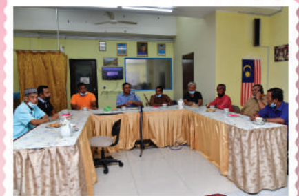
Sumbangan Bakul Makanan di Projek Perumahan Rakyat Desa Melayu - Zon Bakar Batu 28 Disember 2020