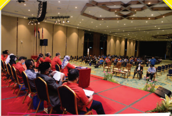
Mesyuarat Agung ANULAE di Dewan Kenanga, Menara MBBJB Tarikh: 11 Oktober 2020