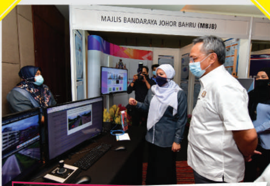
Program 'Iskandar Malaysia Urban Observatory Forum' di Hotel Double Tree Tarikh: 21 Disember 2020