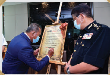
AKU JANJI WARGA MBBB PERANGI PEMBERI RASUAH