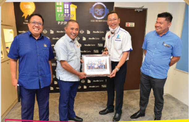
Lawatan daripada Pengerusi Jawatankuasa Perumahan dan Kerajaan Tempatan ke Pangsapuri Seri Orkid, Taman Desa Cemerlang Tarikh: 16 Ogos 2020