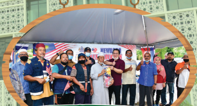
Kembara Merdeka Zon Bandar di Kg. Tarom Tarikh: 5 September 2020