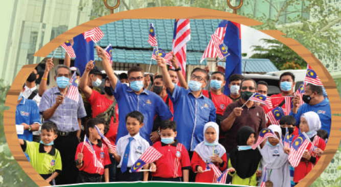
Program Penyerahan Jalur Gemilang Zon Kg. Melayu di Balai Raya Kg. Melayu Tarikh: 26 Ogos 2020