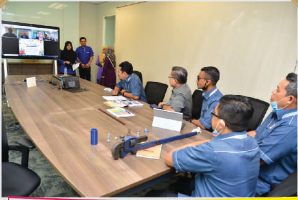
Malaysia Productivity Corporation (MPC) Team Excellence Showcase Tarikh: 23 September 2020