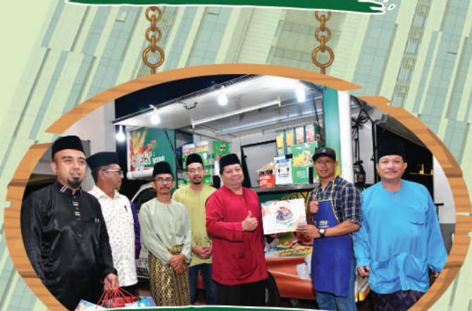
Majlis Kesyukuran Zon Penjaja di Food Truck Sentral, Hotel Sentral Tarikh: 14 Julai 2020