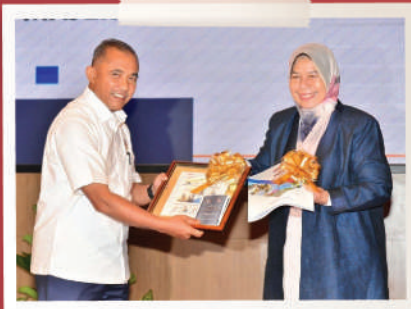
LAWATAN RASMI MENTERI PERUMAHAN & KERAJAAN TEMPATAN KE MBBB