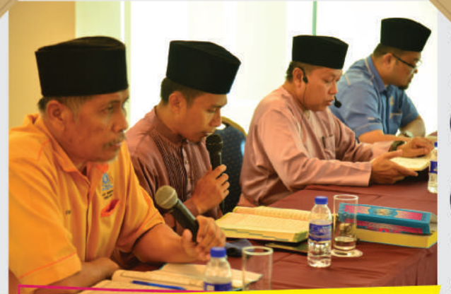
Program Pembudayaan Al-Quran Anggota Majlis Bandaraya Johor Bahru Tarikh: 17 September 2020