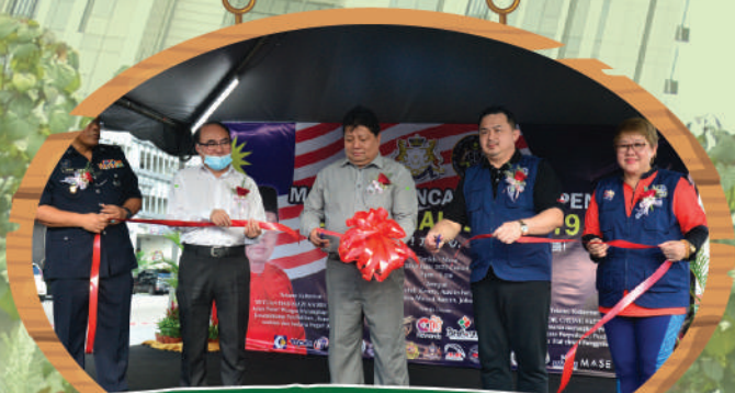
Kempen Jom Cegah COVID-19 Zon Pelangi Indah di Taman Mount Austin Tarikh: 20 Julai 2020