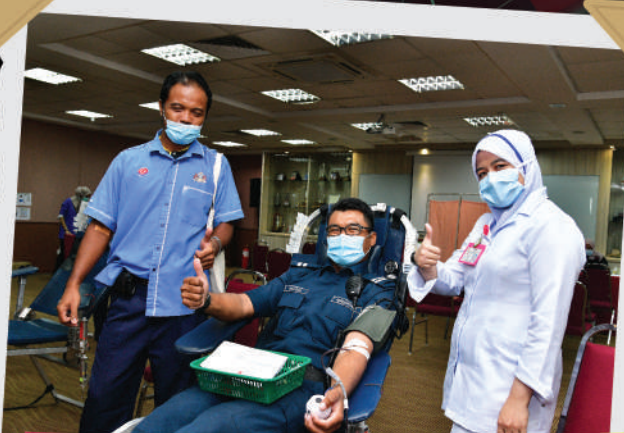
Program Derma Darah Anggota Majlis Bandaraya Johor Bahru Tarikh: 10 Ogos 2020