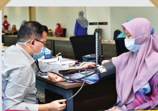
Pemeriksaan Kesihatan Anggota Majlis Bandaraya Johor Bahru Tarikh: 6 – 7 Julai 2020