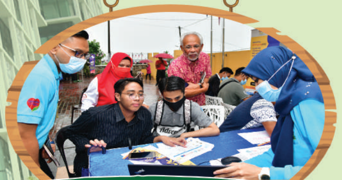
Program Bersama Komuniti Zon Kg. Melayu di Dewan Stulang Baru Tarikh: 5 September 2020