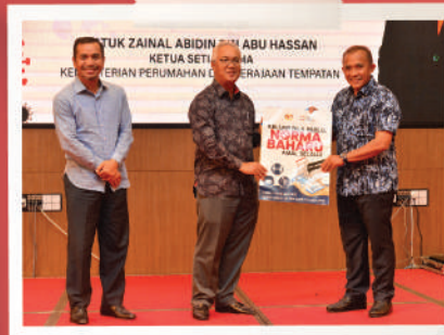
KEMPEN PEMBUDAYAAN NORMA BAHARU PERINGKAT PBT