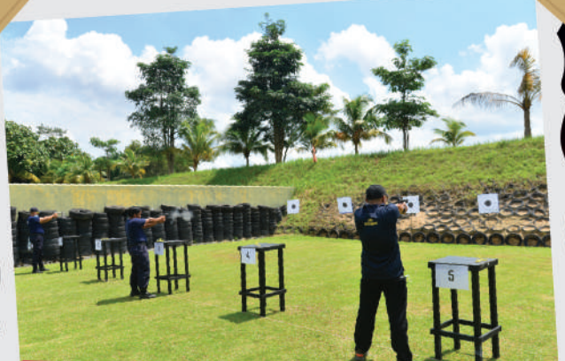
Latihan Menembak oleh 'Team' Pengurusan MBJB di Ladang Rem. Kota Tinggi Tarikh: 12 September 2020