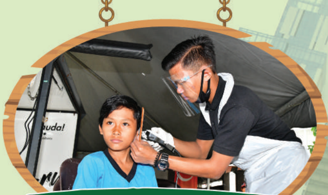
Program Kembali ke Sekolah Zon Tampoi di Kelab Rukun Tetangga (KRT) Taman Kobena Tarikh: 10 Julai 2020