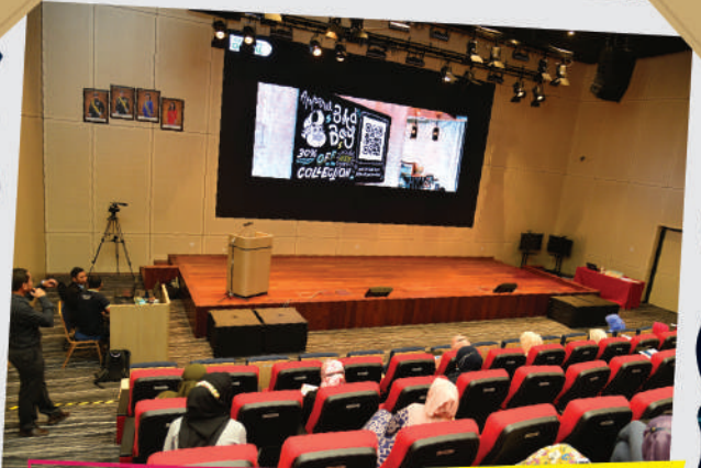
Taklimat Pelaksanaan Sudut Ekosistem Kondusif Sektor Awam (EKSA) Digital Tarikh: 21 September 2020