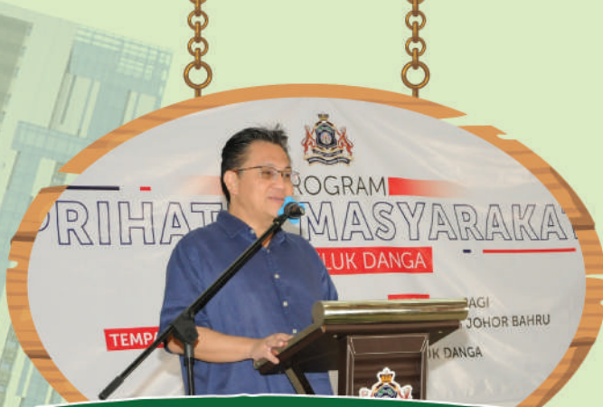
Program Prihatin Masyarakat Zon Teluk Danga di Dewan Raya Jalan Rawa, Taman Perling Tarikh: 5 Julai 2020