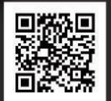
QR code (penerbitan rasmi mbbb)