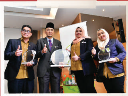
MBJB UNGGUL DI 'GAIA AWARD'