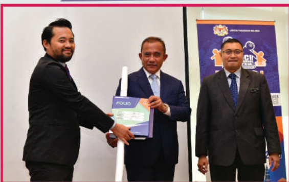
Taklimat Banci Penduduk kepada Pengurusan Majlis Bandaraya Johor Bahru