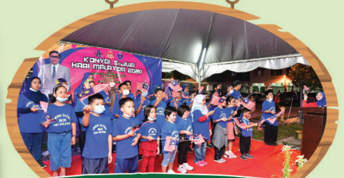
Pelancaran Konvoi Hari Malaysia Zon Bakar Batu di Projek Perumahan Rakyat Hajah Hasnah Tarikh: 15 September 2020