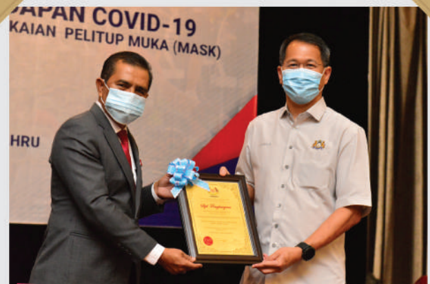
Majlis Penghargaan 'Frontliner' CUEPACS Malaysia Tarikh: 10 Ogos 2020