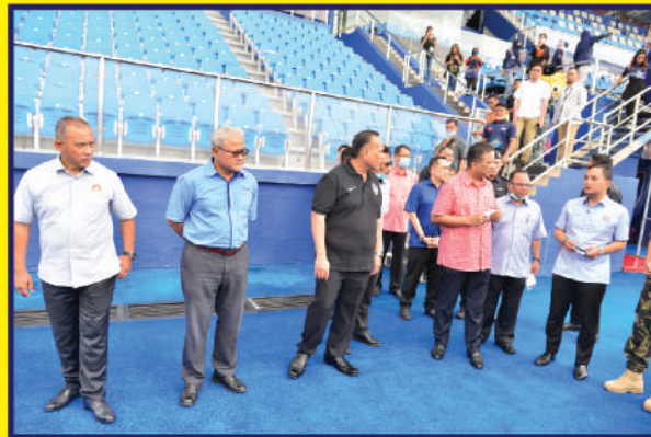
Lawatan oleh YAB Dato' Sri Reezal Merican Naina Merican, Menteri Belia dan Sukan Tarikh: 7 Julai 2020