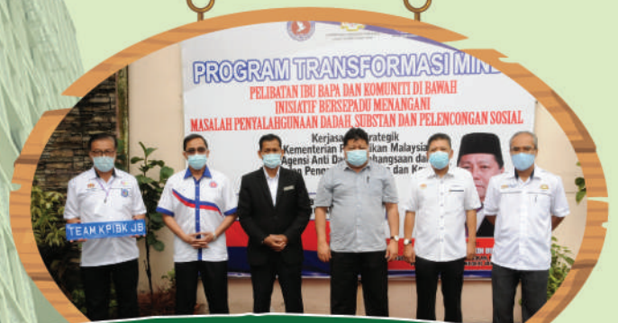
Transformasi Minda Pendidikan Pencegahan Dadah Zon Bandar Baru Uda di Dewan Tan Sri Mohamed Rahmat Tarikh: 12 September 2020