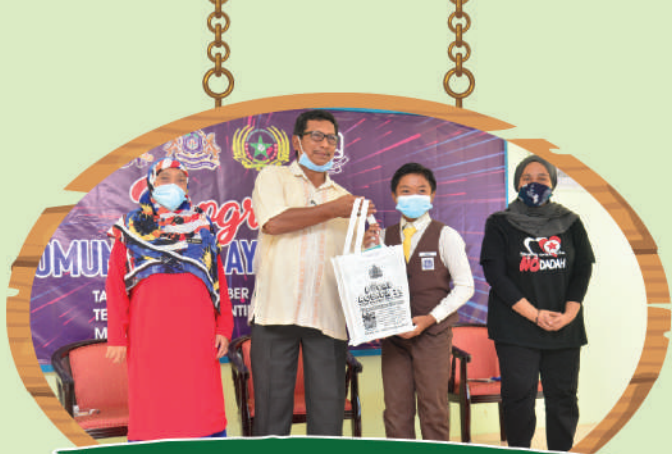
Program Komuniti Zon Teluk Danga di Sekolah Kebangsaan Teluk Danga Tarikh: 20 September 2020