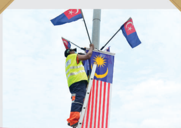
Pemasangan Bendera Malaysia dan Bendera Negeri Johor oleh Anggota Unit Tindakan Cepat (UTC) Tarikh: 11 Ogos 2020