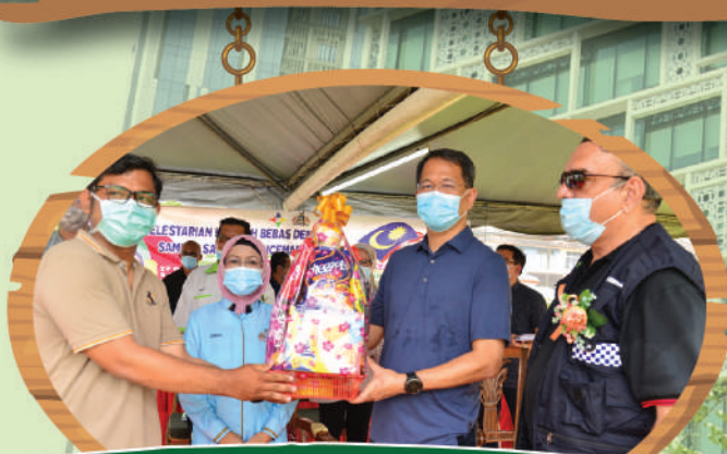
Program Kelestarian Denggi, Sampah dan Pencemaran Zon Kempas di Taman Bukit Kempas Tarikh: 29 Ogos 2020