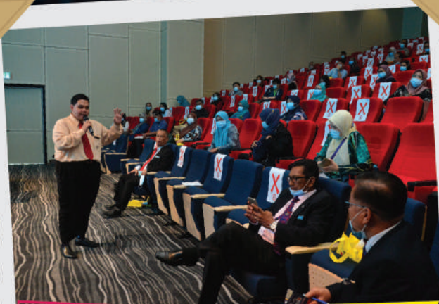
Taklimat Banci Penduduk 2020 Tarikh: 4 Ogos 2020