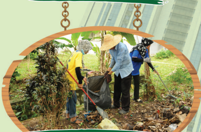
Gotong-Royong Zon Bandar Baru Uda di Pangsapuri Ledang, Jalan Padi Mahsuri Tarikh: 11 Julai 2020