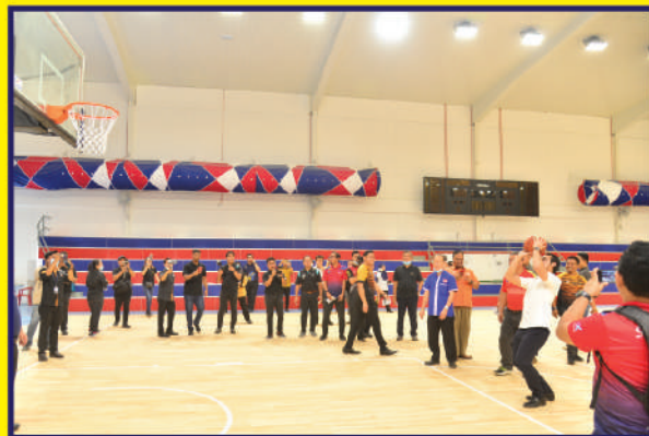
Lawatan oleh YB Senator Wan Ahmad Fayshal Wan Ahmad Kamal, Timbalan Menteri Belia dan Sukan Tarikh: 21 Julai 2020