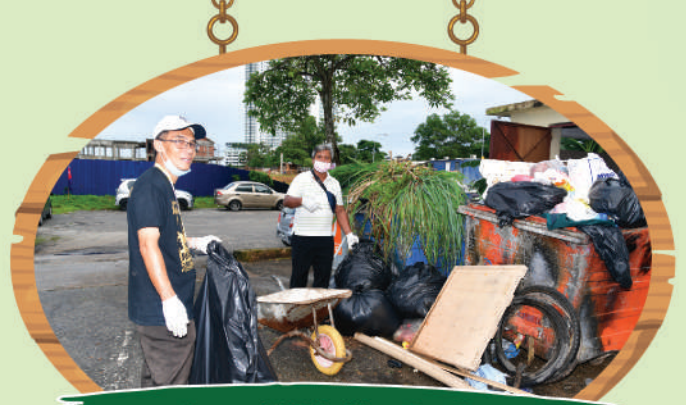
Program Komuniti Kebajikan Zon Mount Austin di Rumah Pangsa Mount Austin Tarikh: 16 September 2020