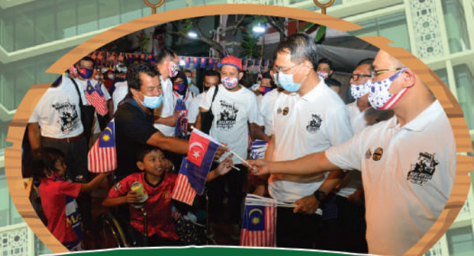
Program Ambang Merdeka Zon Bandar di Bazar JB Tarikh: 30 Ogos 2020