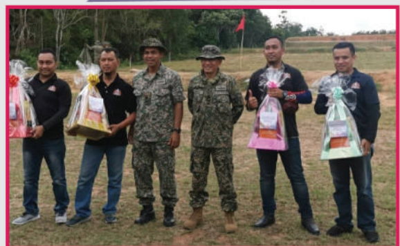
'Team MBBJ' Menang Acara Menembak Jatuh Piring antara Jabatan

9 September 2020 - Sebuah sesi taklimat berkenaan pelaksanaan bancian penduduk telah diadakan bersama barisan pengurusan Majlis Bandaraya Johor Bahru sebagai usaha menyokong pelaksanaan banci yang diusahakan oleh Jabatan Perangkaan Malaysia. Banci Penduduk dan Perumahan Malaysia 2020 ini diadakan 10 tahun sekali dan dijalankan di semua kawasan perumahan dan kediaman di seluruh Malaysia pada tahun ini. Pelaksanaannya merujuk peruntukan yang terkandung dalam Akta Banci 1960 (disemak 1969).