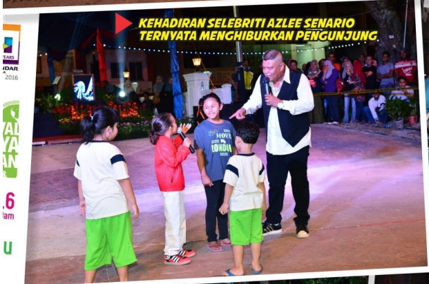
KEHADIRAN SELEBRITI AZLEE SENARIO TERNATA MENGHIBURKAN PENGUNJUNG