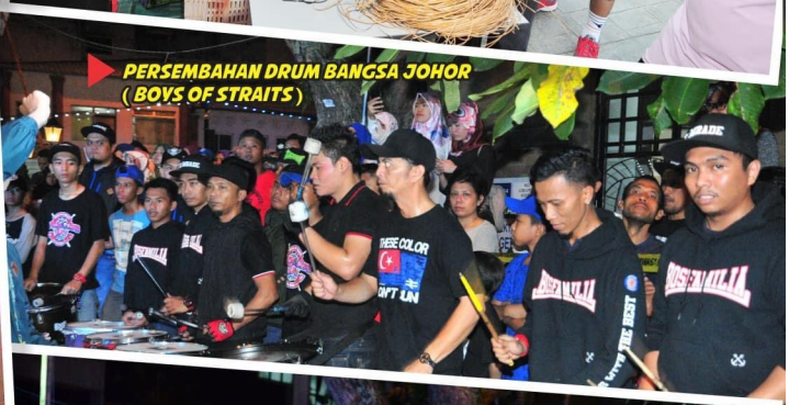
PERSEMBAHAN DRUM BANGSA JOHOR (BOYS OF STRAITS)