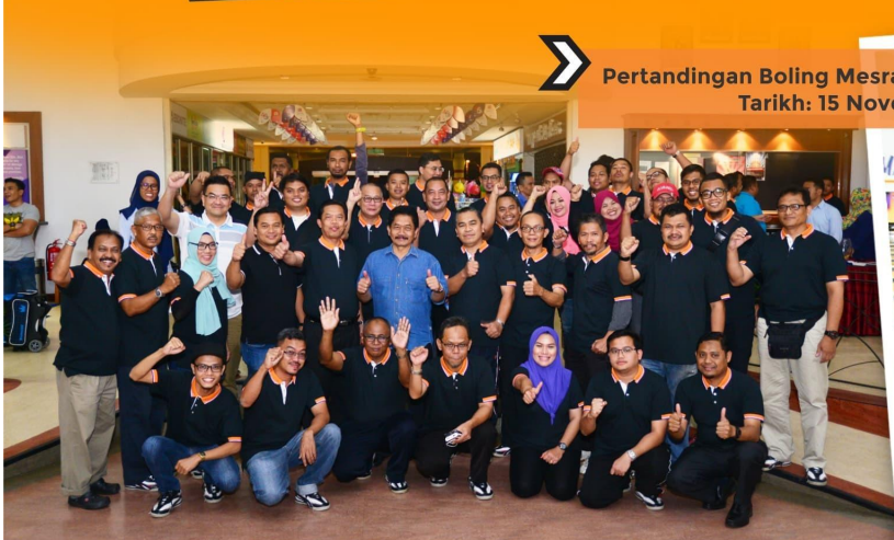
Pertandingan Boling Mesra Media di Daiman Bowl Tarikh: 15 November 2016