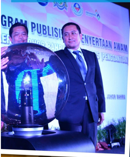
Perasmian Program Publisiti & Penyertaan Awam Draf Rancangan Tempatan di PERSADA, Johor Bahru Tarikh: 1 November 2016