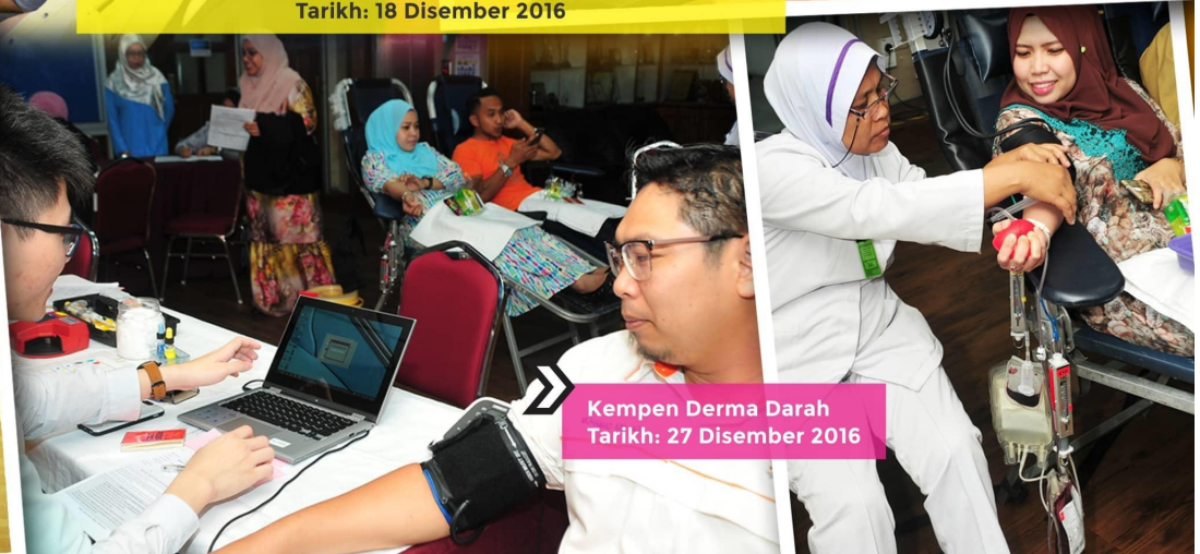
Kempen Derma Darah Tarikh: 27 Disember 2016