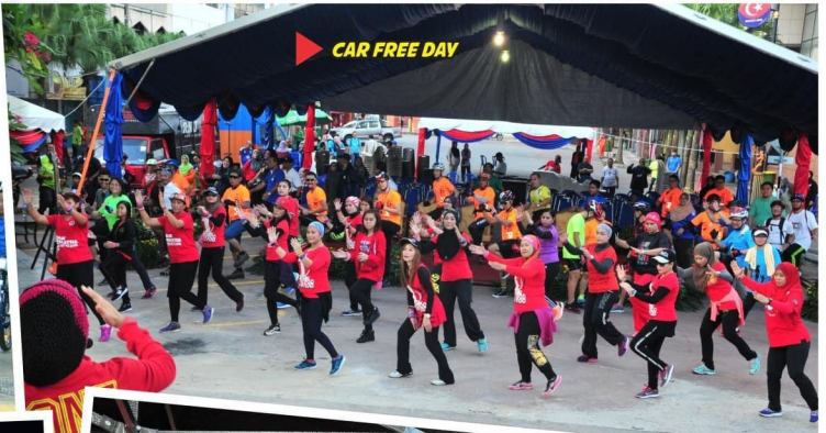
CAR FREE DAY