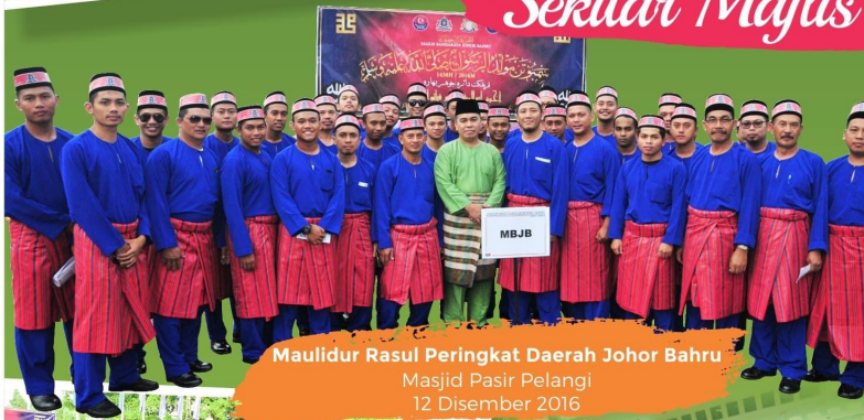
Maulidur Rasul Peringkat Daerah Johor Bahru Masjid Pasir Pelangi 12 Disember 2016