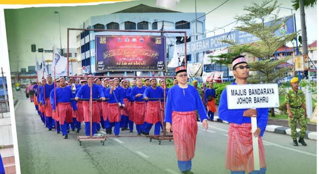
PONTIAN, 13 Disember 2016 – MJB telah memperoleh Tempat Pertama dalam Kategori Sepanduk dan Tempat Ketiga dalam Kategori Perarakan dan Pakaian Terbaik Bersempena Sambutan Maulidur Rasul Peringkat Daerah Johor Bahru. Tahniah MJB!