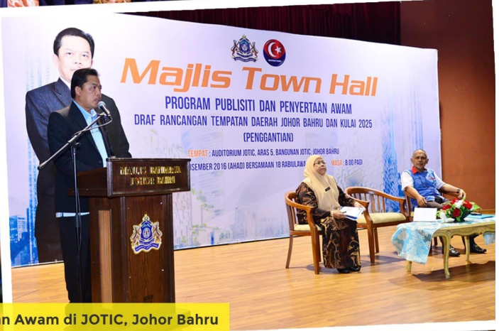
Town Hall Publisiti & Penyertaan Awam di JOTIC, Johor Bahru Tarikh: 18 Disember 2016