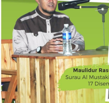
Maulidur Rasul Zon Kempas Surau Al Mustakim, Kempas Denai 17 Disember 2016