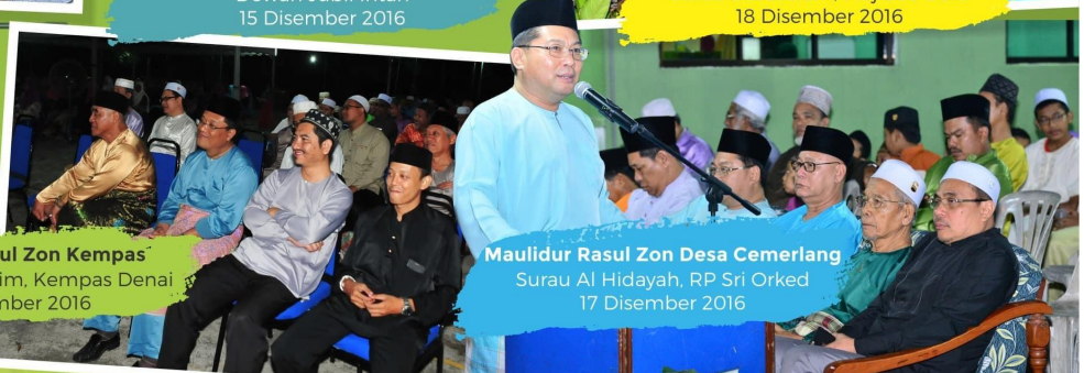
Maulidur Rasul Zon Desa Cemerlang Surau Al Hidayah, RP Sri Orked 17 Disember 2016