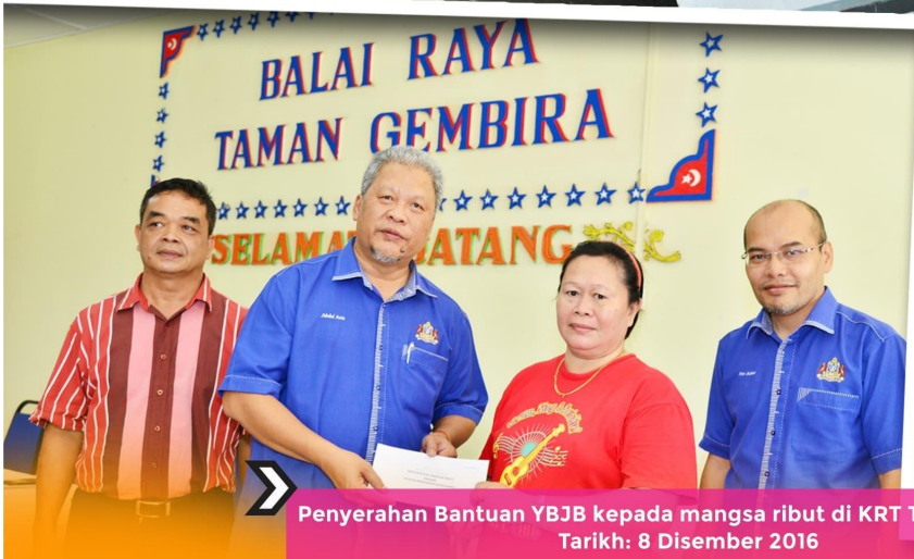
Penyerahan Bantuan YBBB kepada mangsa ribut di KRT Taman Gembira Tarikh: 8 Disember 2016