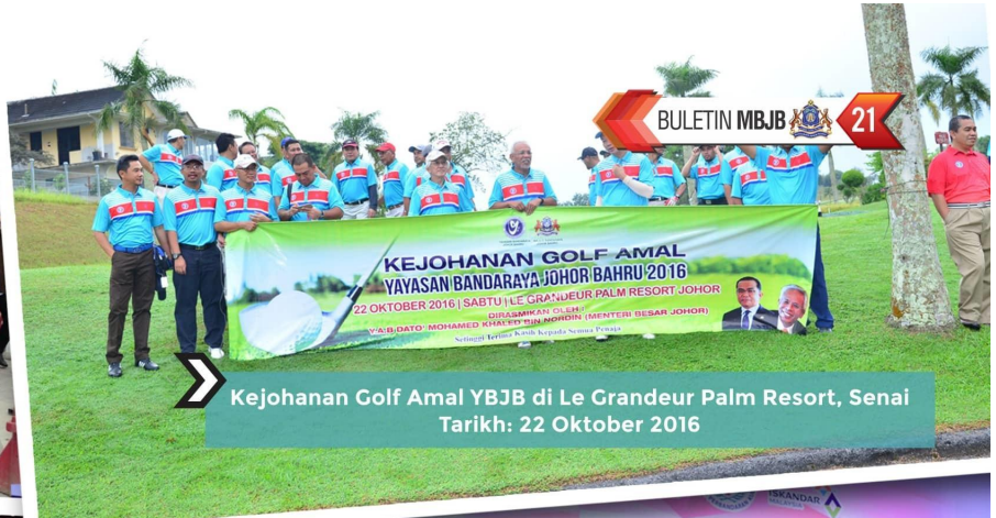
Kejohanan Golf Amal YJB di Le Grandeur Palm Resort, Senai Tarikh: 22 Oktober 2016