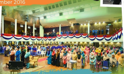
Maulidur Rasul Peringkat MJB Dewan Jubli Intan 15 Disember 2016