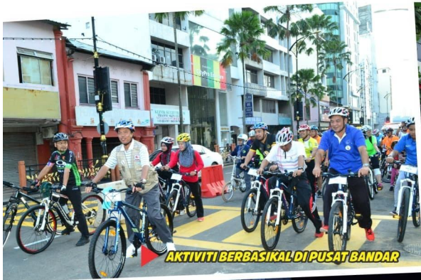
AKTIVITI BERBASIKAL DI PUSAT BANDAR