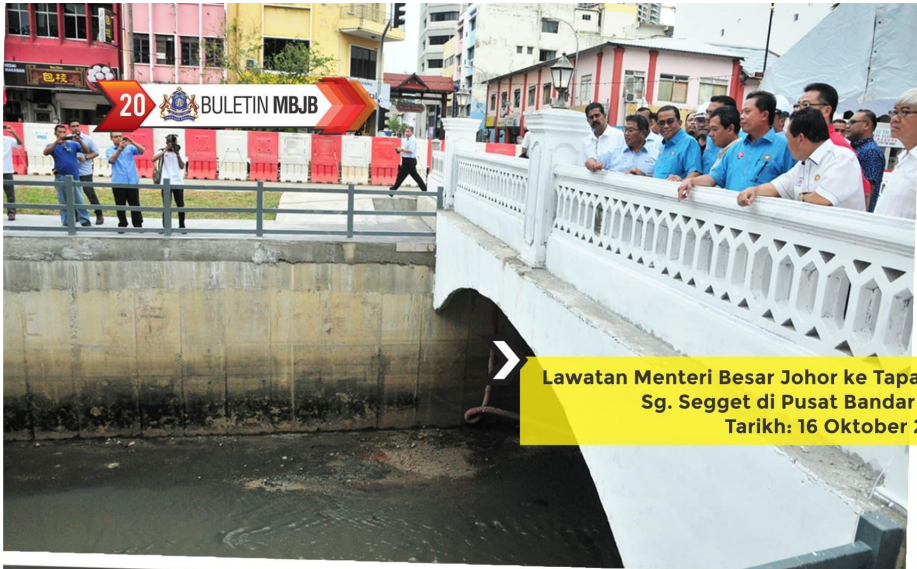
Lawatan Menteri Besar Johor ke Tapak Projek Pengindahan Sg. Segget di Pusat Bandar Johor Bahru Tarikh: 16 Oktober 2016