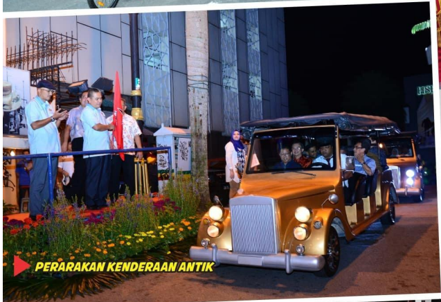
PERARAKAN KENDERAAN ANTIK