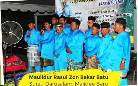
Maulidur Rasul Zon Bakar Batu Surau Darussalam, Majidee Baru 18 Disember 2016