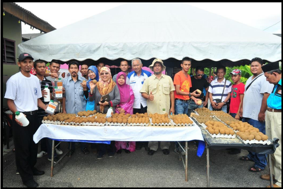
Bengkel Mudball Zon Kg. Melayu Majidee di Sg. Sebulong Tarikh: 5 Mac 2016