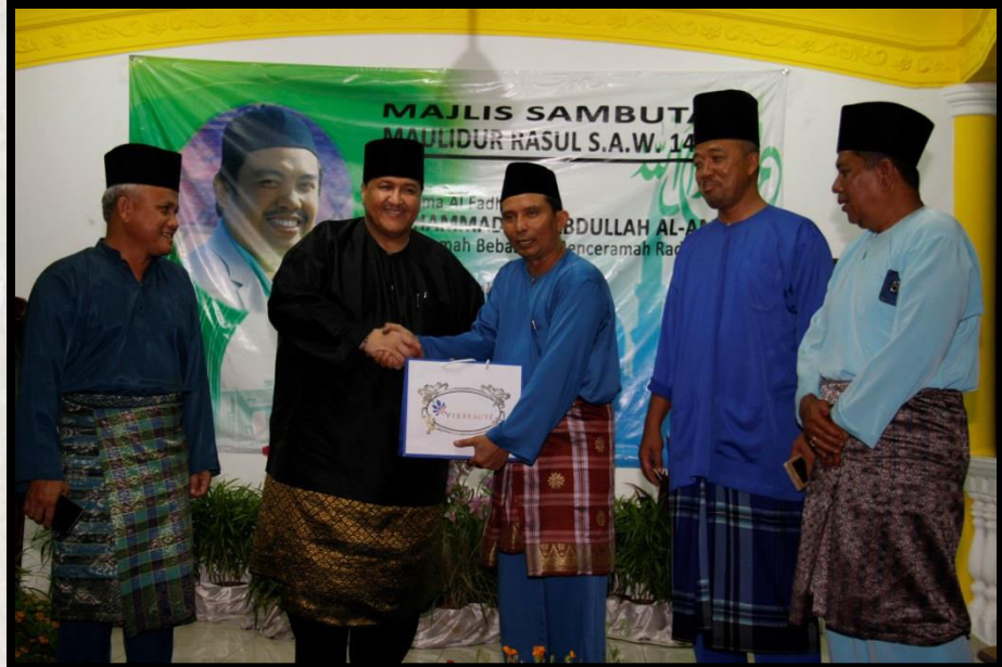
Maulidur Rasul Zon Taman Johor di Taman Putra Tarikh: 5 Mac 2016