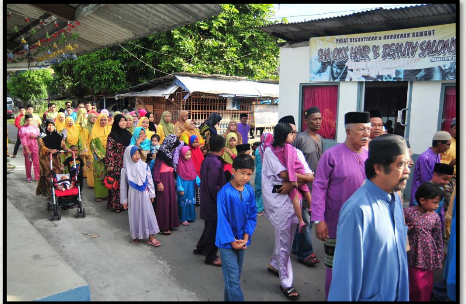
Maulidur Rasul Zon Larkin di Kg. Sri Paya Larkin Tarikh: 5 Mac 2016