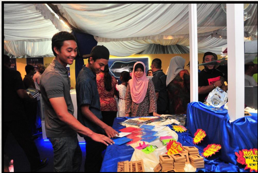
Treasure Hunt Jejak Warisan Puteri Urus Setia: Jabatan Bangunan

Tahniah dan syabas kepada semua warga kerja Majlis Bandaraya Johor Bahru yang telah bersama-sama menayakan Festival Hari Keputeraan DYMM Sultan Johor Edisi 2016!