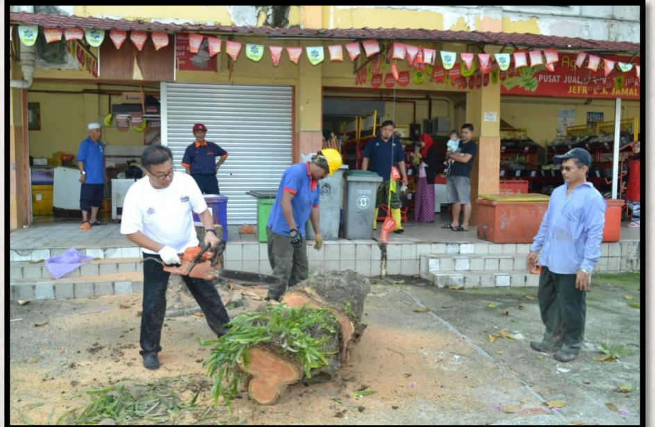
Gotong-royong Denggi Zon Bandar Baru Uda Tarikh: 12 Mac 2016