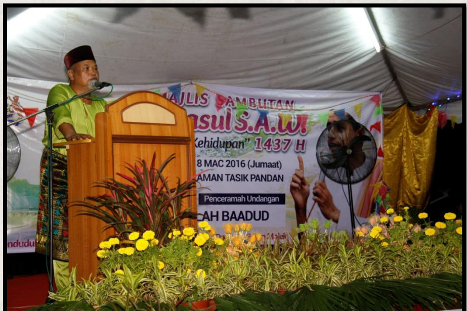
Maulidur Rasul Zon Pandan di Taman Sri Pandan Tarikh: 18 Mac 2016